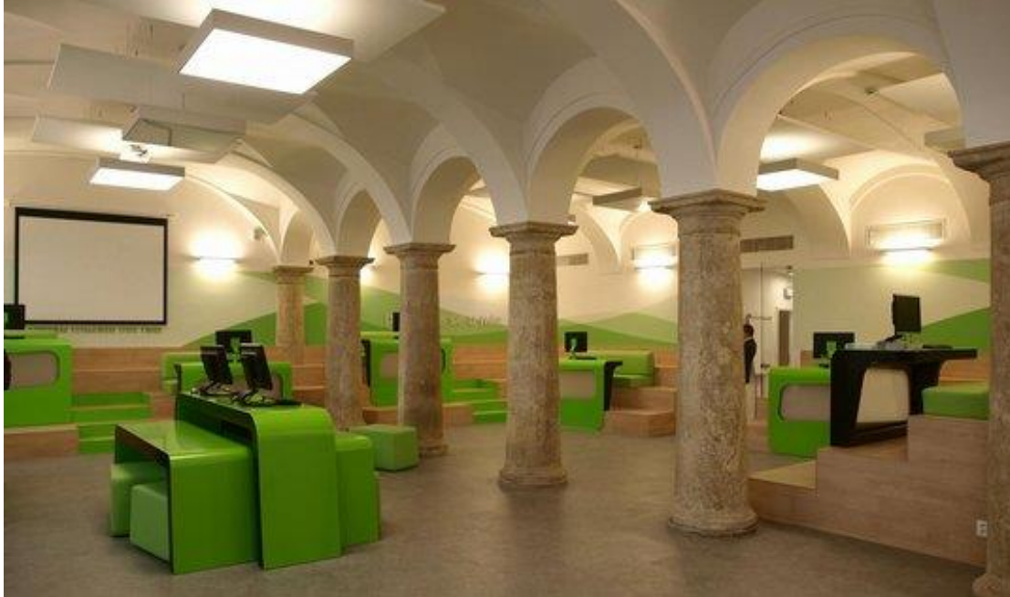
Příloha č. 3: Sloupy v pobočce Air Bank ve Vodičkově ulici (obrázek)