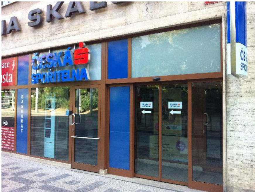
Příloha č. 11: Ukázka exteriérového značení České spořitelny (obrázek)