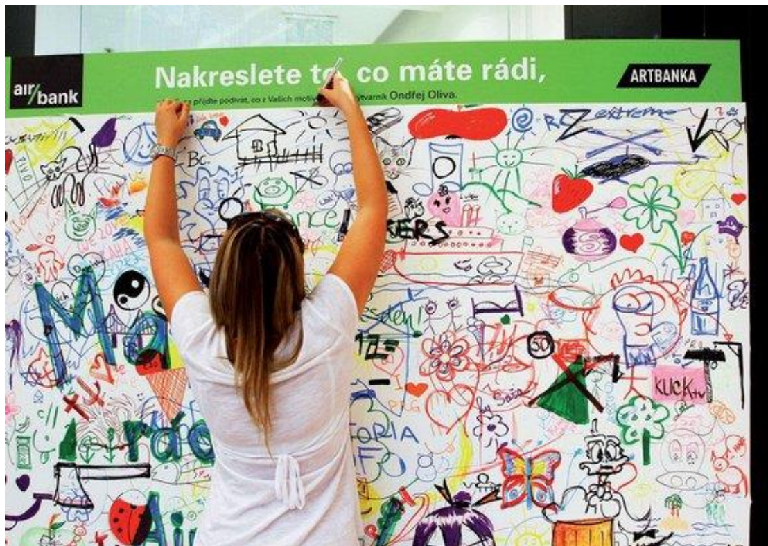
Příloha č. 7: Ukázka malování při BankETu (obrázek)