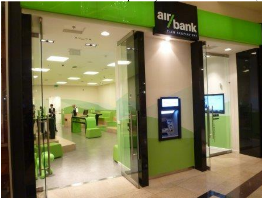
Příloha č. 4: Exteriérové značení pobočky uvnitř obchodního domu (obrázek)