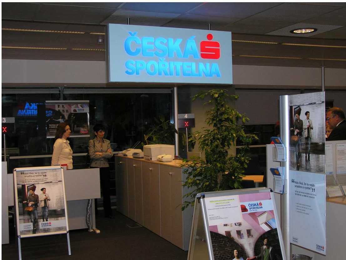
Příloha č. 12: Ukázka přesyceného vnitřního prostoru pobočky České spořitelny (obrázek)