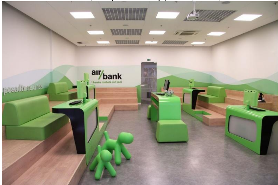
Příloha č. 8: Ukázka nebezpečné plastové hračky pro děti (obrázek)