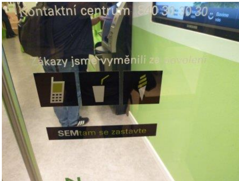
Příloha č. 5: Piktogramy na vstupních dveřích pobočky (obrázek)