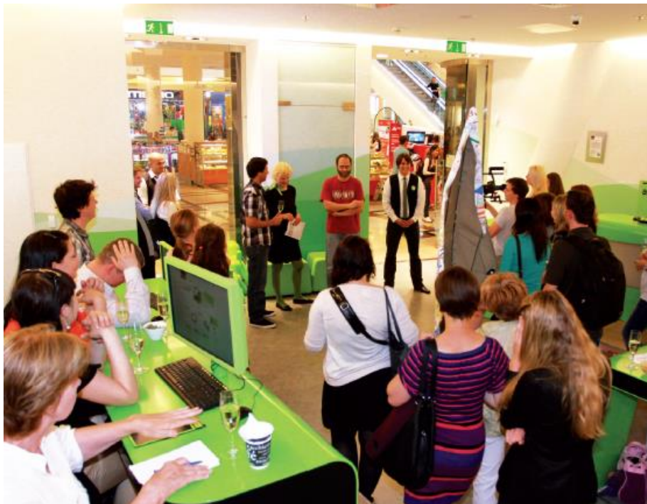
Příloha č. 6: Ukázka BankETu na pobočce v Palladiu (obrázek)