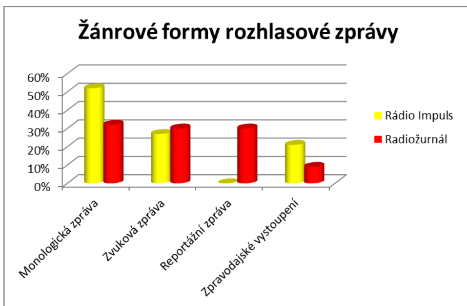
Graf č. 3: Žánrové formy rozhlasové zprávy

Nejčastěji používanou žánrovou formou rozhlasové zprávy je monologická zpráva. Stanice se ale liší v podílu, jaký jim věnují. Pro Rádio Impuls je tento typ dominantní – 52%, také na Radiožurnálu je monologická zpráva nejpoužívanější, v průběhu vysílání je to ale jen 1/3. Na rozdíl od Impulsu zařazuje Radiožurnál do své relace také reportážní zprávu.