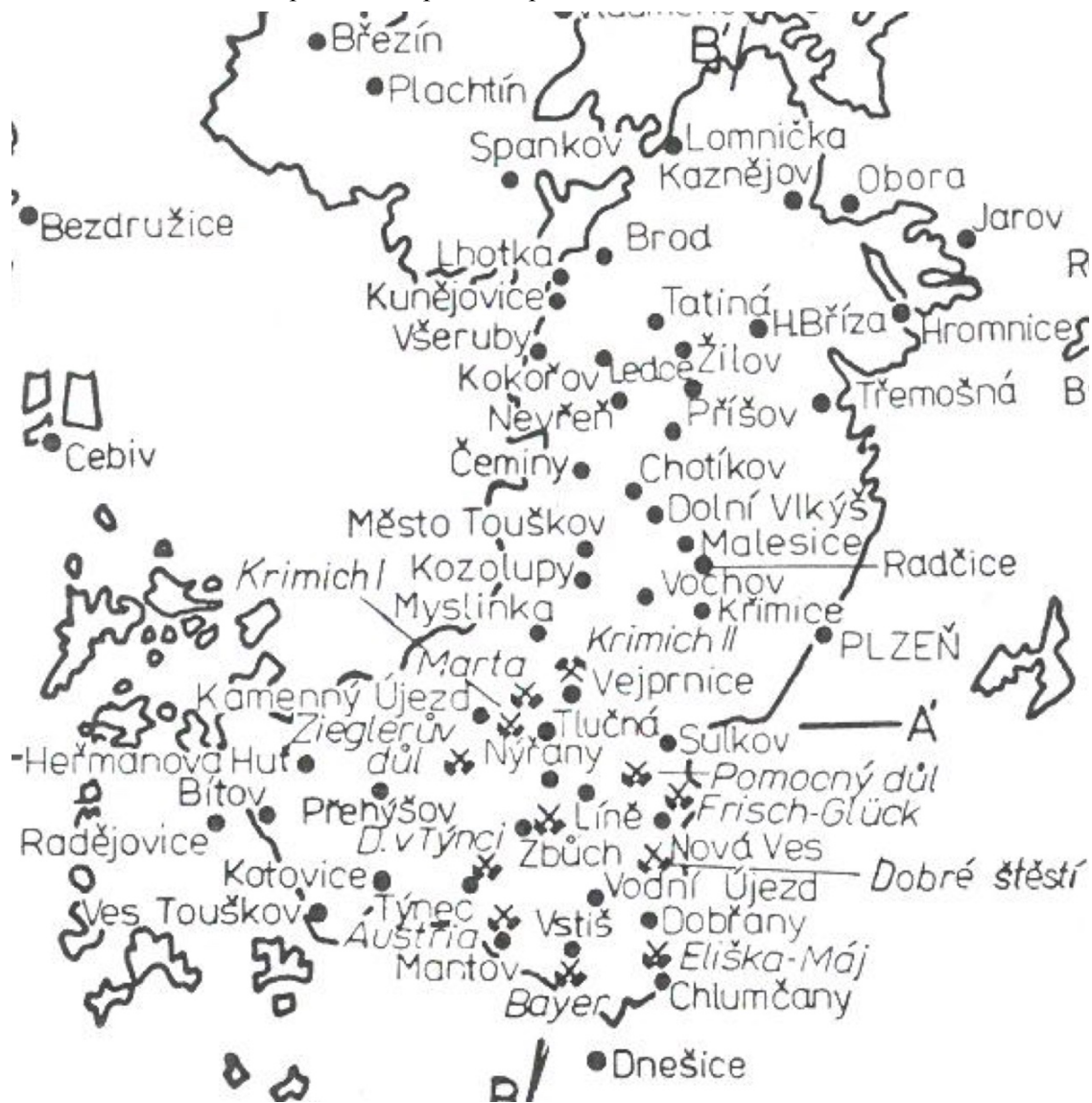
Příloha 4 Orientační mapa lokalit v plzeňské pánvi