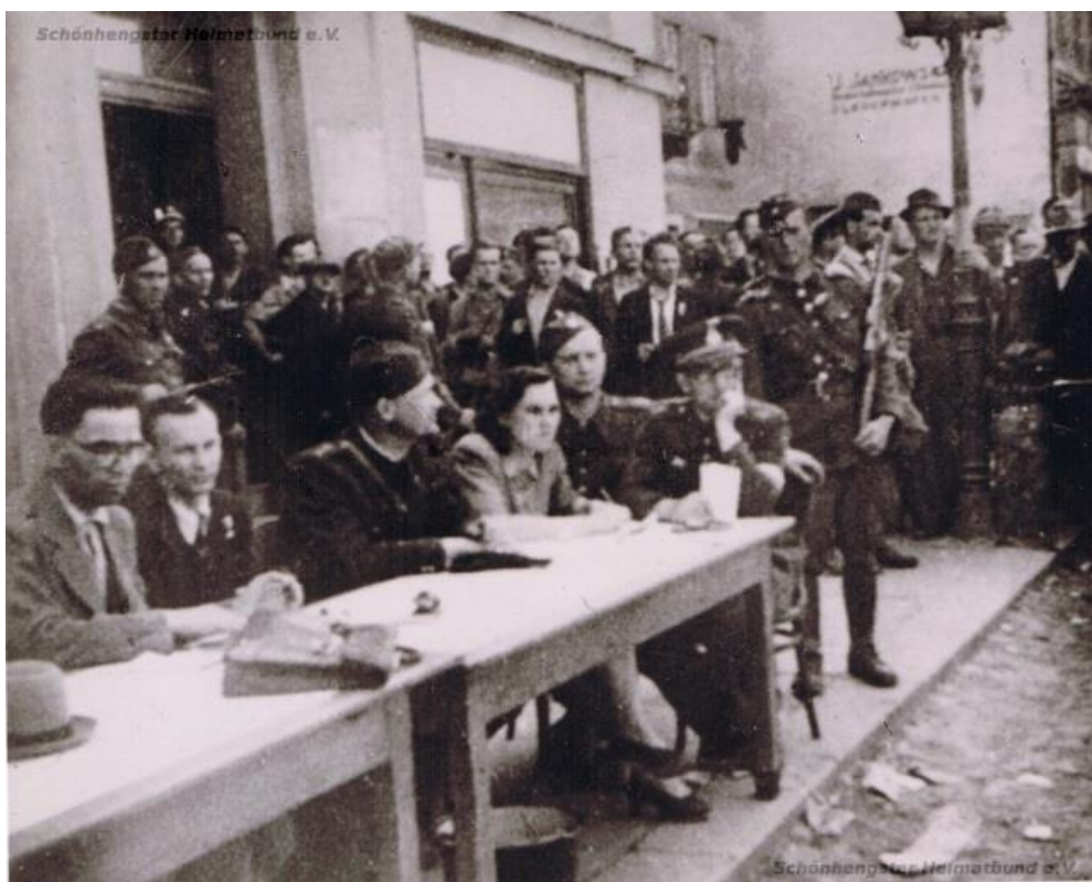
Obrázek 3: Stůl na náměstí před „obecním úřadem“ a za ním sedící soudci 223