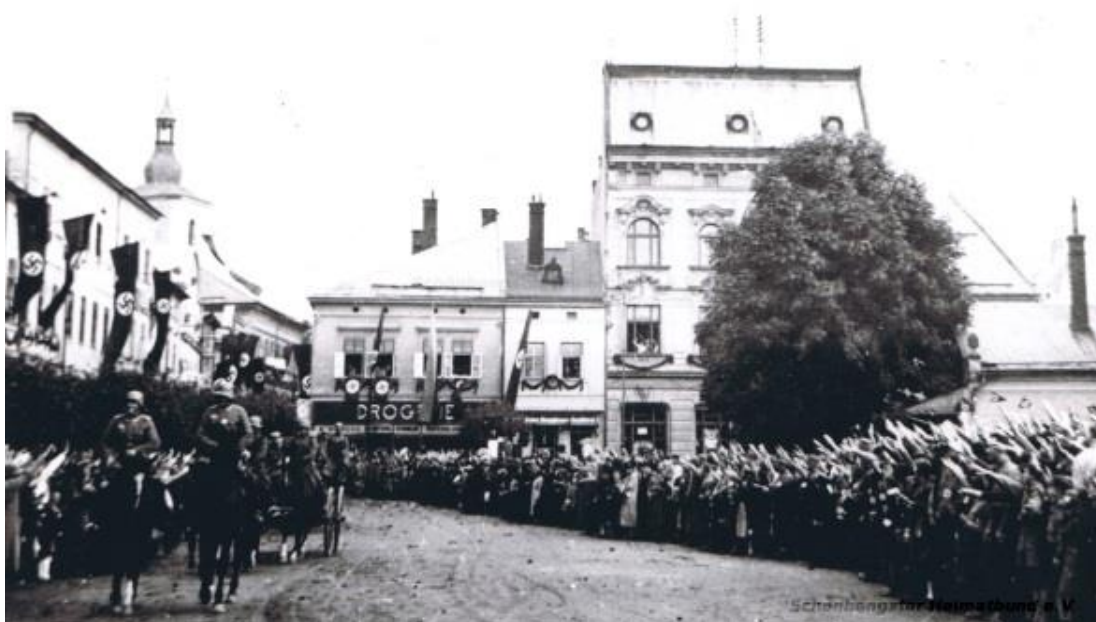
Obrázek 1: Osvobození Lanškrouna Wehrmachtem 10. 10. 1938 185