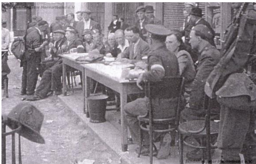
Obrázek 2: Soudcovský stůl 205

materiál odboje, seznamy odbojářů, ilegálních skupin a záznamy o zpravodajské činnosti. V neposlední řadě byly pod mlýnem skryty seznamy nacistických funkcionářů (členové gestapa, SA a SS), 201 pracovní plány a plány na rychlé zajištění či zneškodnění nacistů při případném převratu. 202 V seznamech například stálo: „ Doktor Kellner, zubní lékař. Zuřivý Němec. Ze všech lékařů nejhorší. “ 203 nebo „ Merkner. Zuřivý nacista, říšák, esesák, neomezený městský vladař. “ 204 I na základě těchto a podobných údajů byli Němci pohnáni před lidový soud (viz obrázek 3).