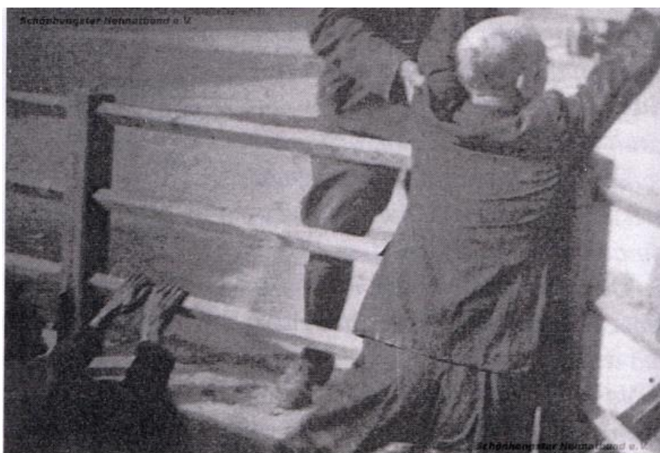
Obrázek 8: Vytahování Němců z požární nádrže 250

Dle Friedela ozbrojení Češi se a vyžívali v šikanování Němců, „kopali muže do pohlavních orgánů a do holení, mlátili je všemožnými předměty, plivali na ně a zejména kolem sebe divoce stříleli.“ 247 Raněné pak naházeli do protiletadlové vodní nádrže před radnicí a drželi je pomocí tyčí a klacků pod vodou, na ty, kteří se vynořili, stříleli, až se voda zbarvila do ruda. Těm, co se podařilo přežít, šlapali po prstech 248 (viz obrázek 9 a 10). Zřejmě vinou špatného překladu Friedlovy výpovědi vznikla nesmyslná informace, že proti Němcům v nádrži byl užit plamenomet. 249