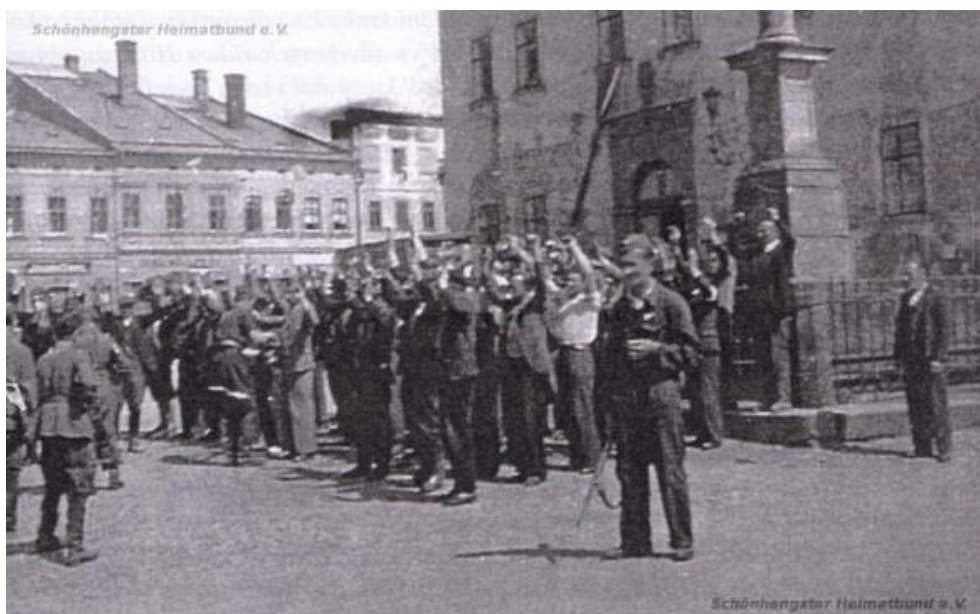
Obrázek 6: Němci držící ruce nad hlavou (před radnicí) 245