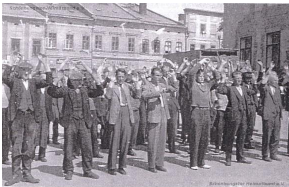
Obrázek 5: Němci s rukama nad hlavou 244

Civilisté si svévolně vybírali oběti, které měly předstoupit před tribunál, poslední kroky k soudcovskému stolu se plazily po kolenou. Vyvečení Němci byli odsouzeni buď ke smrti zastřelením, nebo oběšením, při nejmenším byli odsouzeni k trestu bitím 10 až 100 ranami. Sociální demokraté a komunisté byli přemístěni před radnici a celý den museli přihlížet masakru. V požární nádrži protivzdušné obrany byli Němci topeni a partyzáni po nich stříleli 243 (viz obrázek 8).