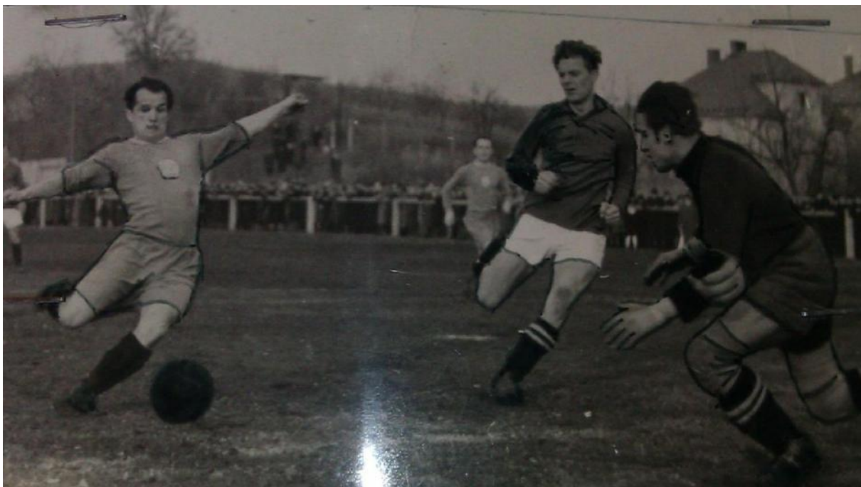
Příloha 10: Fotografie – „Kutnohorské derby“, zápas Sparta – AFK Respo 181