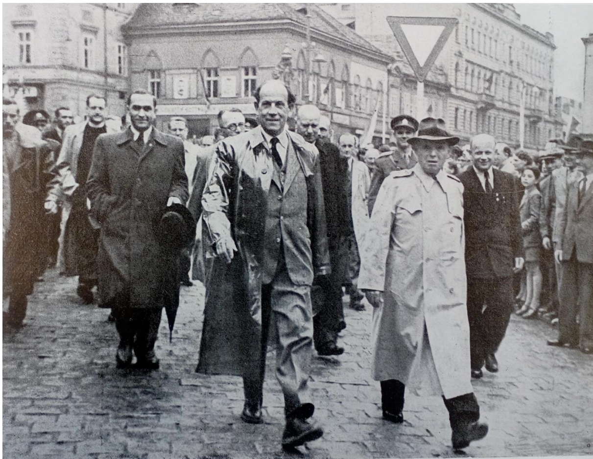
Příloha 3: Fotografie - návštěva vládní delegace v čele s předsedou vlády a budoucím prezidentem Antonínem Zápotockým v Kutné Hoře 173