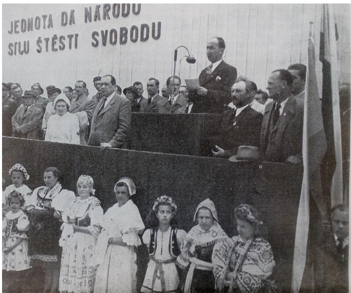
Příloha 9: „Májové oslavy“ v Kutné Hoře 180