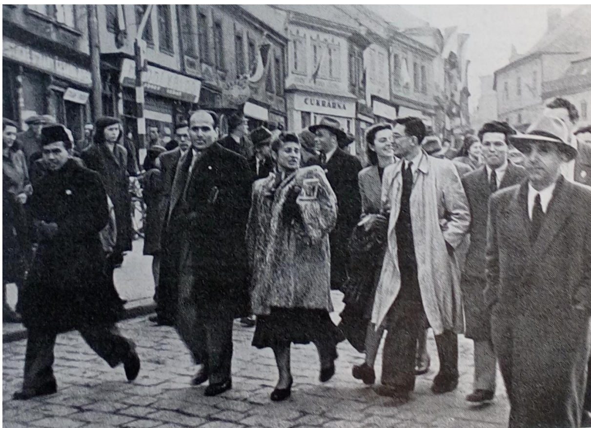
Příloha 8: Fotografie z kutnohorské divadelní sezóny 179