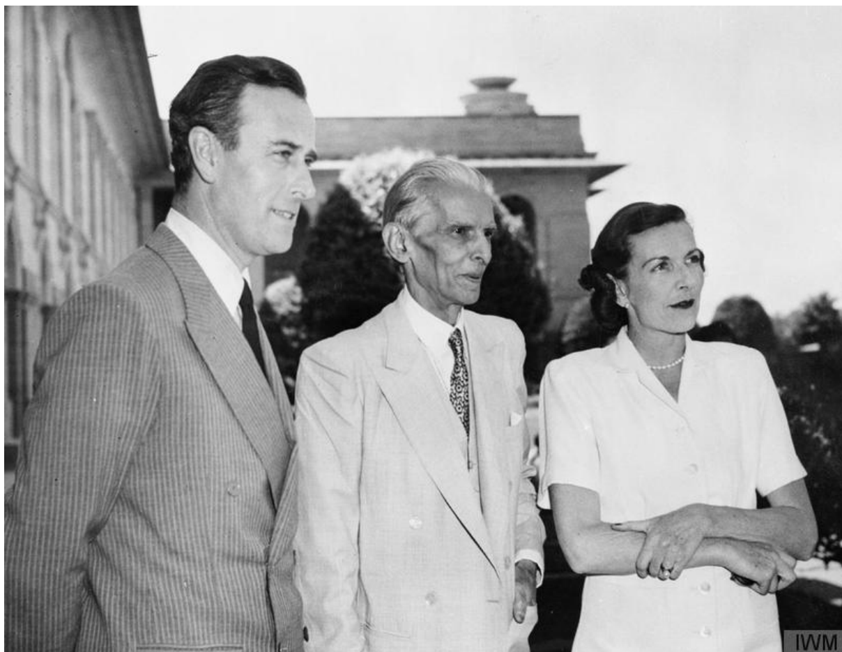
4. Lord Mountbatten s manželkou a otcem Pákistánu Muhammadem Alím Džinnáhem. 4