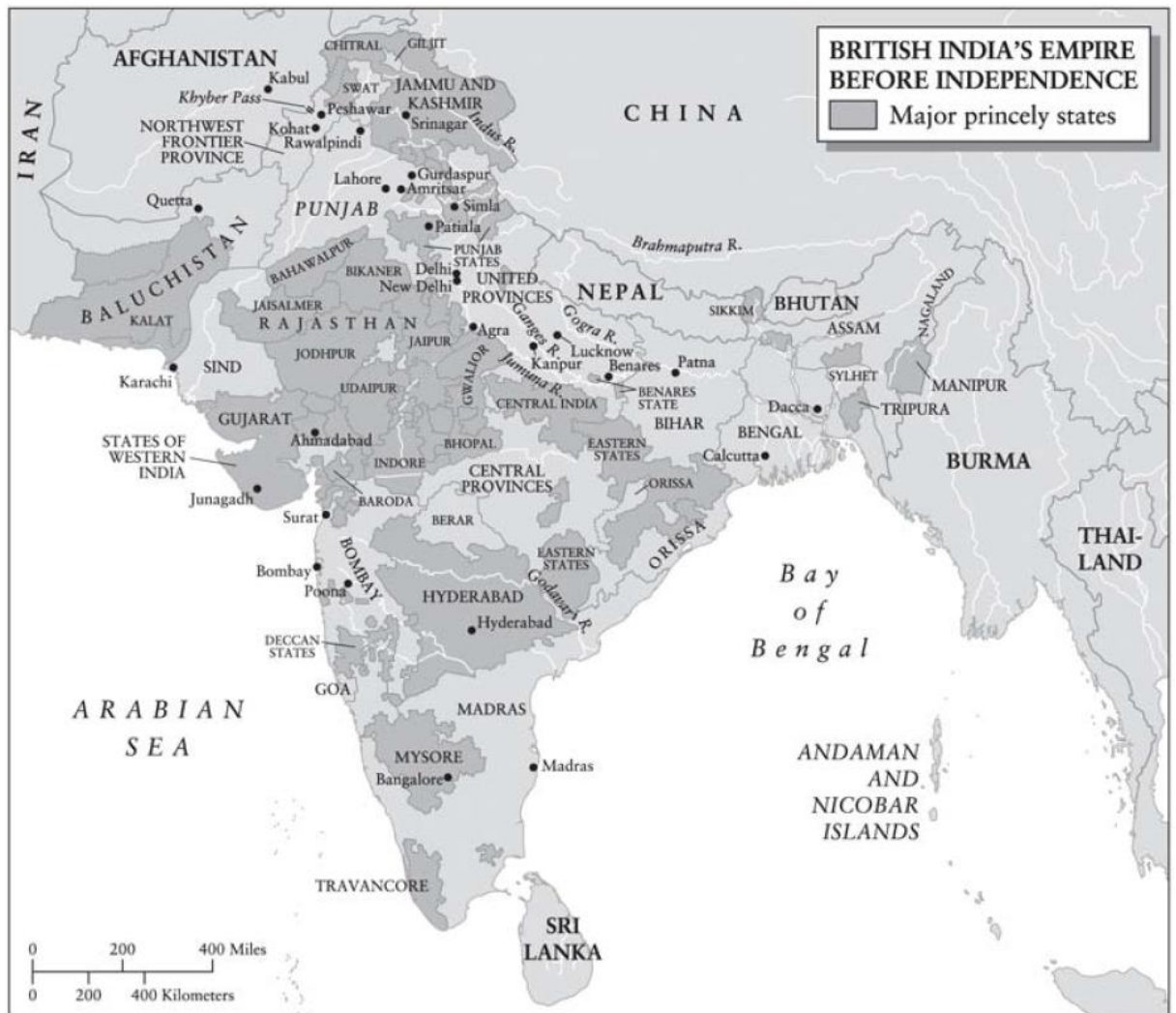
1. Mapa Britské Indie před získáním nezávislosti. 1