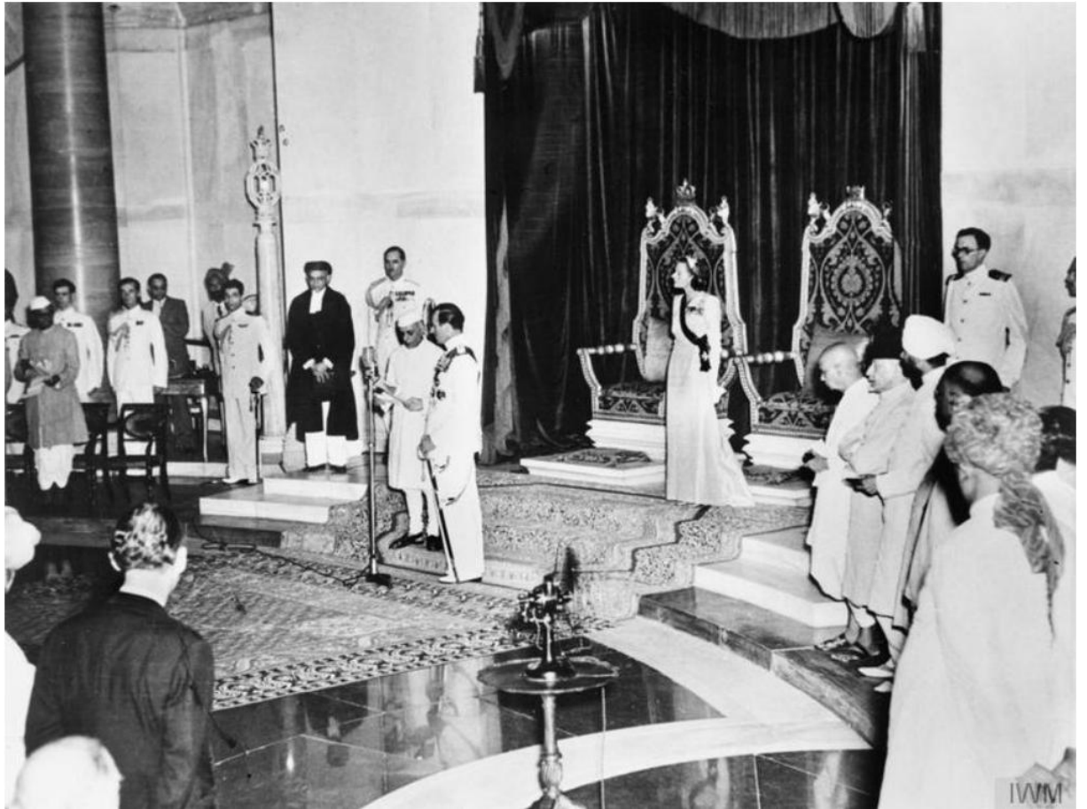
5. Mountbatten uvádí do úřadu ministerského předsedy Džaváharlála Néhrúa. 5