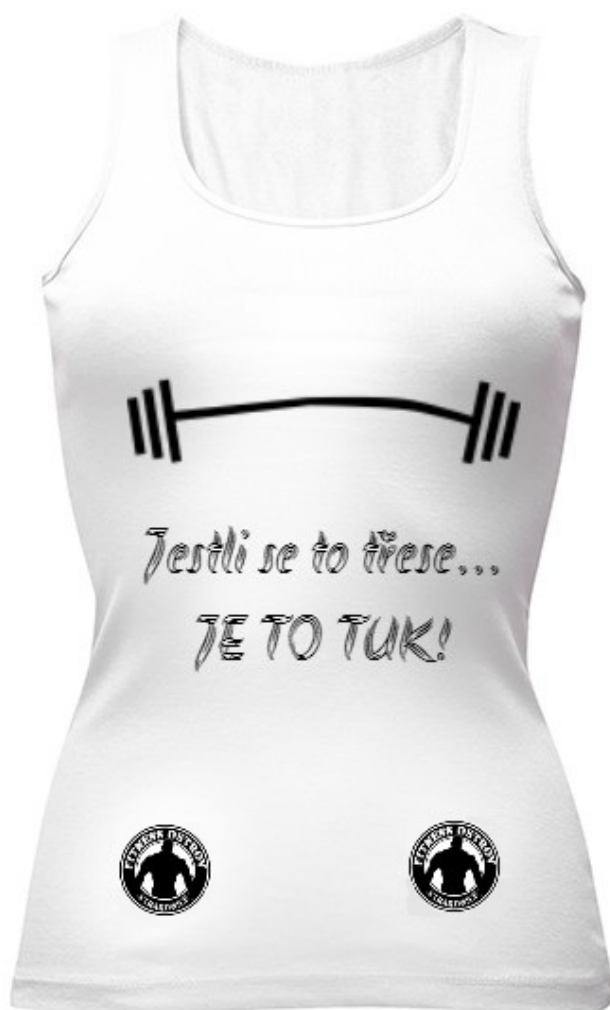
Příloha č. 7: kostým hostesek (přední část)