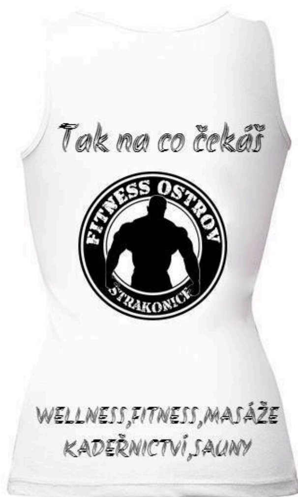
Příloha č. 10: pánské tílko (zadní část)