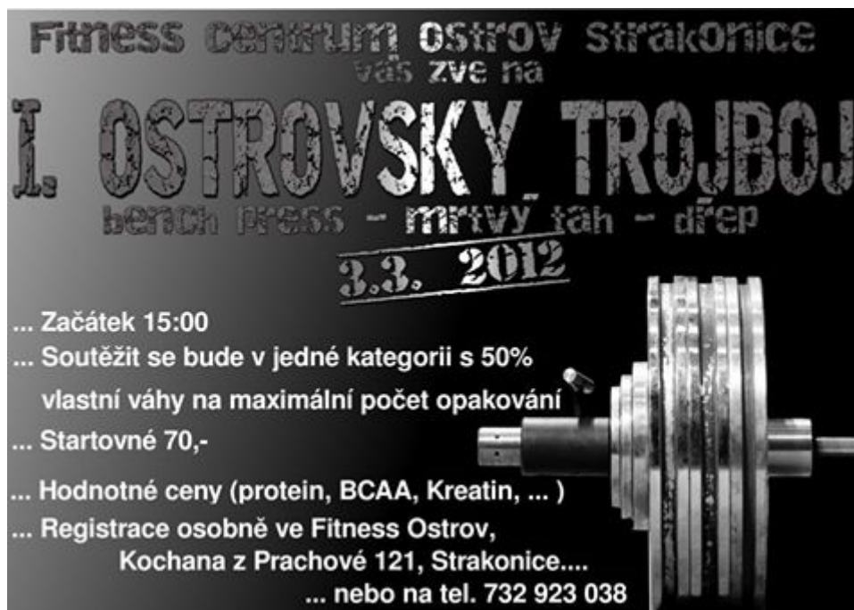
Příloha č. 4: Jednorázové plakáty Relaxačního centra Ostrov (fitness)