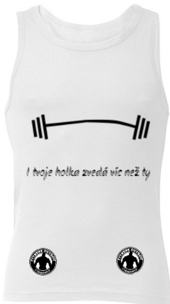
Příloha č. 9: pánské tílko (přední část)