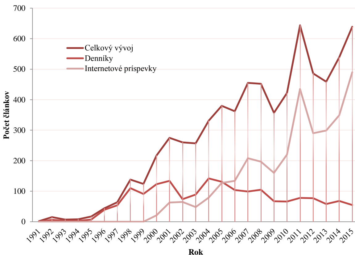
Graf č. 2: Vývoj počtu mediálnych správ v rokoch 1991- 2015