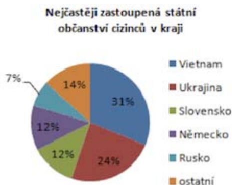
Graf 1: Procentní vyjádření cizinců dle státního občanství v Ústeckém kraji.

V České republice existují regiony s výraznějším podílem cizinců na celkovém počtu obyvatel. Takový je i případ Ústeckého kraje, na jehož území podle posledního cenzu z roku 2011 žije 30 607 cizinců s přechodným či trvalým pobytem, z čehož 11 212 jsou občané jiné země EU [6], přičemž celkový počet obyvatelstva tohoto kraje se rovná 826 023. To sice ukazuje na mírný nárůst počtu cizinců ve srovnání s předchozím obdobím, ovšem tento nárůst se pohybuje pouze v řádech desítek. Nicméně dlouhodobě lze hovořit o jednom z krajů s nejvyšším počtem cizinců po hlavním městě Praha, přičemž mezi nejpočetnější skupiny dle státní příslušnosti patří občané Vietnamu, Ukrajiny, Slovenska, Německa a Ruska. Mezi skupiny početně méně významné, ovšem pro Ústecký kraj (ne jako jediný) specifické, můžeme zařadit například občané Mongolska a Kazachstánu.