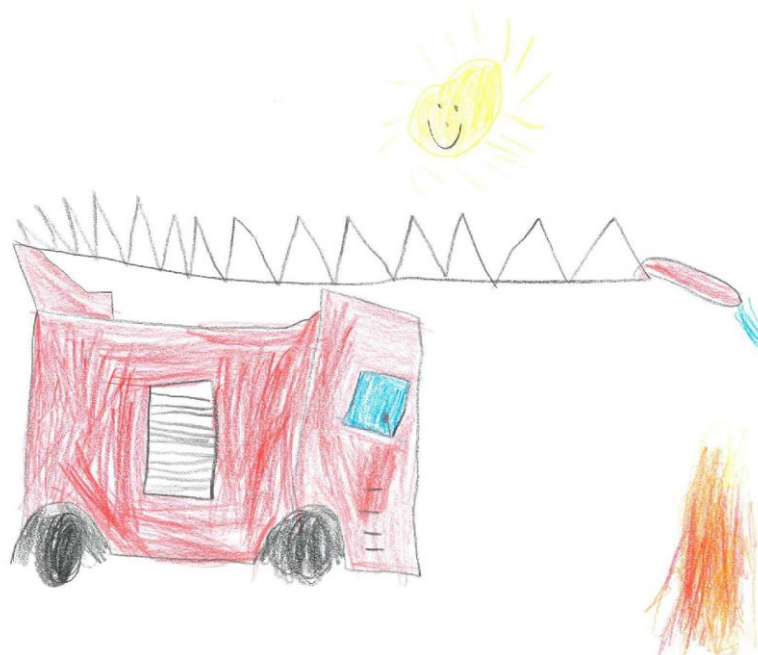
Obrázek č. 4 – Ukázka kresby s technickým motivem

Z tabulky se dozvídáme, že děti nejčastěji kreslily jako typ dopravního prostředku loď a traktor. Oba typy byly ztvárněny celkem třikrát. Dále to byla letadla a nákladní auta, která se objevila na dvou kresbách. Dále se na obrázcích pak vyskytlo hasičské auto, osobní auto, stíhačka či tank.