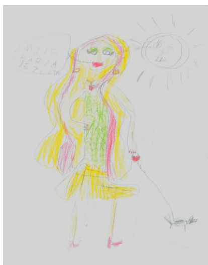
Obrázek č. 3 – Ukázka kresby s figurálním motivem

Tabulka č. 10 mapuje výskyt jednotlivých podkategorií, výskyt a procentuální zastoupení konkrétních podkategorií jak v rámci kategorie figurální, tak k celkovému počtu kreseb. Vyplyvá z ní, že děti nejčastěji kreslí pohádkové postavy jako je princezna, víla Amálka či Šebestová, konkrétně ve třech případech. Stejně časté je zobrazení sourozence nebo kamaráda. Římského legionáře nakreslil chlapec na dvou kresbách, přičemž je to jeho nejoblíbenější téma a jeho ostatní kresby mají stejné tematické zaměření. Postava maminky se objevila pouze jednou, stejně tak motiv panenky či neznámé ženské postavy.