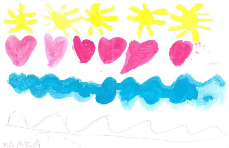
Obrázek č. 5 – Ukázka kresby s abstraktním motivem