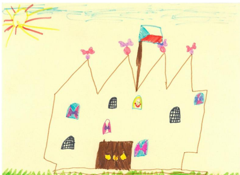
Obrázek č. 2. – Ukázka kresby se stavebním motivem

Tabulka č. 9 vyjadřuje výskyt, četnost a procentuální zastoupení jednotlivých motivů kresby v kategorii stavební témata. Vyplývá z ní, že děti na kresbách v rámci této kategorie nejčastěji vyobrazovaly rodinné domy, což bylo konkrétně ve čtyřech případech. V případě domu v tabulce také rozlišují, jaké prvky se spolu s ním na obrázku vyskytují. Ve dvou případech děti kreslily zámek a pouze v jednom případě to bylo panelákové sídliště a silnice.