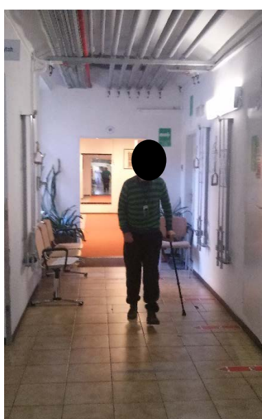
Emory test chůze – chůze po schodech a po tvrdé podlaze