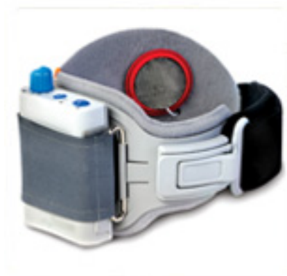
Manžeta s umístěnou látkovou elektrodou

Set určený terapeutovi obsahuje kromě samotného stimulátoru také patní spínač, kabely a jednotku WalkLink® (1). Dodatečně k němu může být dokoupen stimulátor periferních nervů (2).