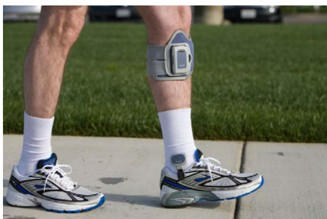
Umístění NESS L300 na bérce pacienta