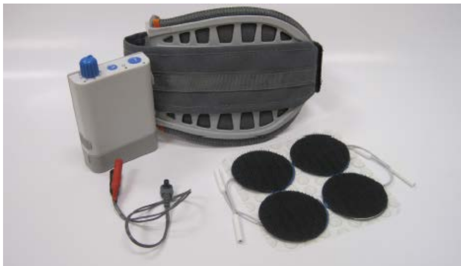
Pacientský set WalkAide® obsahující manžetu, stimulátor a elektrody (na obrázku hydrogelové)

Přejato z obrazové dokumentace manuálu pro terapeutu systému WalkAide® (viz. Použitá literatura) a z webových stránek společnosti Innovative Neurotronics www.walkaide.com .