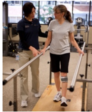
Umístění elektrod na bérci a pozice stimulátoru při chůzi