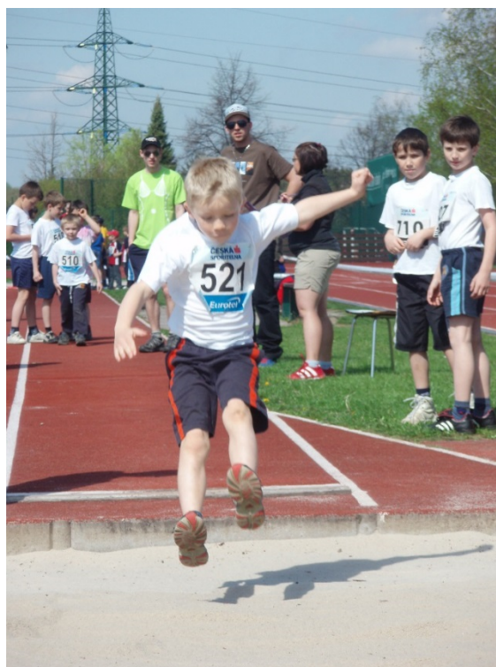
Fotografie č. 23, Závody všestrannosti, atletika žáci, 16. 4. 2011