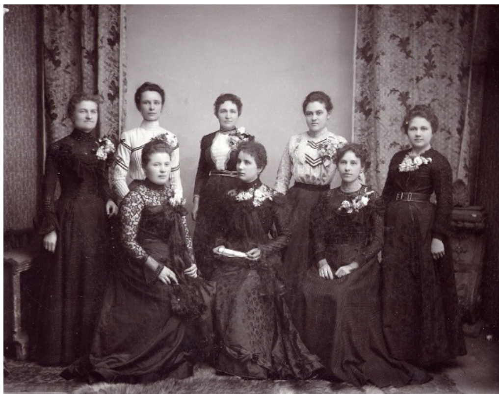
Fotografie č. 7, Ženský odbor založený v r. 1898