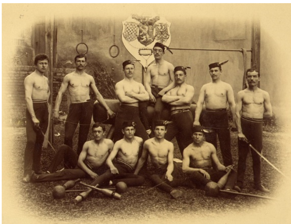
Fotografie č. 6, Cvičitel'ský sbor mužů 1894 – 1895