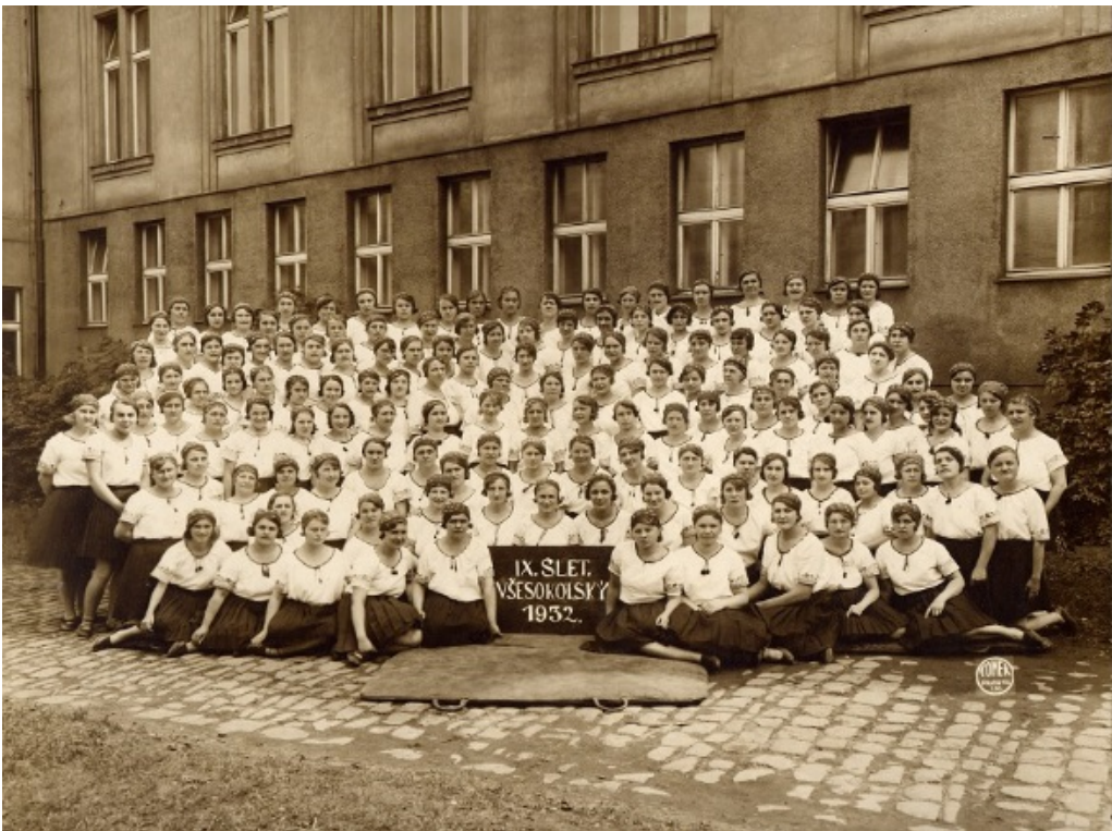
Fotografie č. 9, Ženy na IX. všesokolském sletu v r. 1932