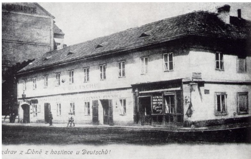
Fotografie č. 11, Hostinec u Deutschů, kde byl r. 1884 založen Sokol Libeň