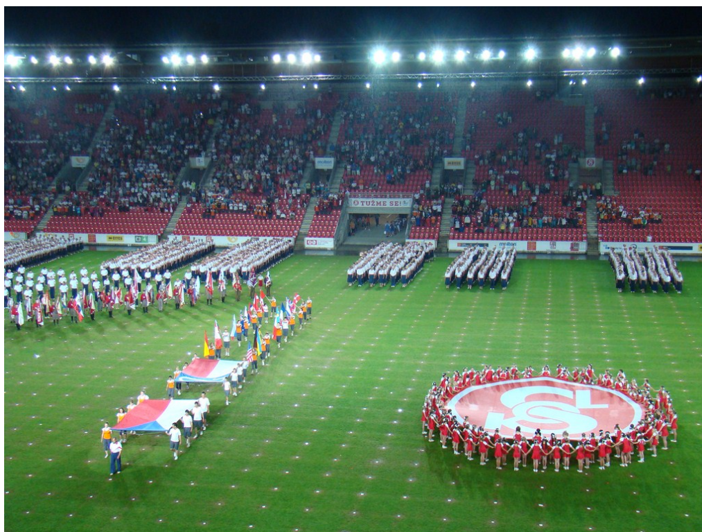
Fotografie č. 17, XV. všesokolský slet 1. 7. 2012