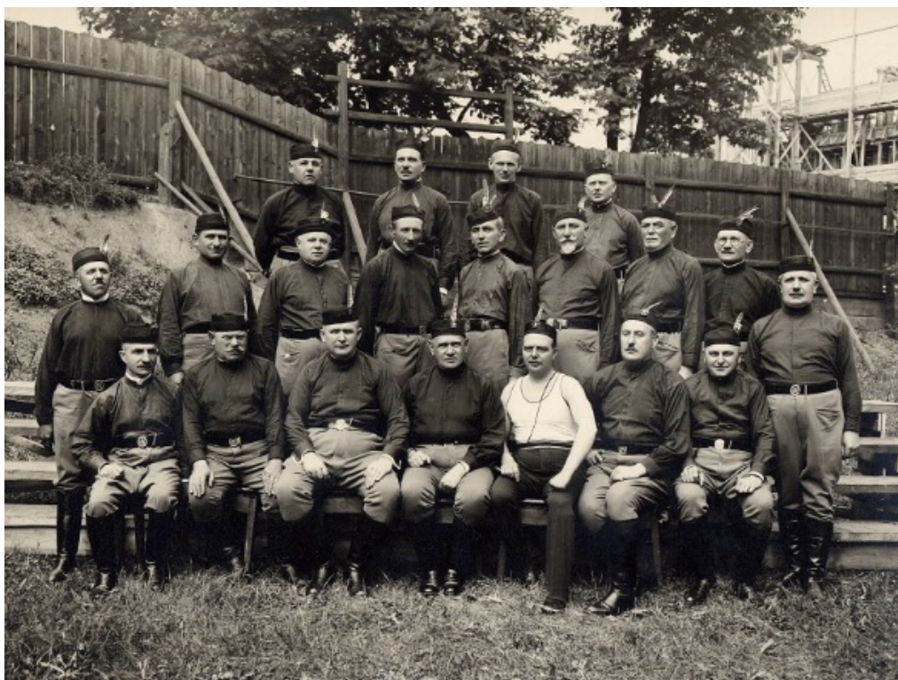
Fotografie č. 10, Věrná garda 1932