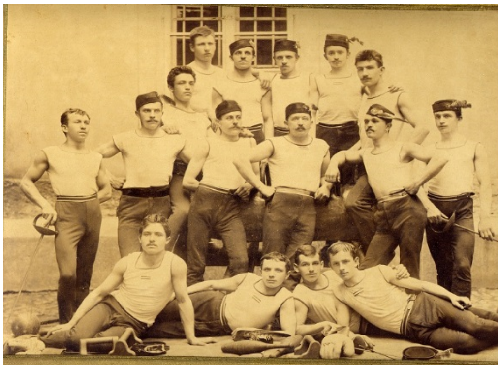
Fotografie č. 5, Družstvo sokolských cvičitelů 1891 – 1896