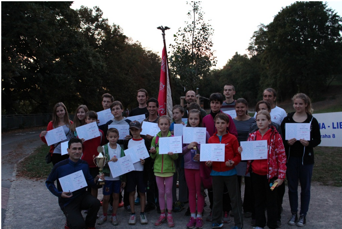
Fotografie č. 20, Běh strmý 15. ročník – vítězové, 23. 9. 2015