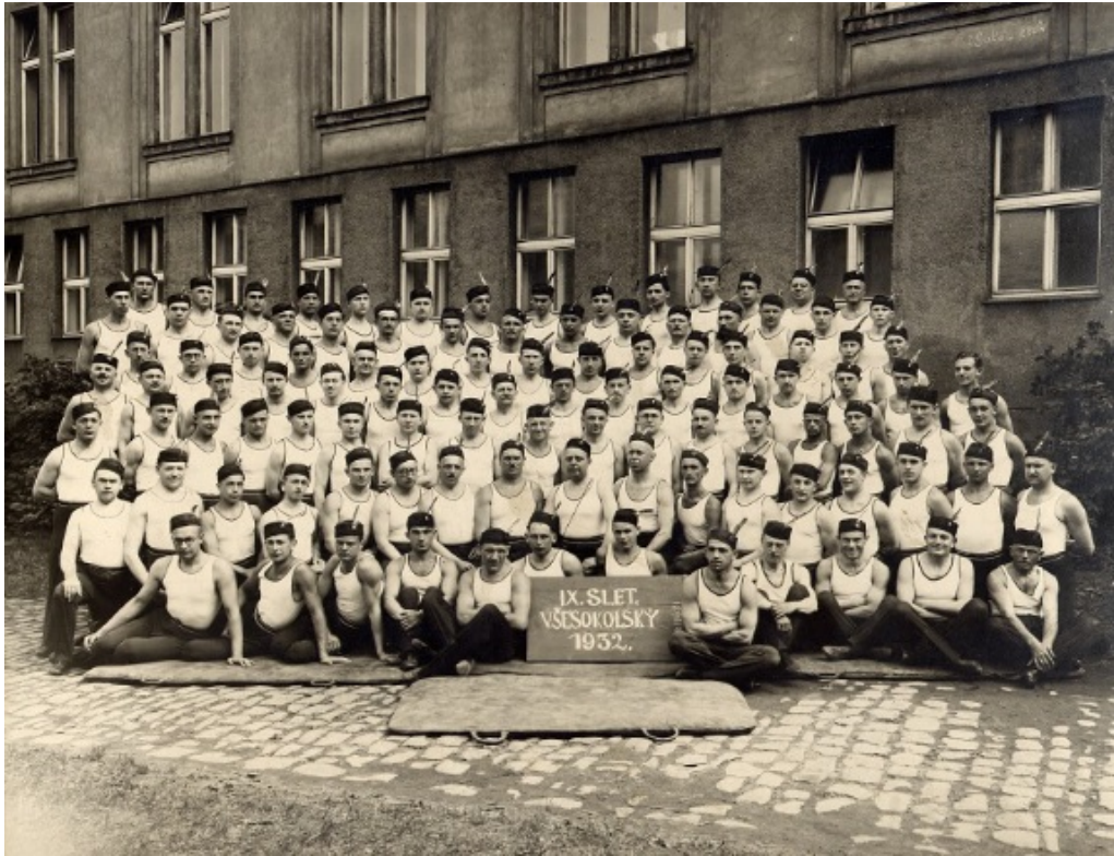
Fotografie č. 8, Muži na IX. všesokolském sletu v r. 1932