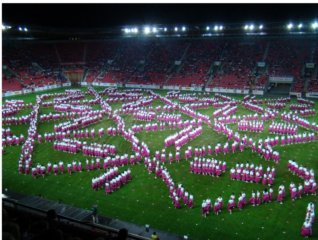
Fotografie č. 18, XV. všesokolský slet 1. 7. 2012