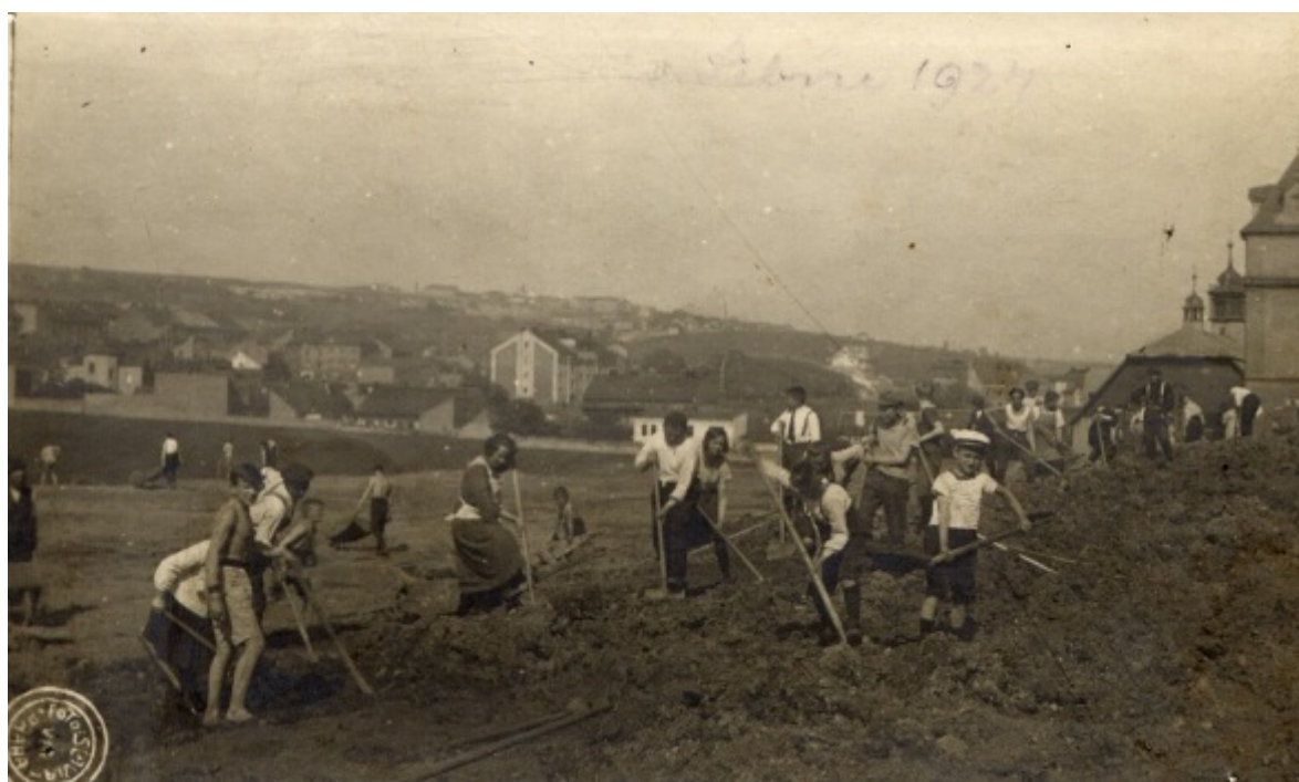
Fotografie č. 15, Budování letního cvičiště libeňskými sokoly