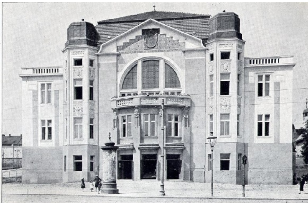
Fotografie č. 12, Sokolovna po dokončení v r. 1910