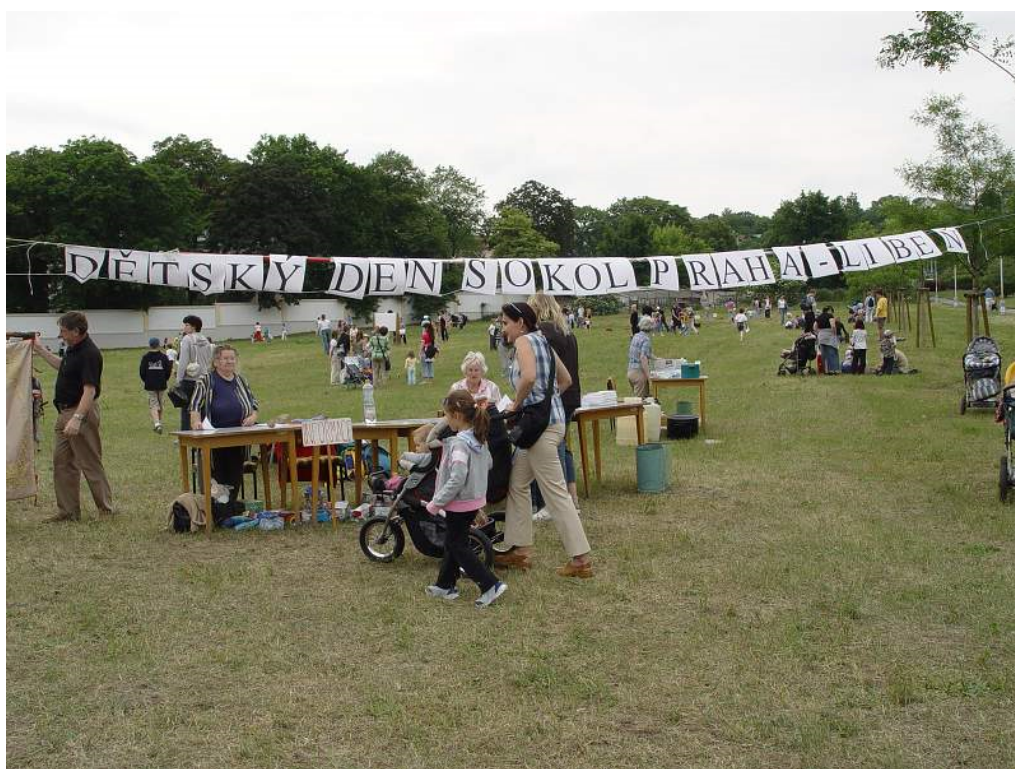
Fotografie č. 19, Dětský den 2. 6. 2005