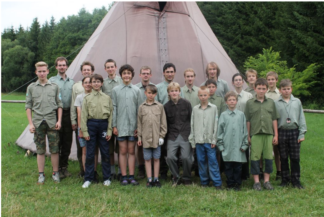
Fotografie č. 21, Letní tábor JILMu 9. 7. 2014