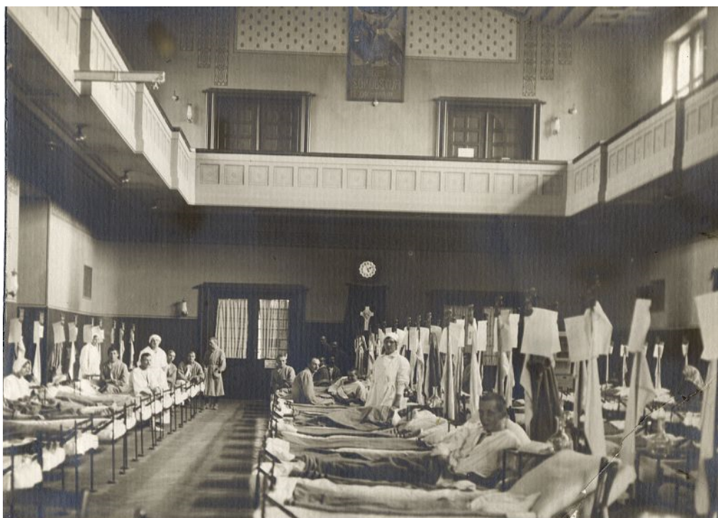
Fotografie č. 13, Velký sál libeňské sokolovny jako lazaret během 1. světové války