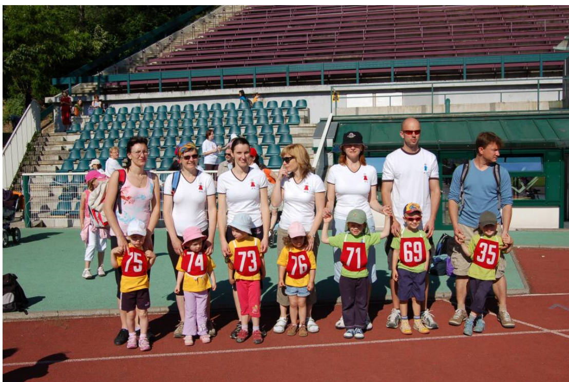
Fotografie č. 22, Atletika rodiče s dětmi – Juliska, 6. 6. 2010