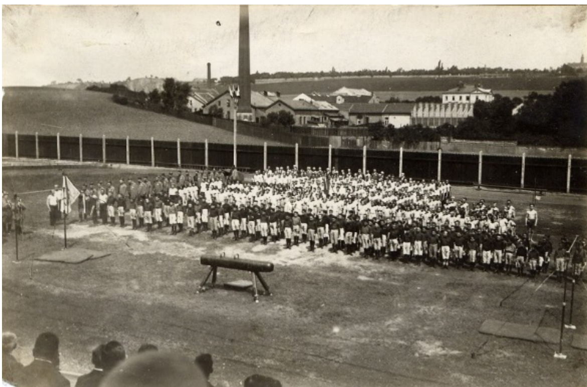
Fotografie č. 16, Otevření letního cvičiště v r. 1924