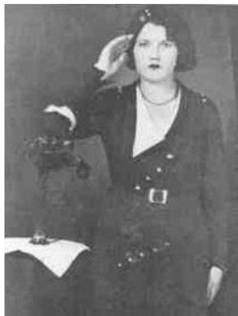
(Šulc, 2013, Příloha)