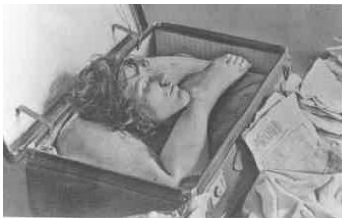
Kufr s ostatky těla nalezený v Bratislavě