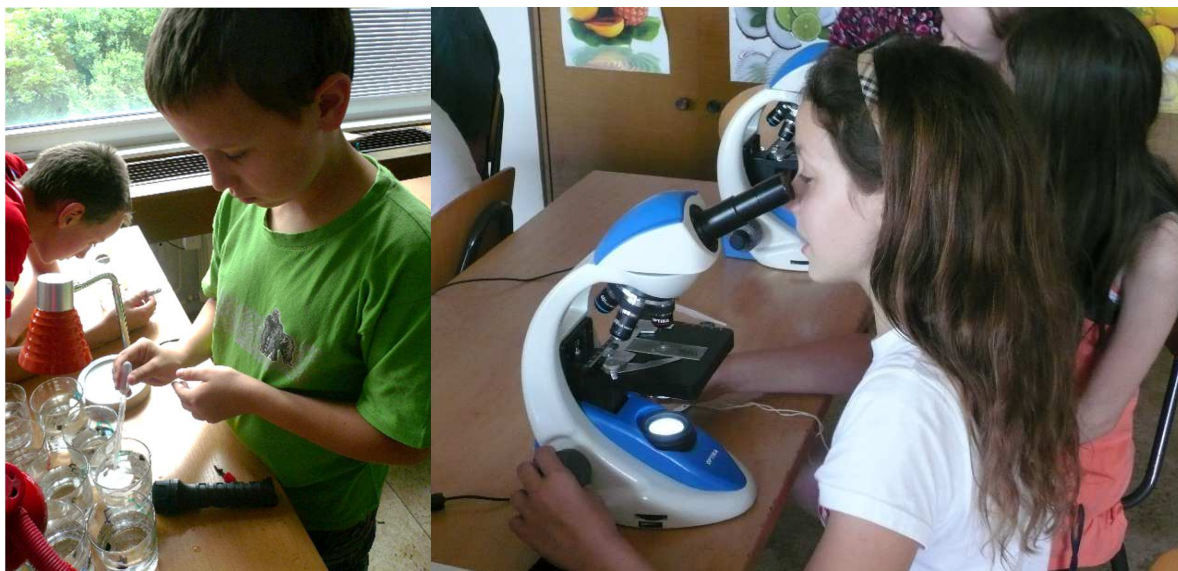
Žáci primy při odběru a pozorování cercárií