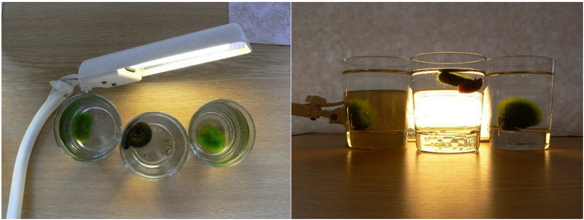
Extrakce 20. 5. 2015, nasvícení sklenic s plži