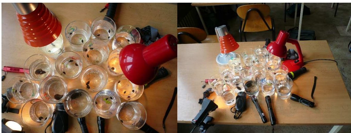
Improvizovaný světelný extraktor