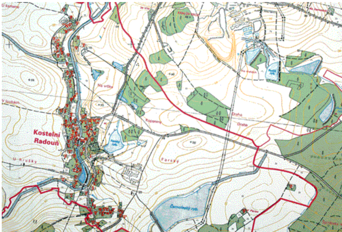
1, Mapa obce Kostelní Radouň