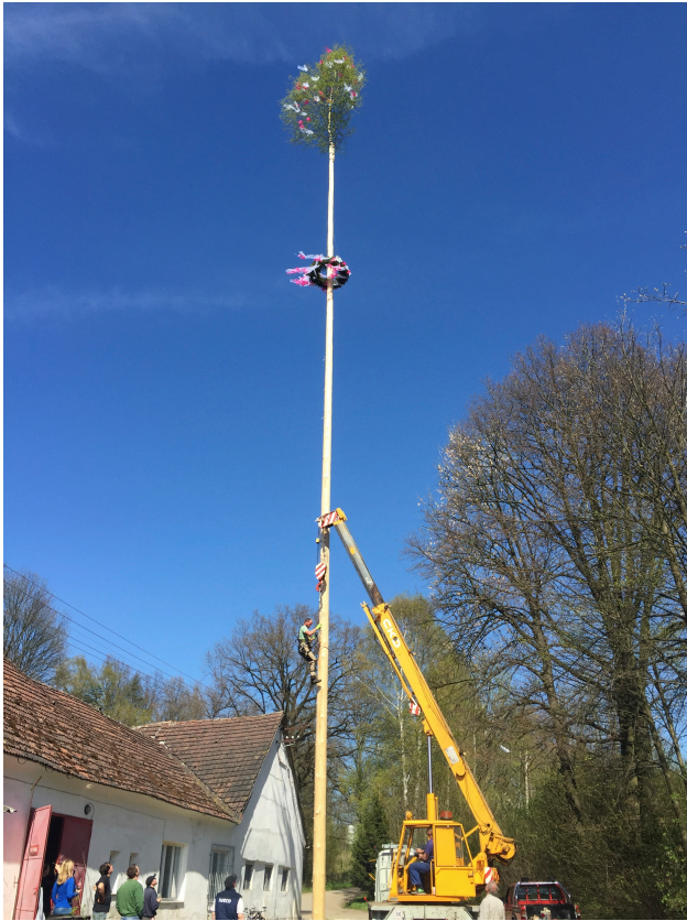
Fotografie č. 3