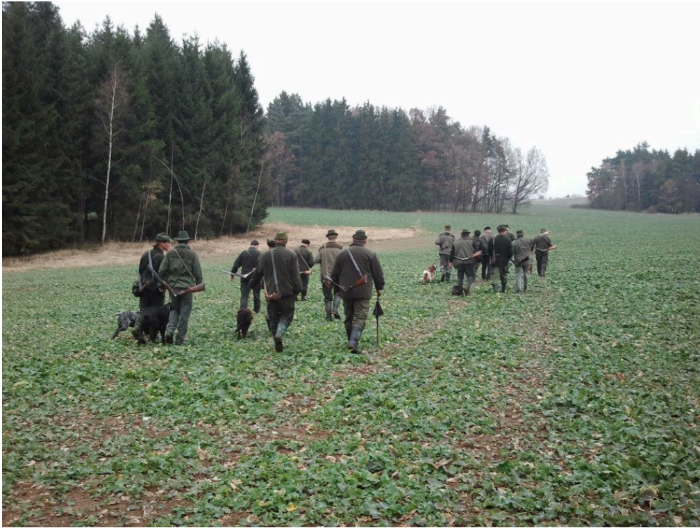
Fotografie č. 11