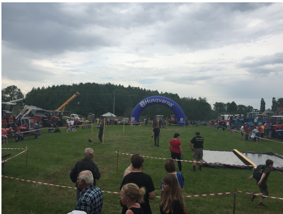
Fotografie č. 10