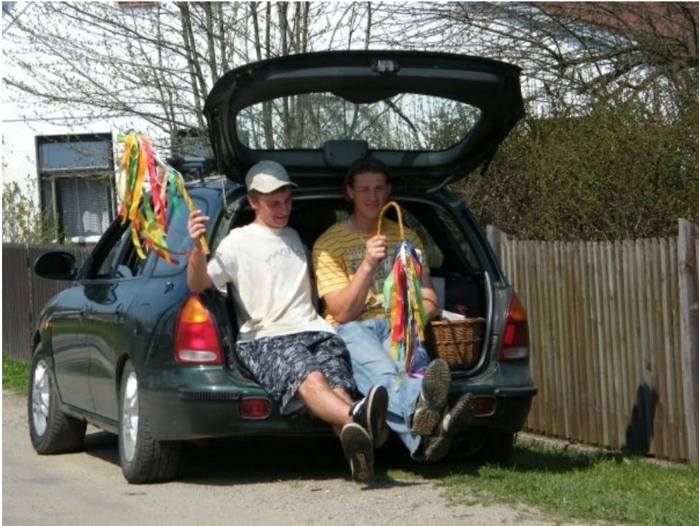
Fotografie č. 5