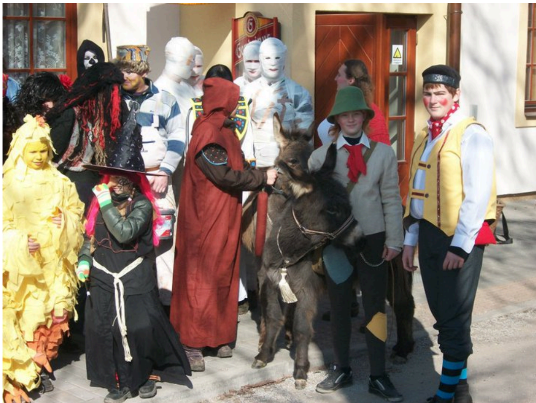
Fotografie č. 2