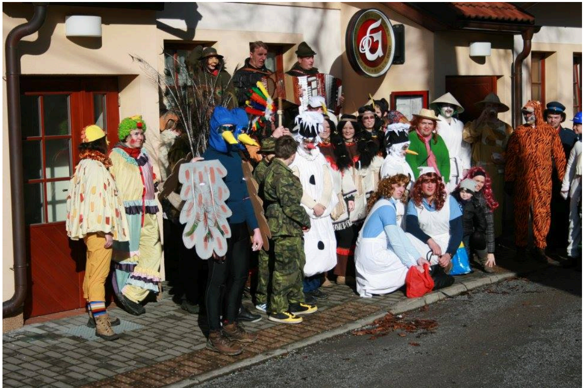
Fotografie č. 1