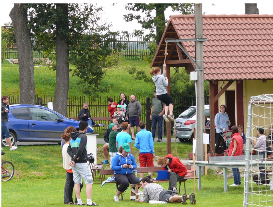
Fotografie č. 8