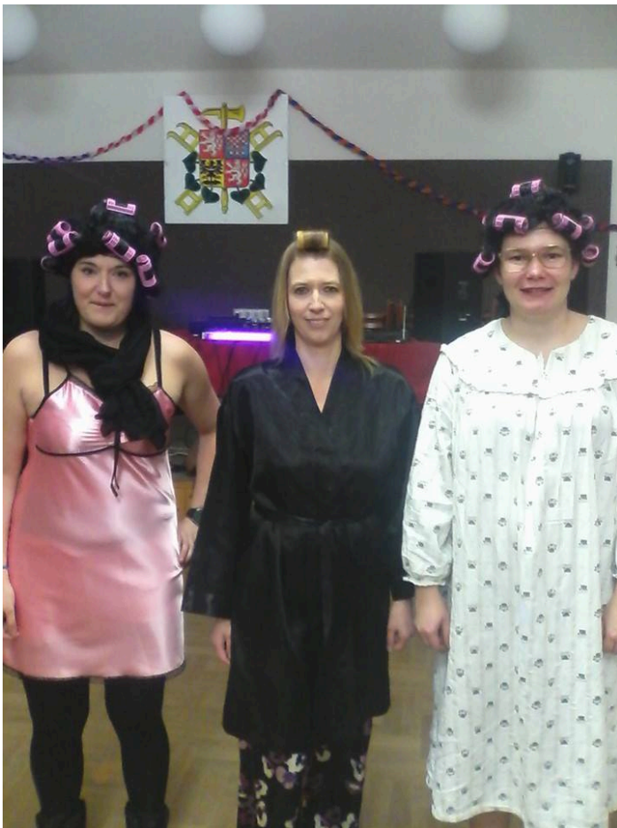
Fotografie č. 6