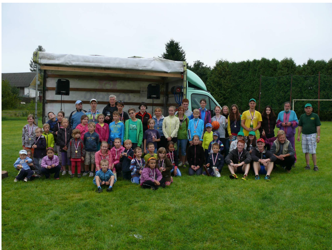
Fotografie č. 7