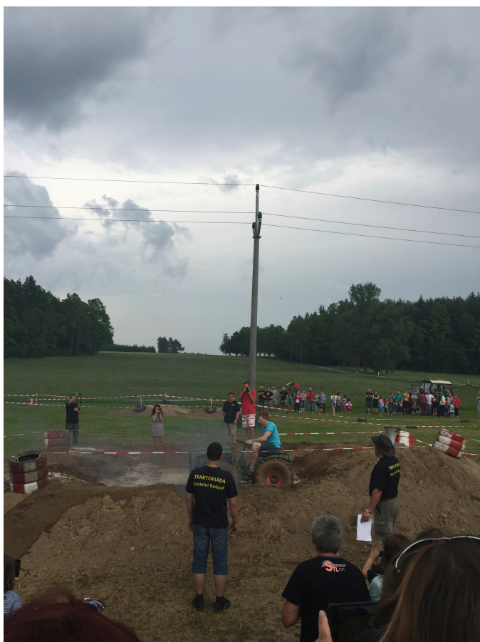
Fotografie č. 9