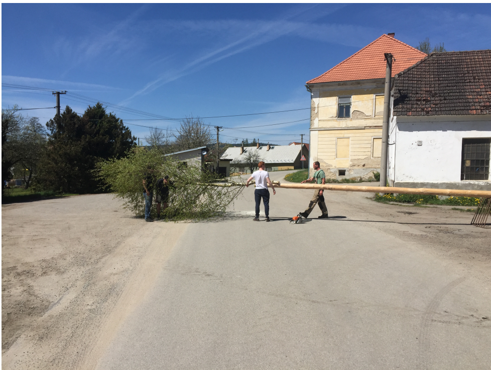
Fotografie č. 4