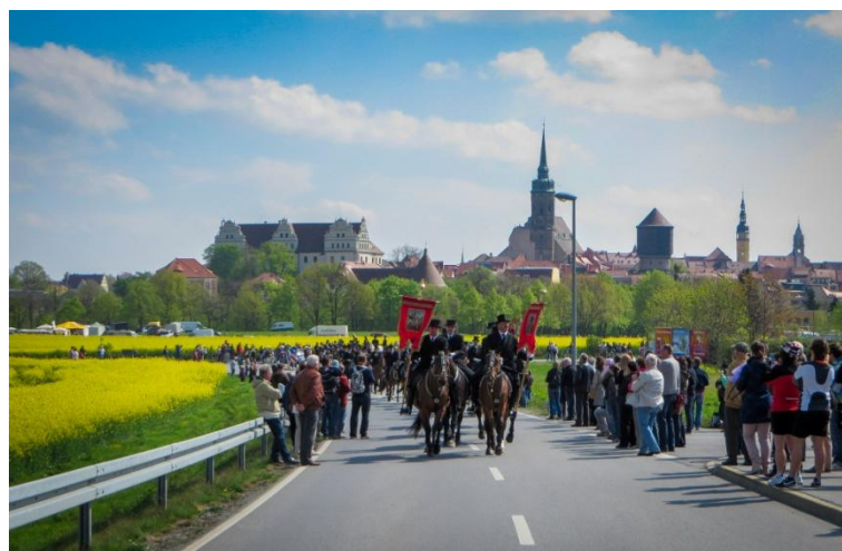
Bild 6 Osterreiter in Bautzen

Quelle: SORBISCHER KULTURTOURISMUS. SERBSKI KULTURNY TURIZM. Sorbisches Siedlungsgebiet in der Lausitz [online]. Verfügbar unter URL: < http://www.tourismus-sorben.com/de/startseite.html > [zit. 2014-05-29]