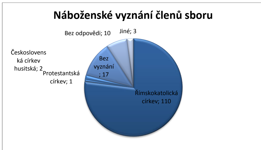
Graf 2: Náboženské vyznání členů sboru

orientačně poskytuje pouze sbormistr. V žádném sboru není sbormistrem stanovena horní ani spodní věková hranice, kdy zpěvák není přijat nebo by musel opustit sbor.