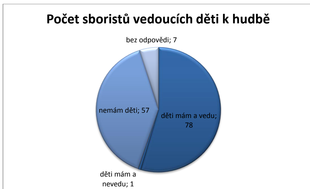
Graf 4: Počet sboristů vedoucích své děti k hudbě

Z celkové počtu vyplněných dotazníků se sešlo nejvíce odpovědí, ve kterých sboristé nemají žádné preference v rámci vystoupení sboru, všechny typy produkcí pokládají za přínosné. Na dalším místě upřednostňují doprovázení liturgie s nejčastěji uváděnými důvody, že zejména k těmto účelům byla hudební díla napsána, při produkcích na kůru není sbor příliš ovlivňován trémou a publikem a nabízí se duchovní prožitky. Třetí v pořadí se umístili koncerty; tato forma vystoupení více vyhovuje zpěvákům bez náboženského zaměření, kteří mají rádi kontakt s posluchači. Mezi ostatními specifickými akcemi sboru byly nejčastěji zmiňovány benefiční koncerty a Noc kostelů. Pouze čtyři sboristé z celkového počtu neposkytli odpověď. Rozdíl v provedení jedné skladby členové sboru více či méně vnímají; je to dáno účely, pro které bylo dílo napsáno, prostorem, ve kterém se skladba zpívá a atmosférou vycházející nejen z dané skladby, ale i z prostředí, ve kterém sbor právě účinkuje. Sbormistr duchovní díla členům sboru vždy prezentuje, jak nejlépe dovede, podává vlastní vnímání díla a vysvětluje, jakými způsoby jednotlivá místa skladby zazpívat. Tato prezentace probíhá prostřednictvím slov i názorné ukázky předzpíváním. K dosažení požadovaného přednesu velkou měrou ovšem napomáhají i sami sboristé svým přístupem a pílí.