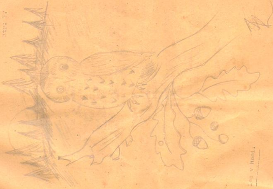
Leč v hooi.