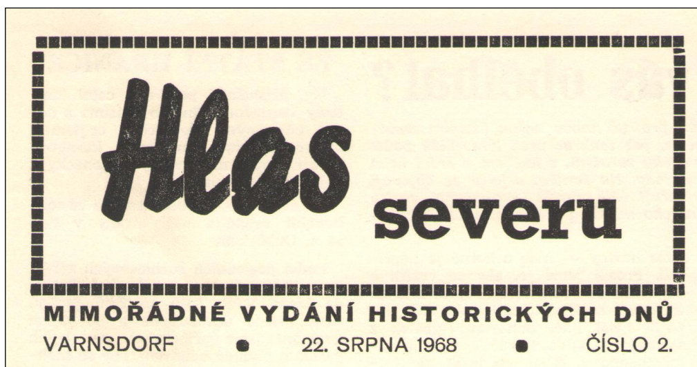
Ukázka části titulní strany Hlasu severu