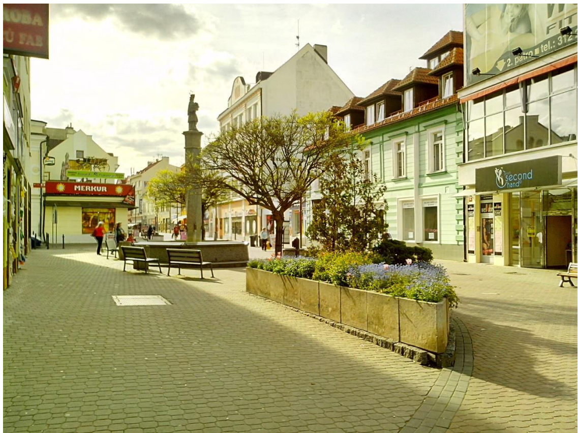
C – První odpočinkový bod u kašny se sochou svatého Jana Nepomuckého (v pozadí Secondhand a herna)