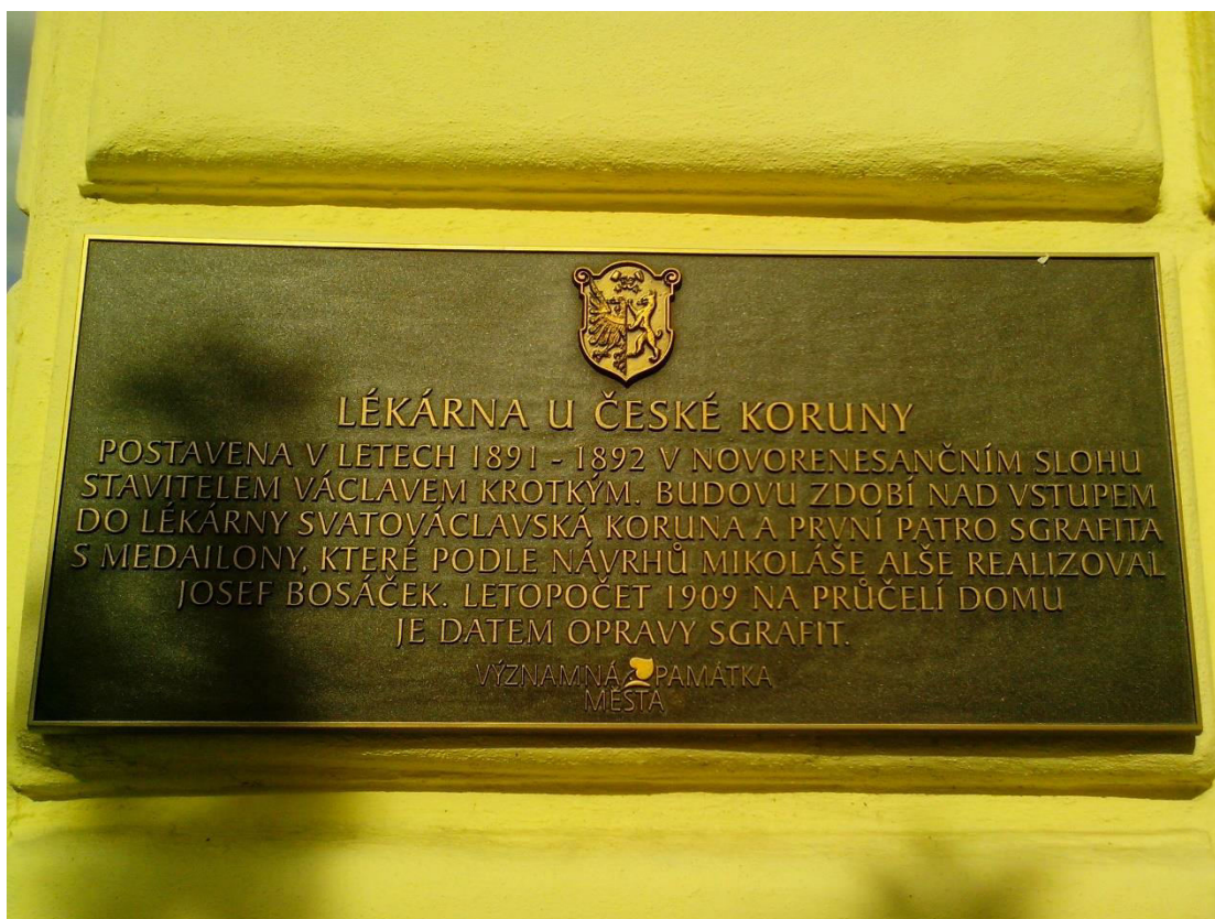
G – Pamětní deska na budově bývalé lékárny