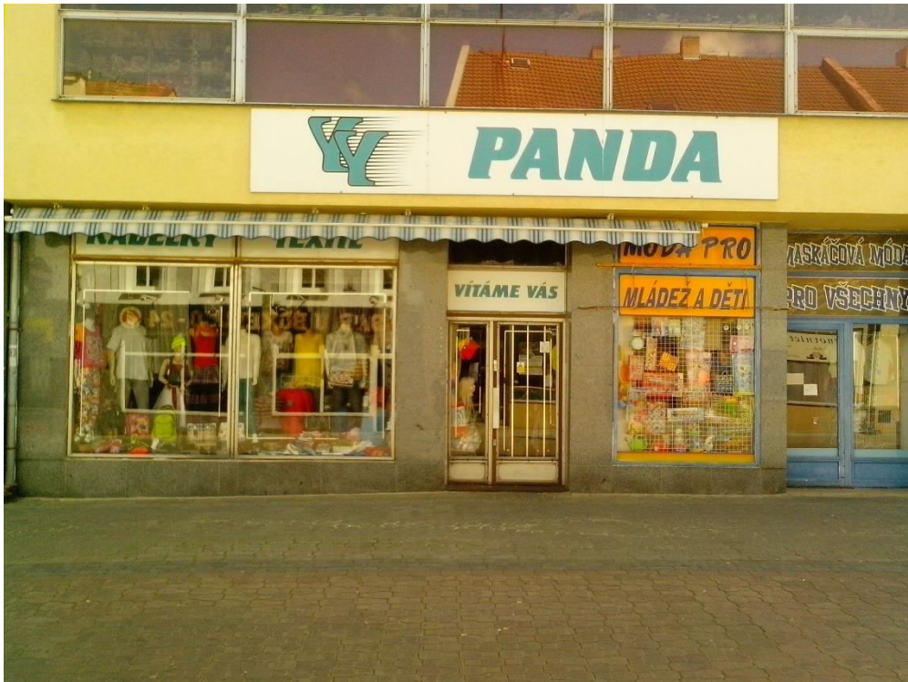
F – Obchod s textilem vietnamského majitele (ve všední den mívá zboží vystavené přímo na ulici)