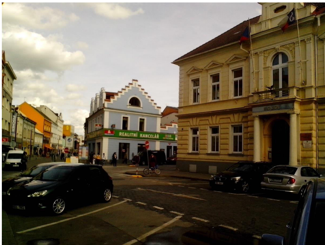
A - Vstup na pěší zónu (po pravé straně kladenská sokolovna)