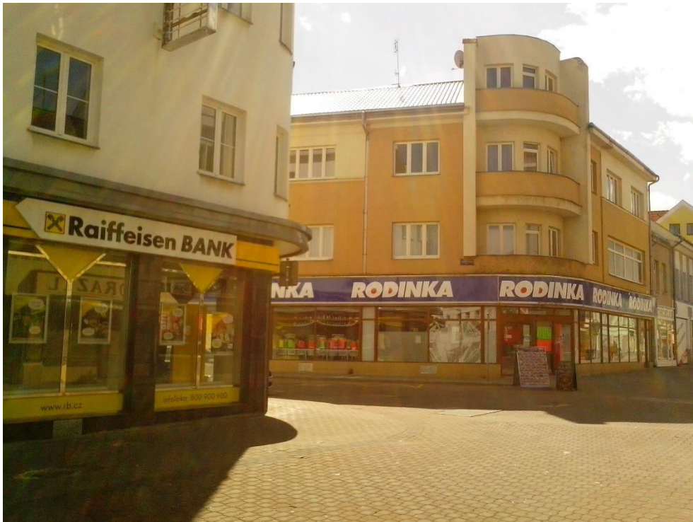
D – Pobočka banky a obchod s levným zbožím