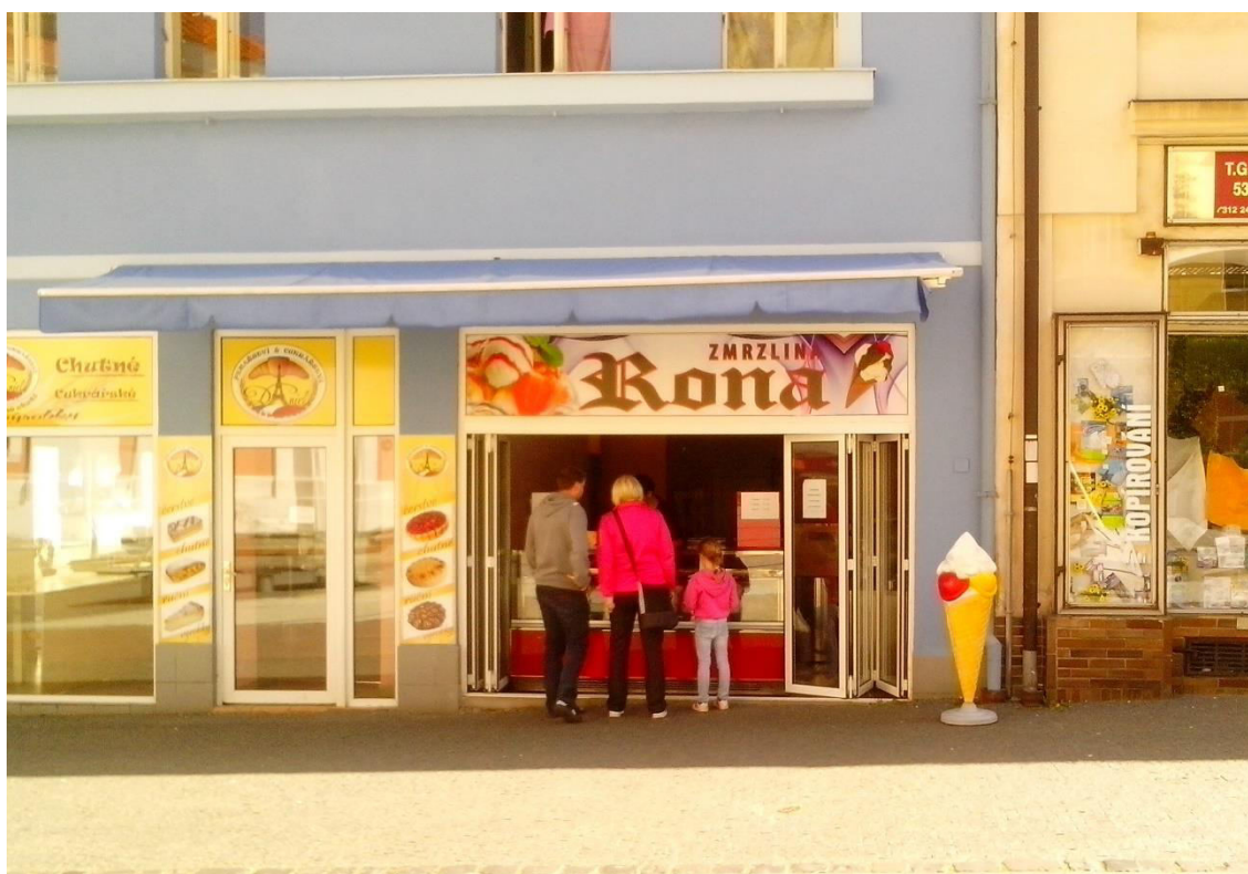
H – Prodej zmrzliny na Floriánském náměstí (bývalá budova Pizza Verdi) –, dne 10. 5. 2015