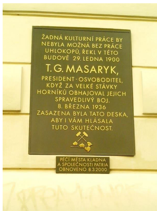
B – Pamětní deska v ulici O. Peška