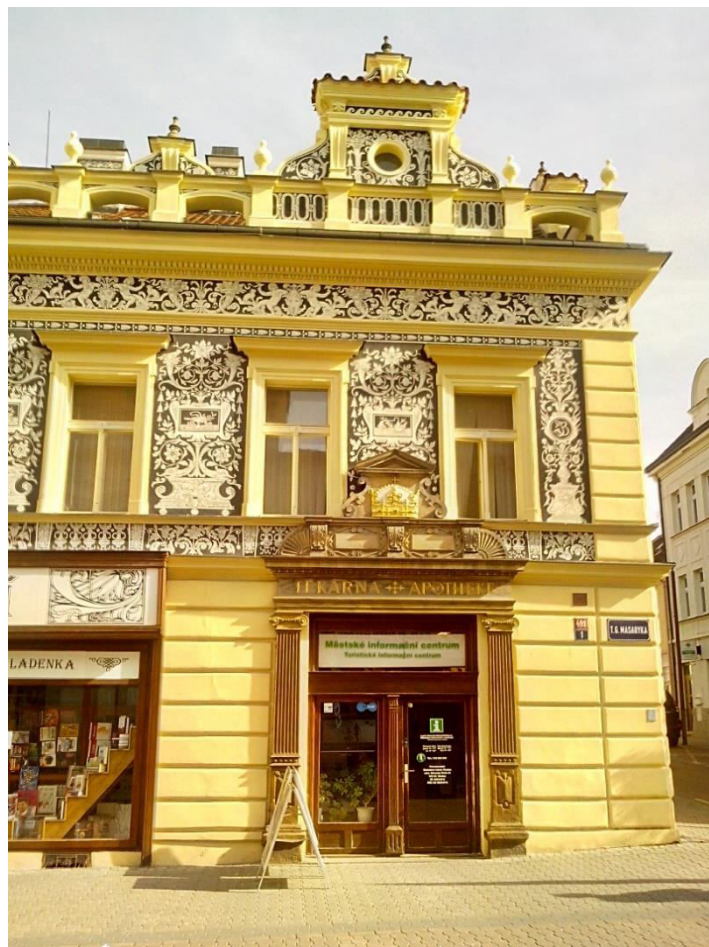
G – Budova bývalé lékárny U České koruny