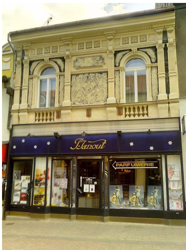
J – Janoutova parfumerie