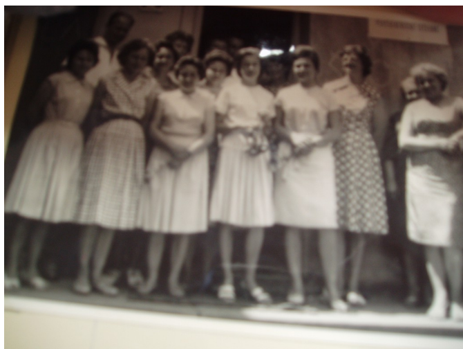
Obr. 1: Zaměstnanci léčebny