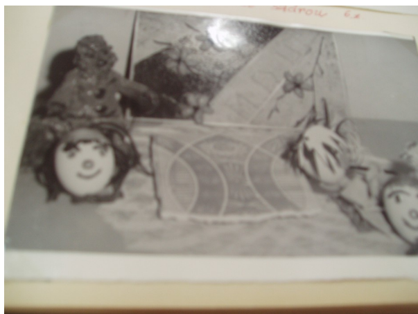
Obr. 2: Ruční výrobky klientů dětské léčebny