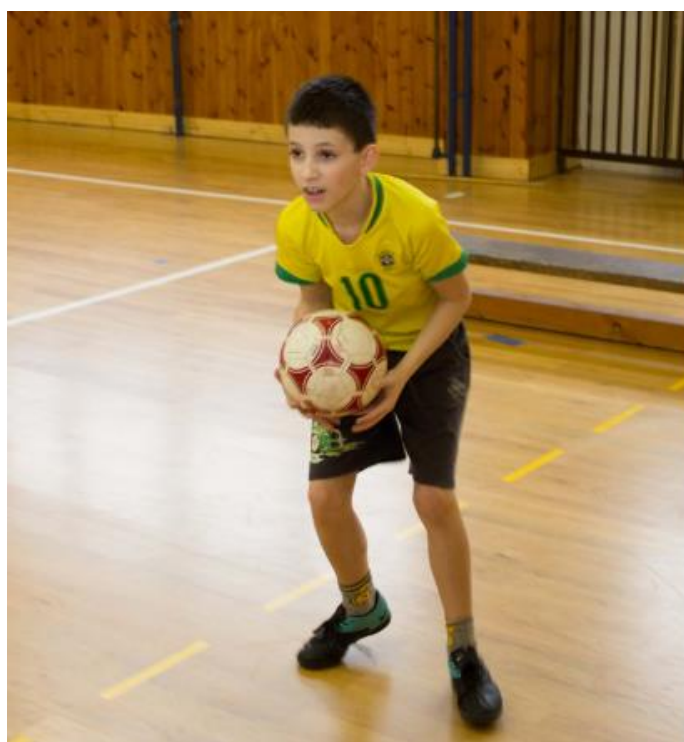
Příloha 6 – pohybové dovednosti obrazně – kopy