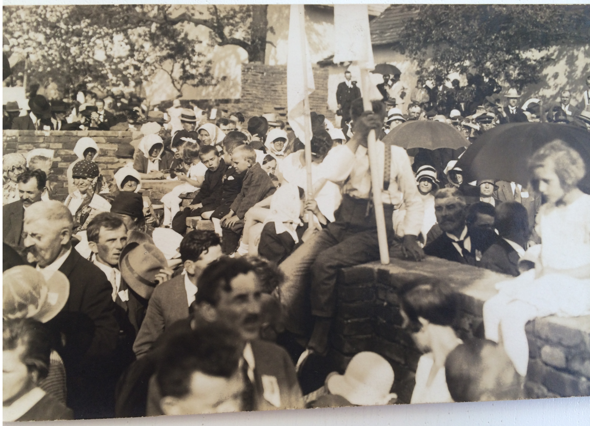
Příloha č. 5. Slavnostní otevření Betlémské kaple, r. 1931