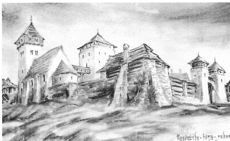
M | Rekonstrukce Nesvačilské tvrze.