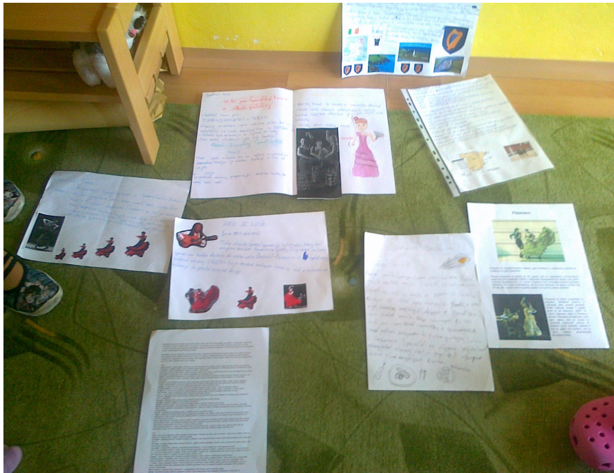
Informační listy – Španělsko a Katalánie