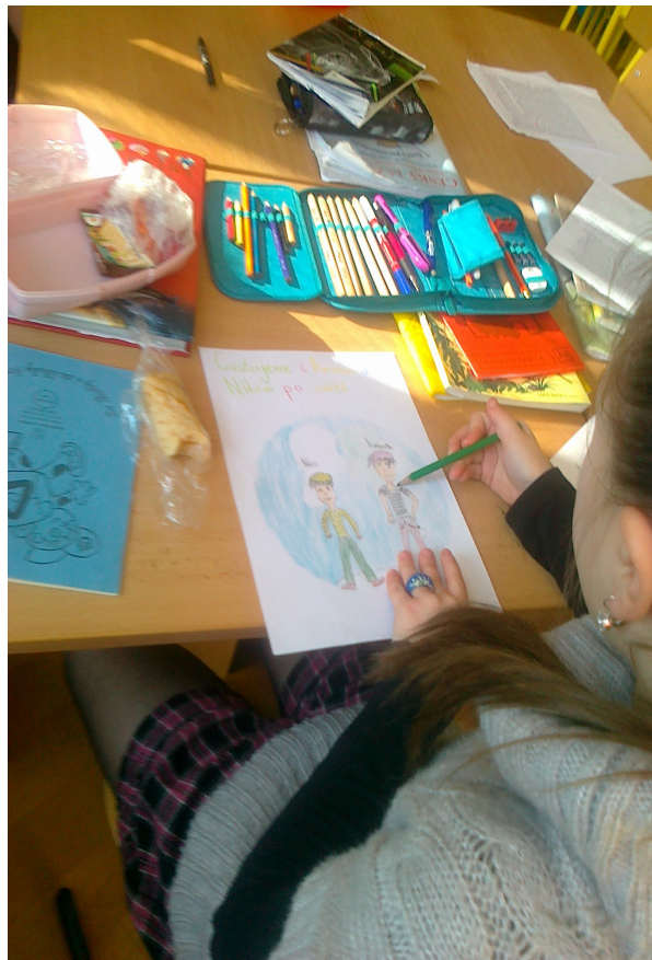
Výroba obálky deníku