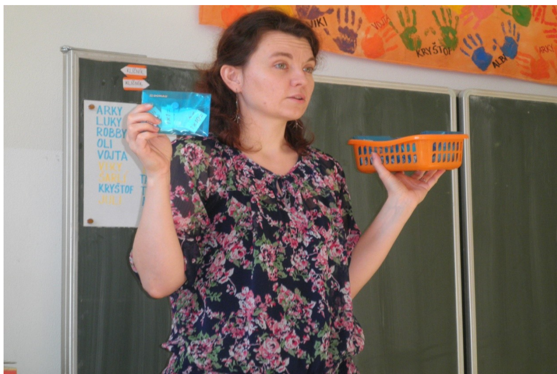
Příloha č. 1: Plánování práce – žáci si volí pomůcky z nabídky učitele.