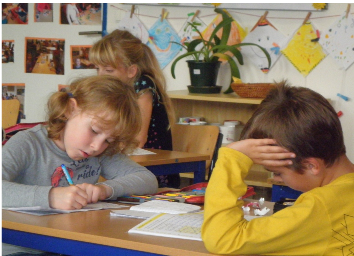
Před dívkou na stolku lze vidět otevřený deník s týdenním plánem.