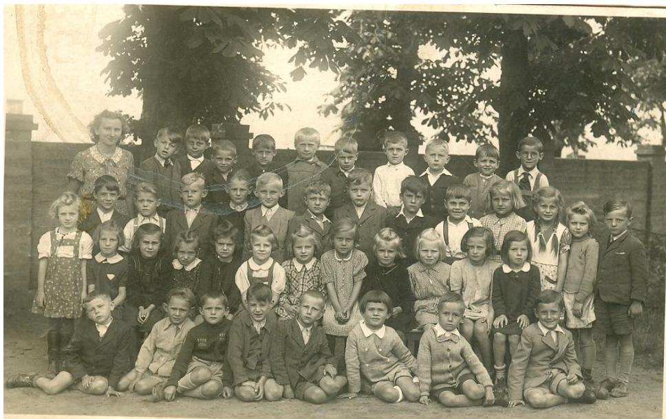
Obrázek 6- Školní rok 1941/42