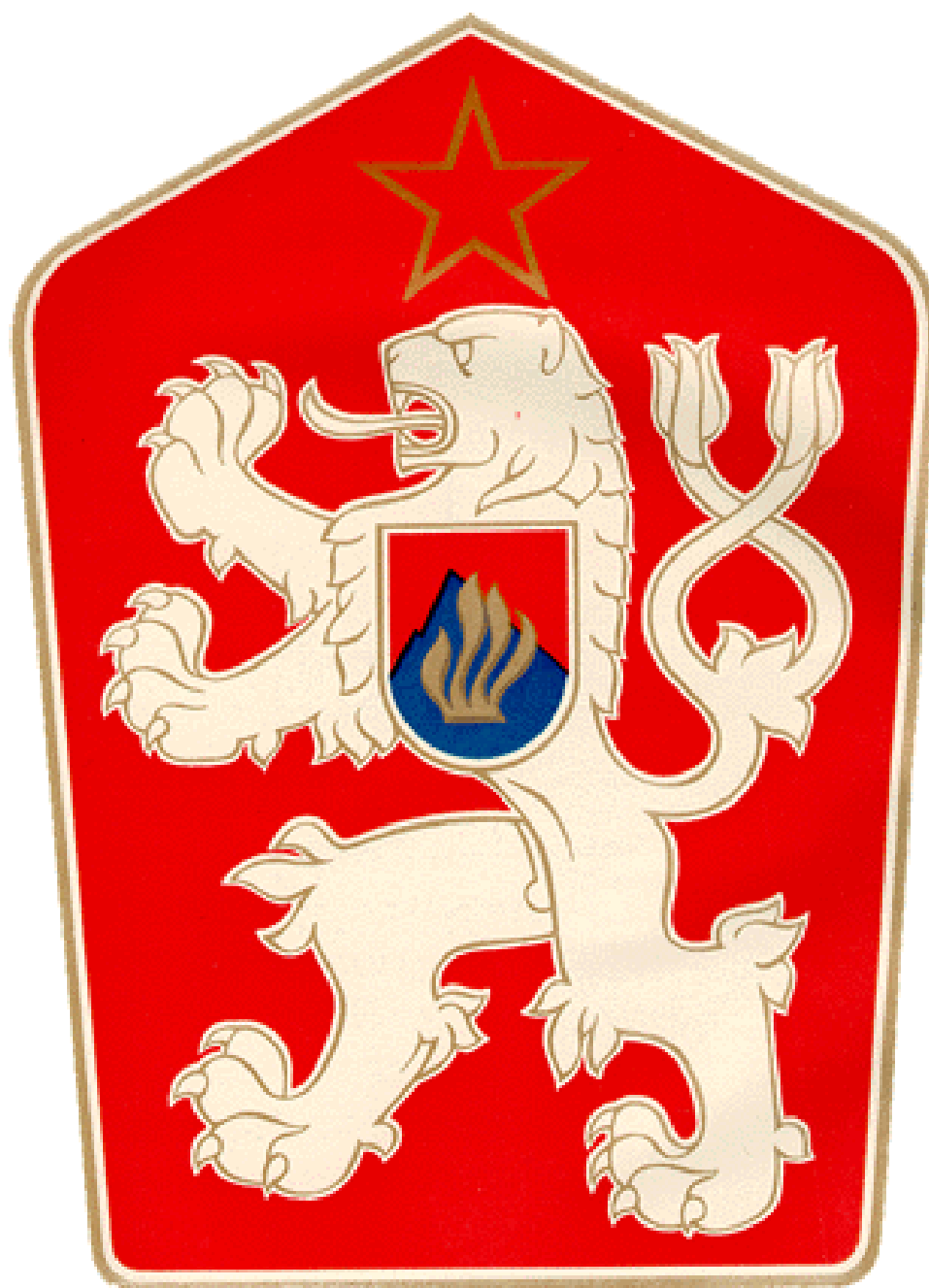
ŠTÁTNY ZNAK ČSSR