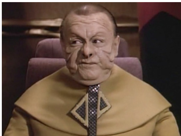
Obr. 3: ST: TNG - 2x21 - Zagdoňané