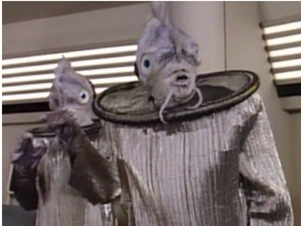
Obr. 7: ST: TNG - 2x19 - Antediané