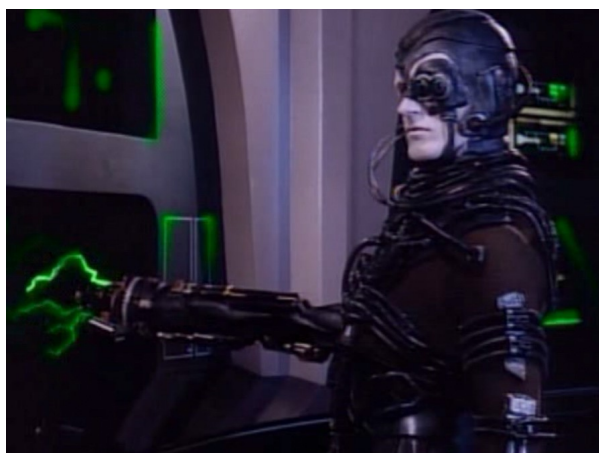
Obr. 13: ST: TNG - 2x16 - Borgové