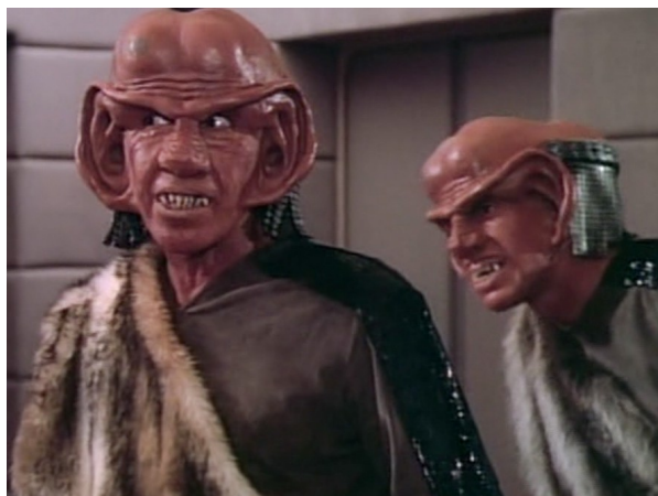
Obr. 4: ST: TNG - 1x09 - Ferengové