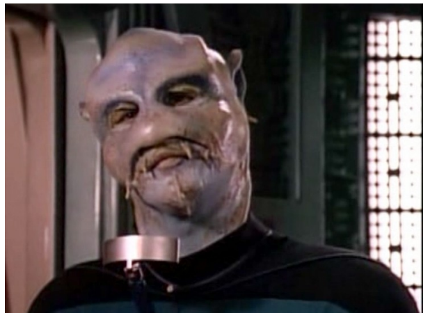
Obr. 10: ST: TNG - 2x08 - Benzaité