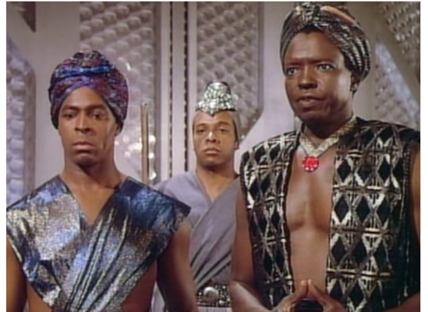
Obr. 20: ST: TNG - 1x04 - Lioni