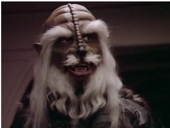
Obr. 9: ST: TNG - 1x07 - Anticané