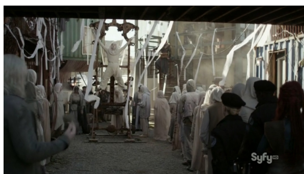
Obr. 18: Defiance - 2x06 - Kastitanský očištný rituál