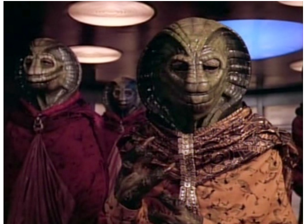
Obr. 8: ST: TNG - 1x07 - Selayové