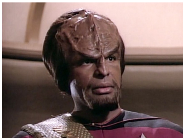
Obr. 2: ST: TNG - 1x25 - Klingoni