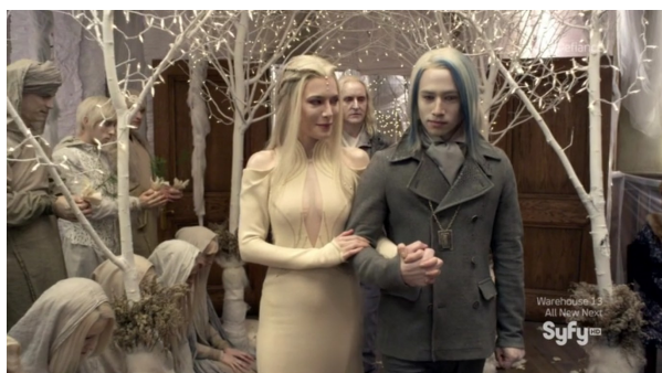
Obr. 5: Defiance - 1x10 - Kastitané