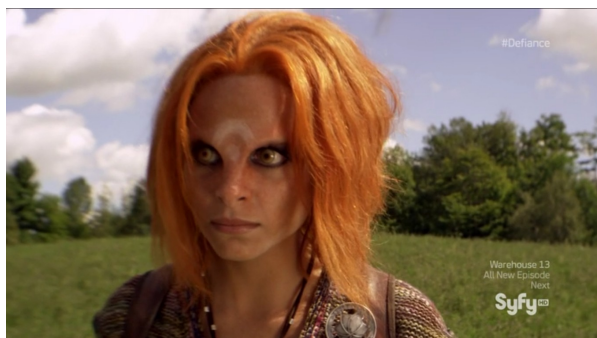
Obr. 6: Defiance - 1x03 - Irathiené