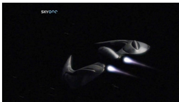
Obr. 16: BSG: 1x12 - cylonská stíhačka