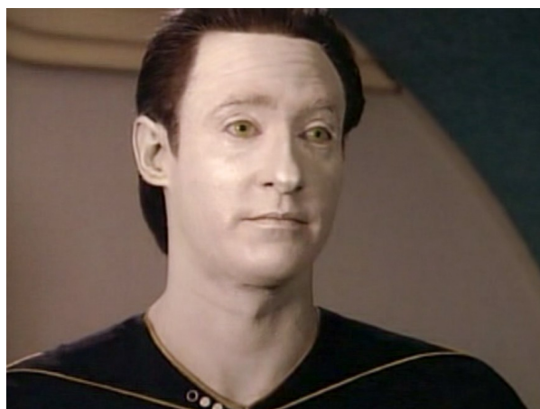
Obr. 14: ST: TNG - 2x09 - android Dat