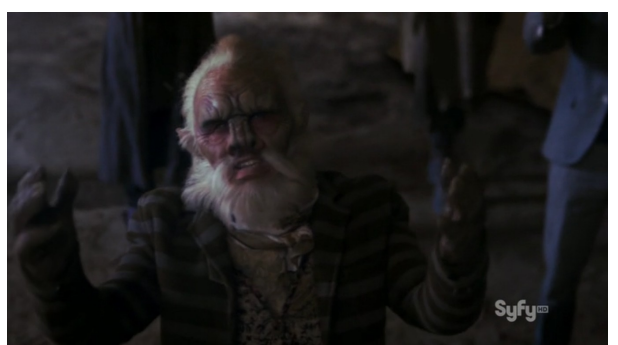
Obr. 12: Defiance - 2x10 - Liberat'ané