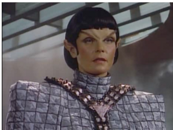
Obr. 1: ST: TNG - 2x11 - Romulané