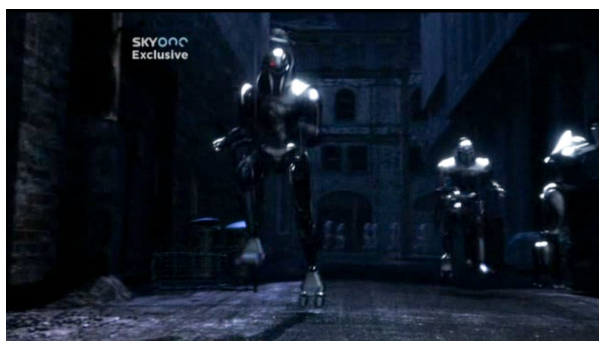
Obr. 15: BSG - 1x09 - cylonští roboti