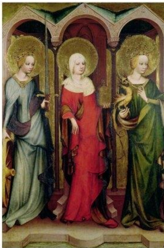
Obr. 2: Mistr třebošského oltáře po roce 1380. Svatá Kateřina, Máří Magdaléna a Markéta.