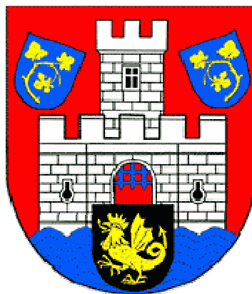
Obr. 1: Erb města Benátky nad Jizerou