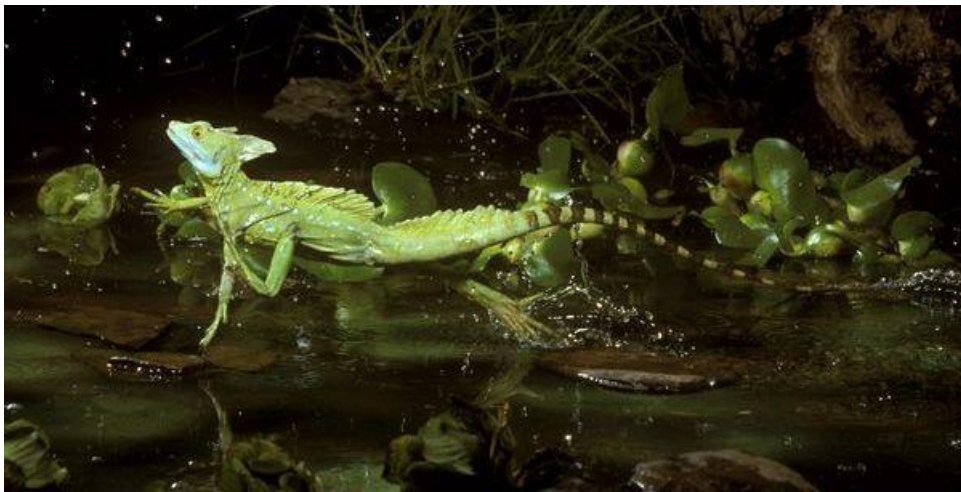
Obr. 4: Bazili-ek zelený