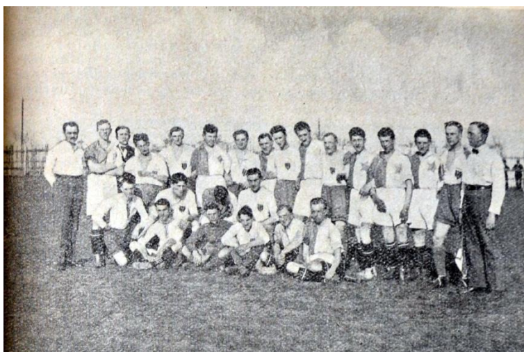
fotografie ze zápasu mezi Polabanem a Pogoň Lvov (16.4.1922)