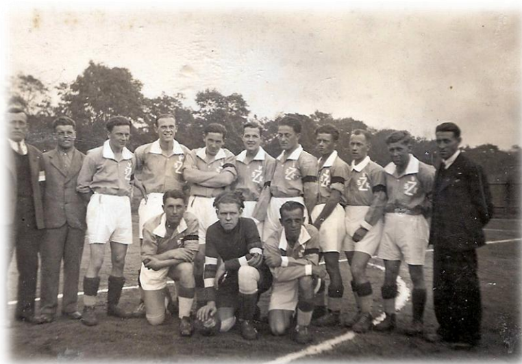
SK Železničáři (datace neznámá)