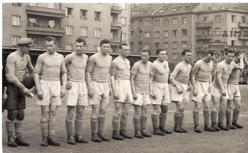
Polaban Nymburk (datace neznámá)