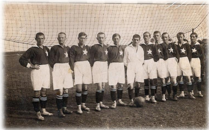
Čechie Nymburk po vítězství nad Polabanem 2:1 (1919)