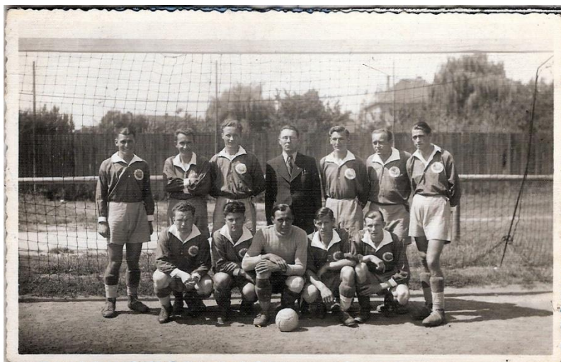
AFK Nymburk (datace neznámá)