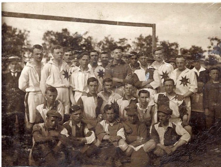
mužstvo Zálabské jedenáctky (datace neznámá)