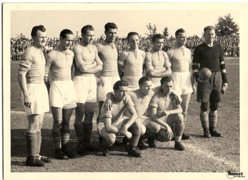
Polaban Nymburk (datace neznámá)