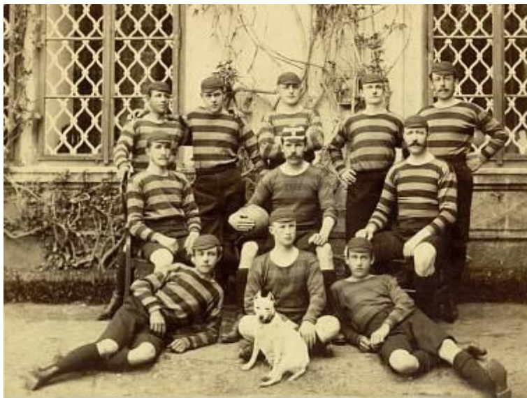
Zámecké kopací mužstvo Loučeňské (počátek 20. století)