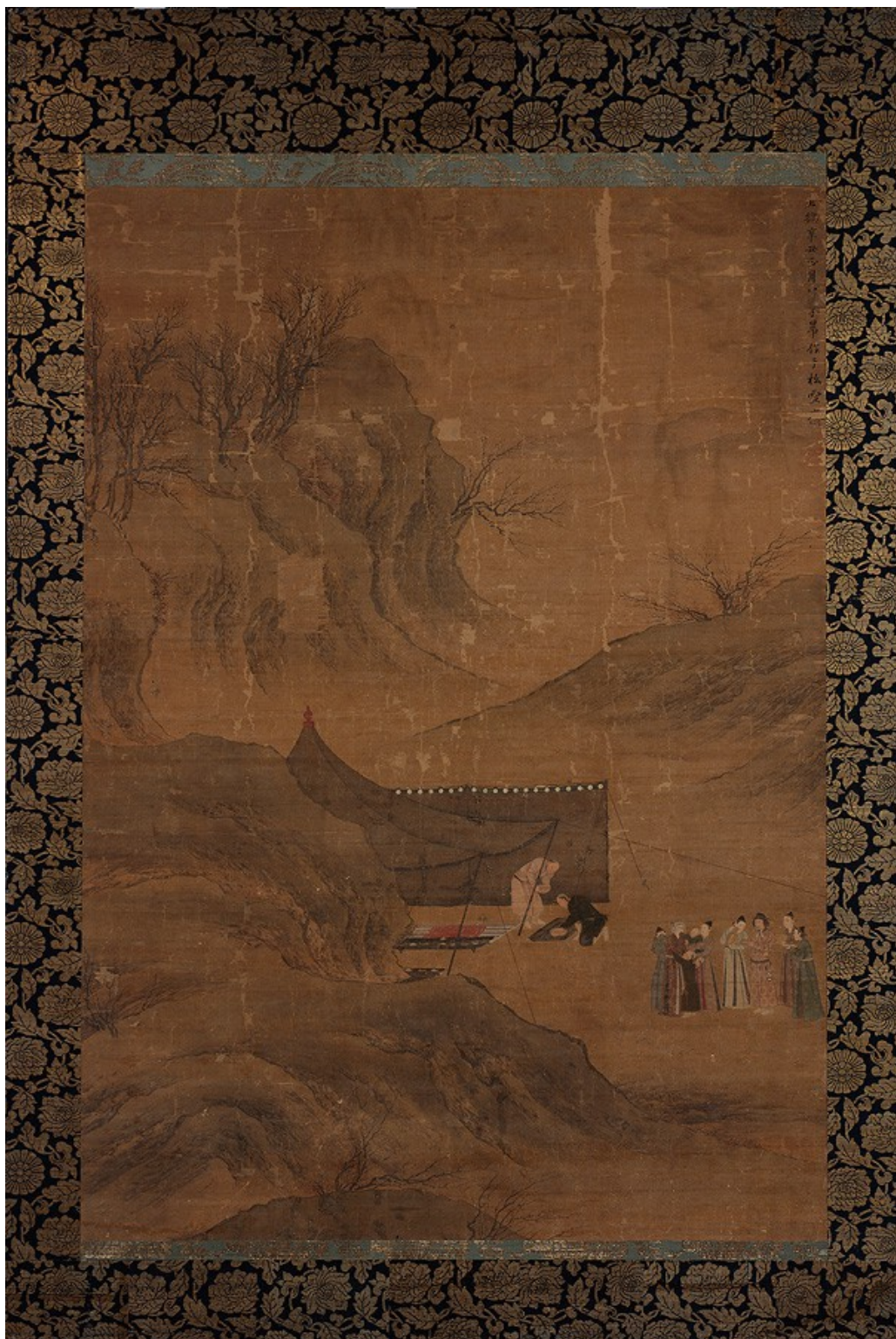
[1] Wenji gui Han 文姬归汉 . Návrat Wenji do Han . 14. století, Smith College Museum of Art, Northampton