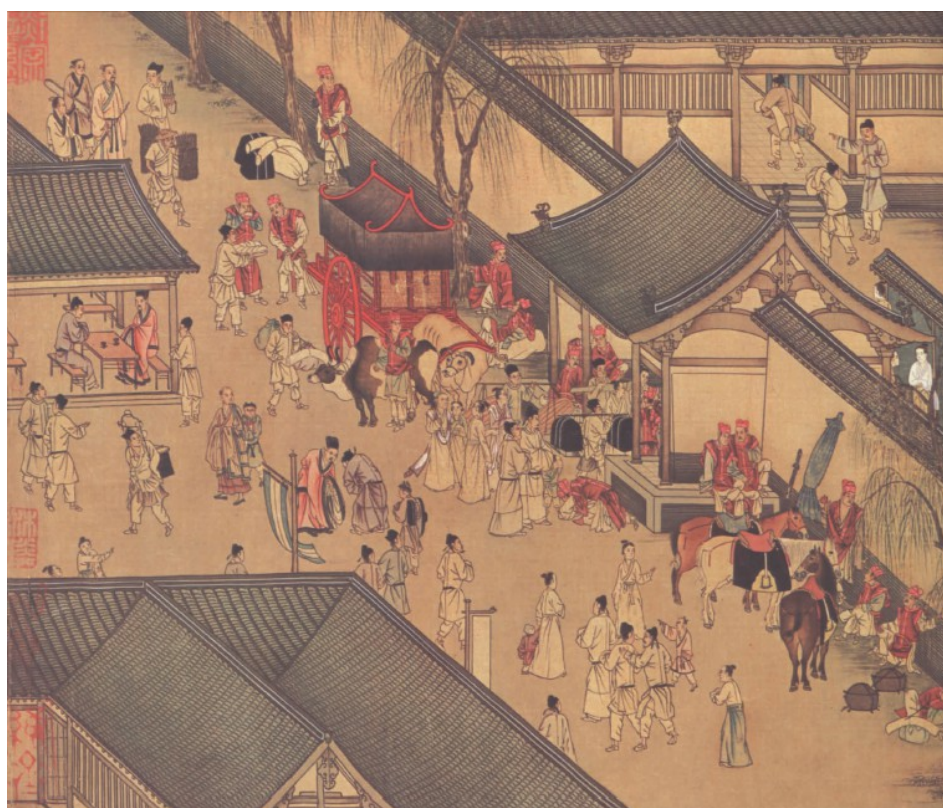
[27] Hujia shiba pai 胡笳十八拍 , srovnání první a osmnácté písně, 14.- 15. století Metropolitní muzeum, New York