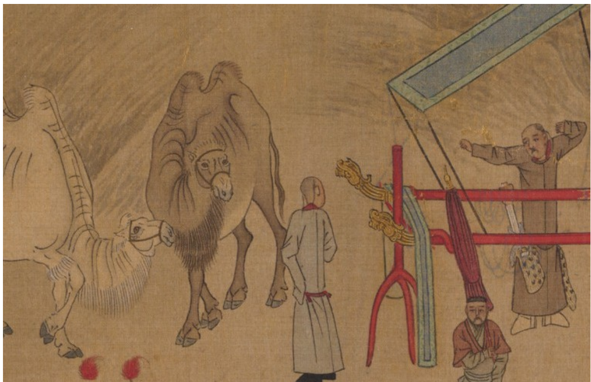
[20] Hujia shiba pai 胡笳十八拍, detail ze třinácté písně, 14.- 15. století Metropolitní muzeum, New York