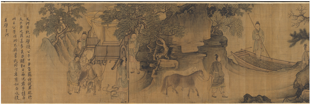
[5] Li Tang 李唐: Jin Wengong fuguo tu 晋文公复国图 .

Vévoda Wen z Jin se vrací do svého státu. 1140