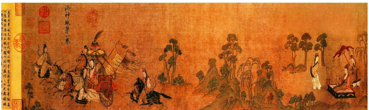
[32] Gu Kaizhi 顾恺之 : Luoshen fu tu 洛神赋图 . Bohyně řeky Luo. Palácové muzeum 故宮博物院 , Peking