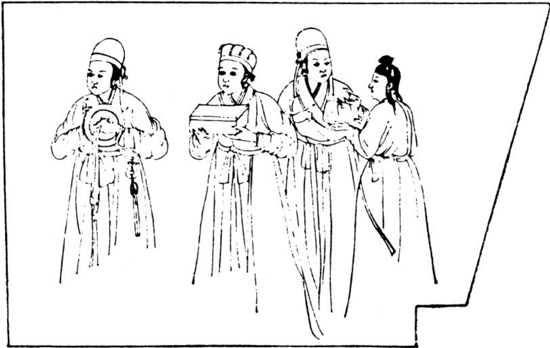
[9] Nástěnná malba žen v kitanské hrobce, Kulun Banner, 1088 provincie Jilin, Vnitřní Mongolsko