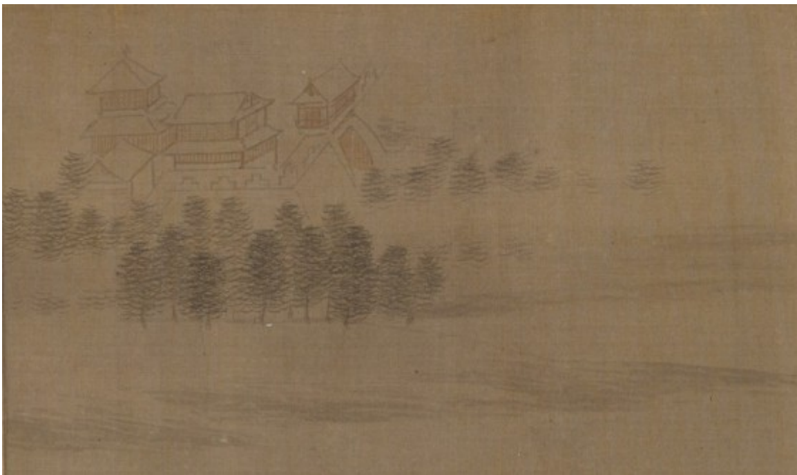
[26] Hujia shiba pai 胡笳十八拍, detail ze sedmnácté písně, 14.- 15. století Metropolitní muzeum, New York