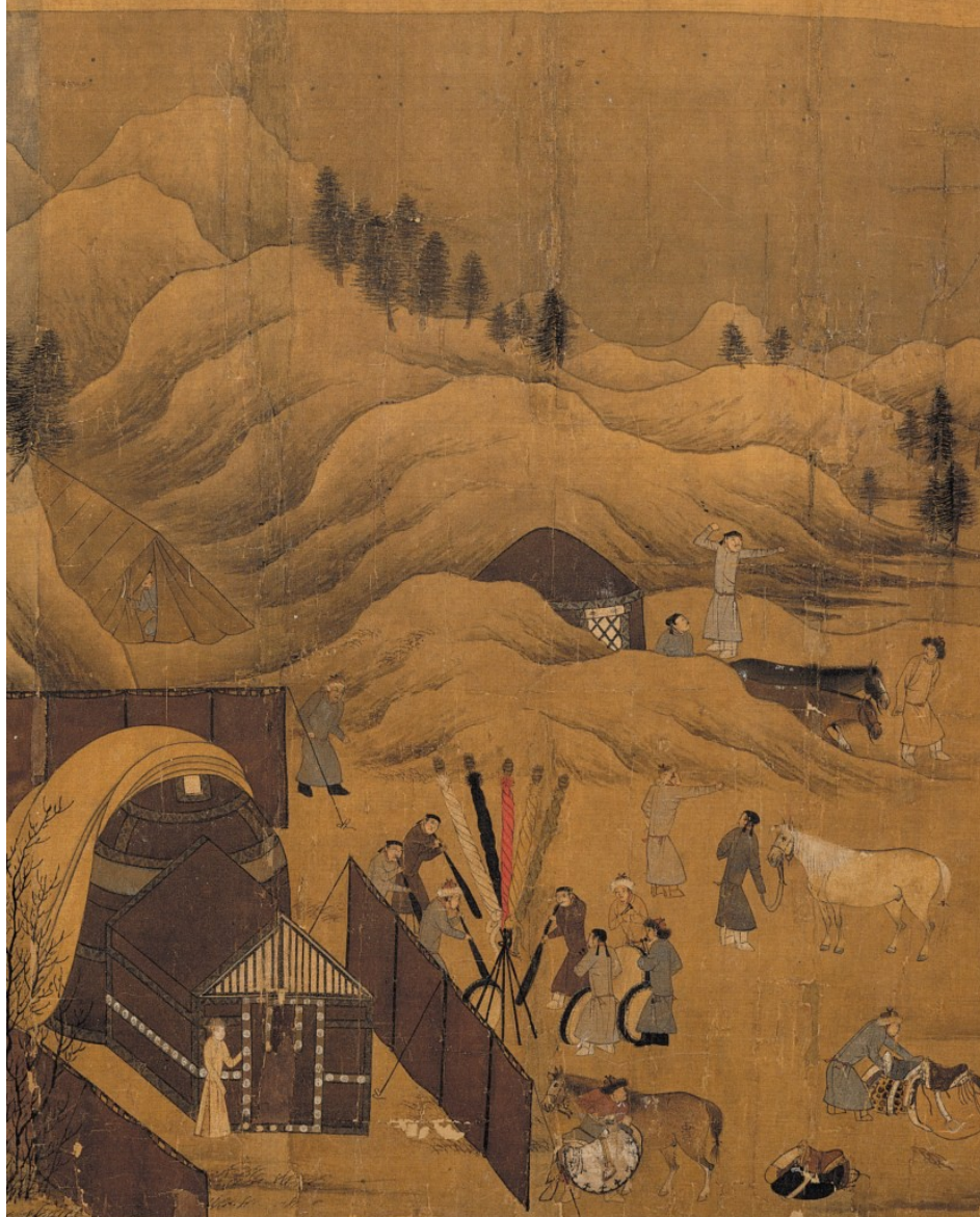
[4] Wenji gui Han 文姬归汉 . Návrat Wenji do Han .

第八拍 憶昔私家恣嬌小 遠取珍禽學馴擾 如今淪棄念故鄉 悔不當初放林表 朔風蕭蕭寒日暮 星河寥落胡天曉 旦夕思歸不得歸 愁心想似籠中鳥