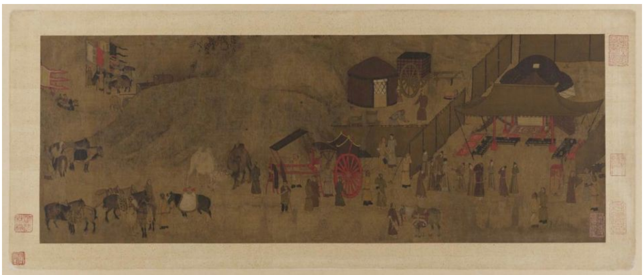
[2] Wenji gui Han 文姬归汉 . Návrat Wenji do Han. Třináctá píseň, 12. století, Museum of Fine Arts, Boston