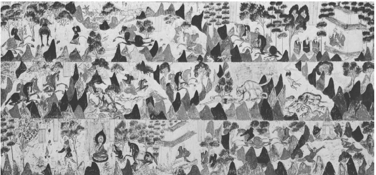
[31] Mahasattva džátaka, dynastie Zhou, 6. stol.