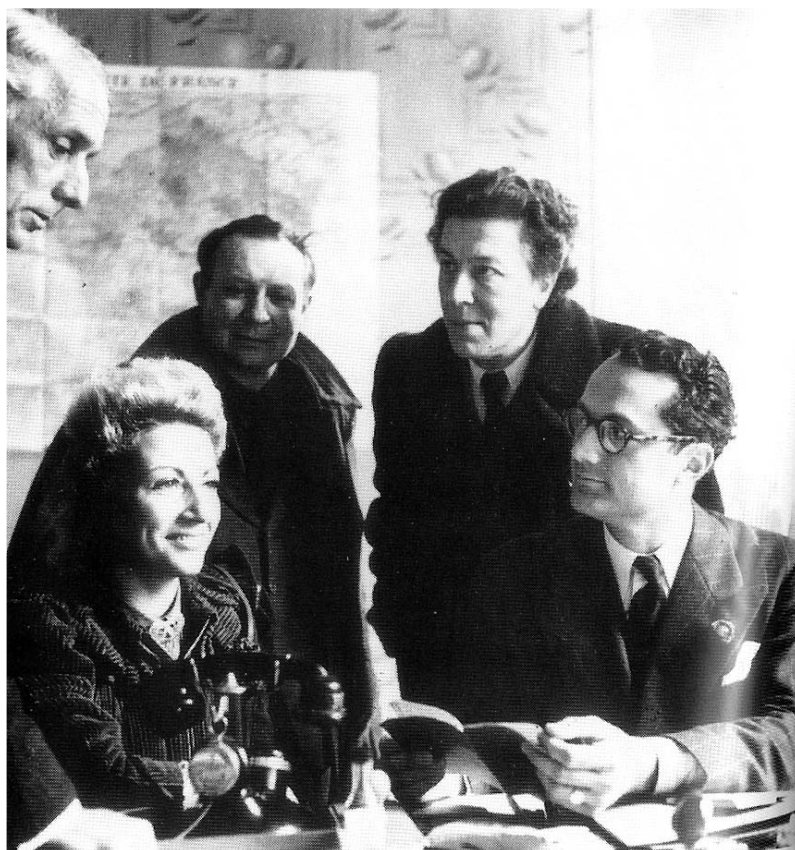
obr. 8 Zleva: Max Ernst, Jacqueline Lamba Breton, André Masson, André Breton, Varian Fry. Převzato z: Varian Fry: Surrender on Demand.