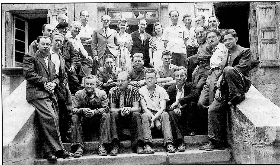
obr. 7 Osazenstvo československé farmy Lapeyre.