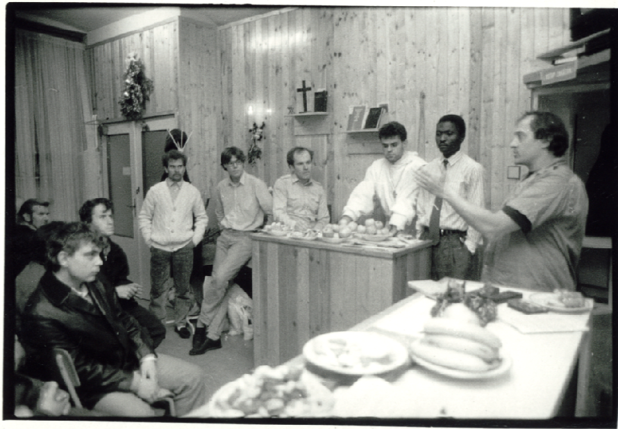
Foto č. 5 bohoslužba, středisko Bolzanova, 1991