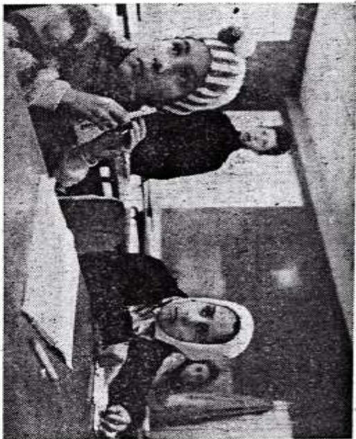
Ze školy v Jablonceku

Učila jsem čísování slovesa nit a zcela náhodně jsem napsala na tabuli substantivum chleba. To splošnil sňho u sáde by jíté zádné sňmce nuyvo.