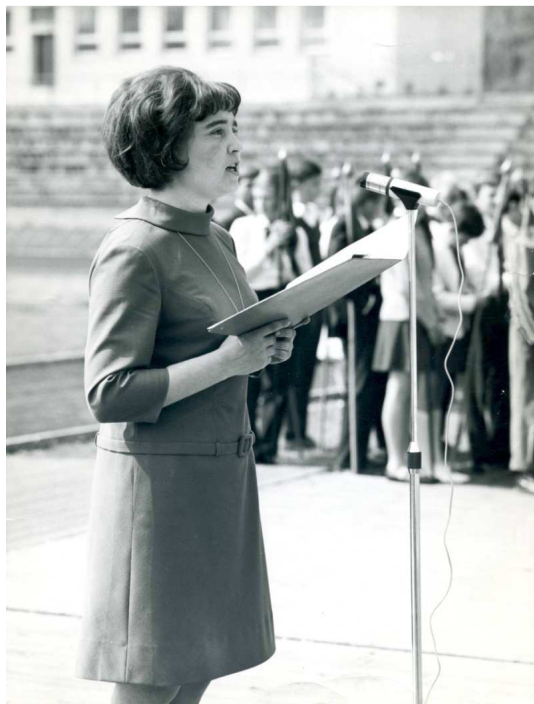
Foto č. 1 Závěr akce Děti dětem, 1968