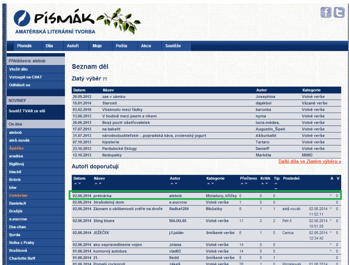
Obrázok 4 – Pozícia vloženého diela