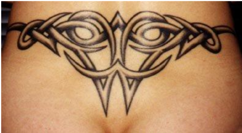
Obr. 4 příklad moderního abstraktního tetování od Musy (Dostupné z: www.tribo.cz )