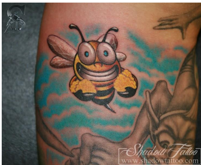
obr. č. 6, ukázka humorného tetování