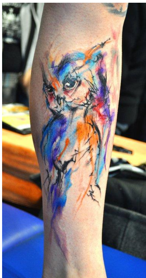
Obr. 4 příklad moderního abstraktního tetování od Musy