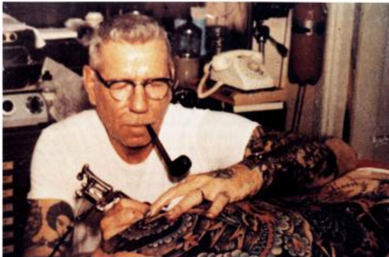
obr. 1 Sailor Jerry