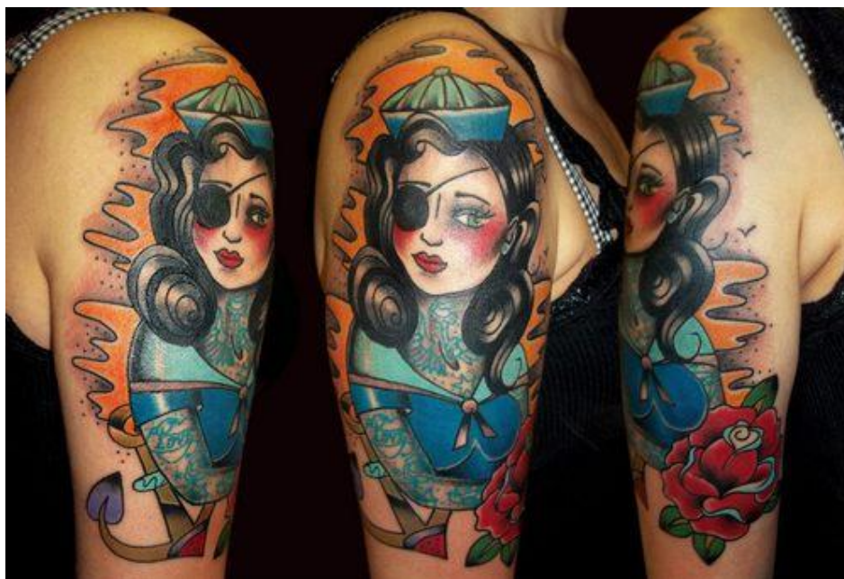
Obr. č. 5, ukázka old school stylu, autorka Tereza Pet