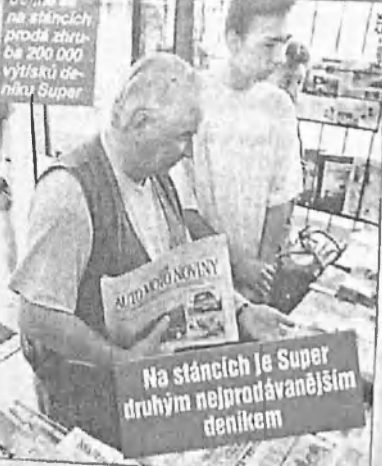
Dělníci na stáncích prodali zhruba 200 000 výtisků deníku Super