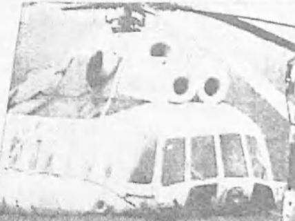
Nikdo z posádky vrtulníku není podle lékařů v ohrožení života