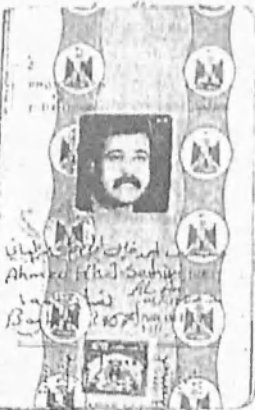
Kopie pasu iráckého konzula, ležící vložena v zápisník CIA

... vyhoštění... Super též vyprávěl, že obdivoval... Stanislav Gross... "Dělal jsem..."