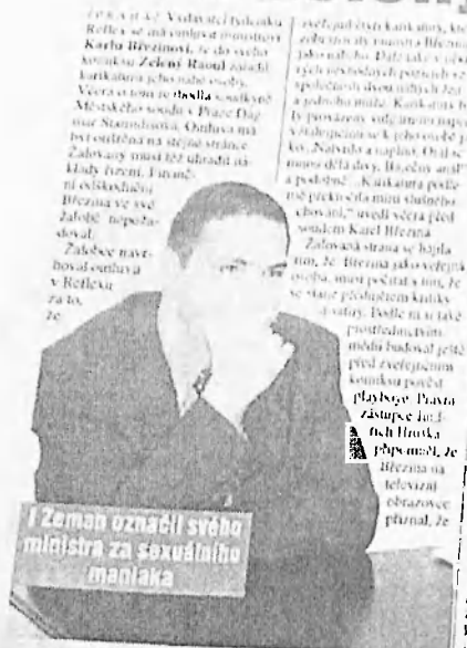
Zeman označil svého ministrůva za sexuálního maniaka