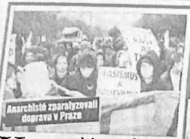
Anarchisté zparalyzovali dopravu v Praze