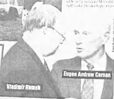
Eugen Andrew Černan