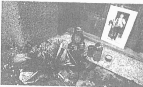
Svitavari zapauji prod učičištem svičky

Řešiče chlape včera TV Nova řekl, že je jeho syn a stěžoval na to, že je učitel zesměšluje a pomůže. „Nadl ho napřiklad třikrát za sebou pzdávati,“ řekl chlapev otec. Syn