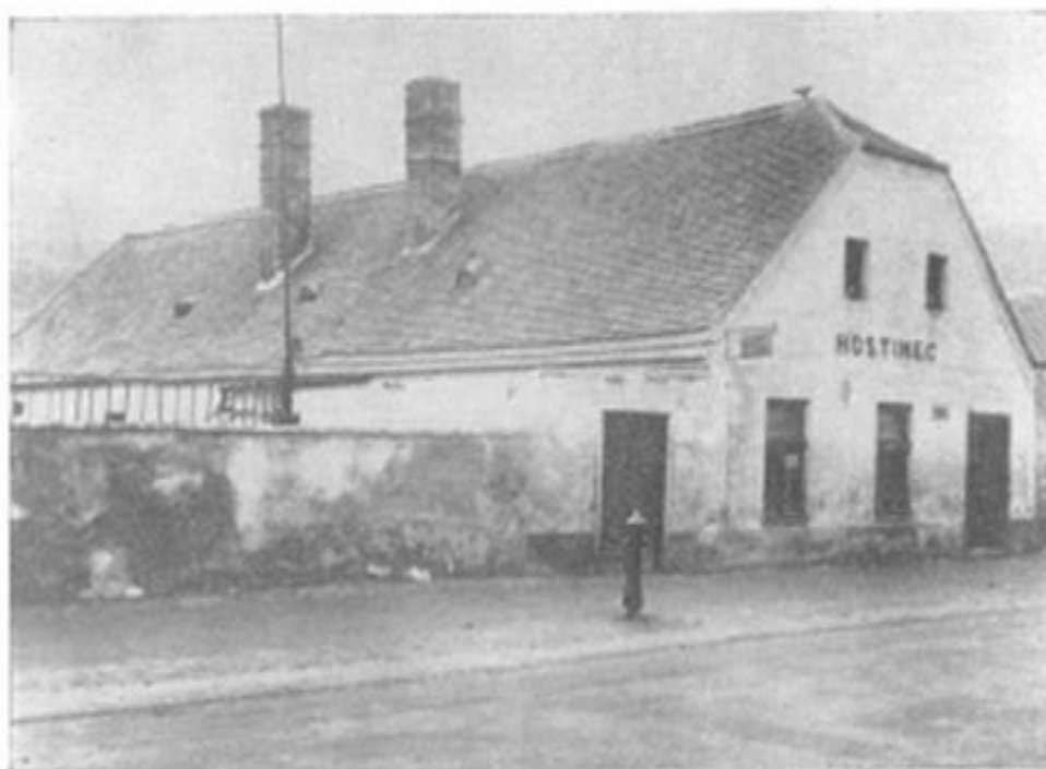
2. Rodný domek Bohumíra Šmerala v Třebíči.