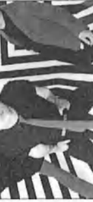
Green Day: American Idiot