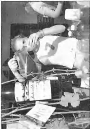
Desítky tisíc lidí o víkend ochutnali v Mělníku štiavu z plodů vinné révy