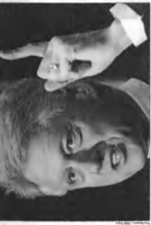
Bill Clinton se srdečními problémy potýká již několik let. Před několika dny mu bylo zjištěno, že má ucpané srdeční tepny až o 90 procent. Brzy by ho stihl infarkt.

Některé srdeční tepny už měl ucpané z 90 procent, brzy by ho stihl infarkt