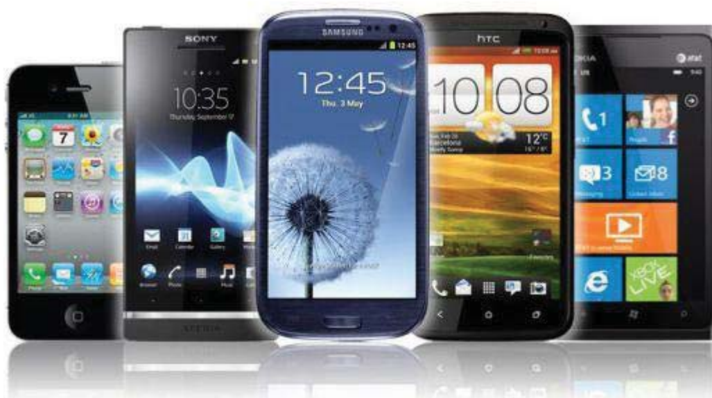
Obrázek č. 2 Chytré telefony