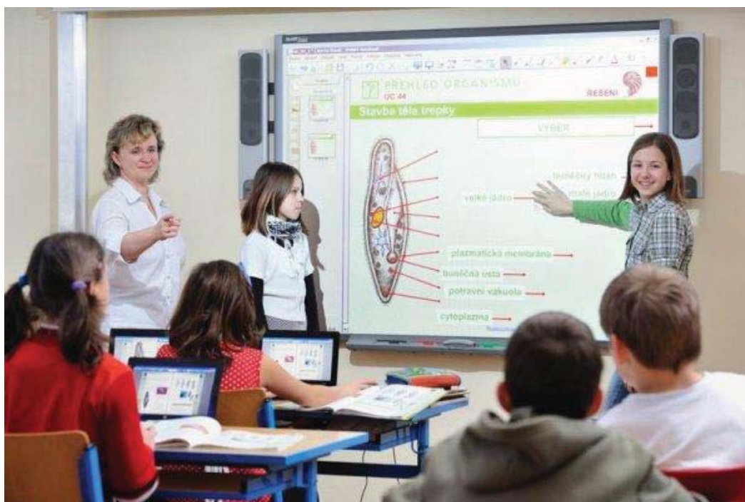
Obrázek č. 4 Interaktivní tabule, zdroj: http://www.vzdelani21.cz/zaci-a-studenti/