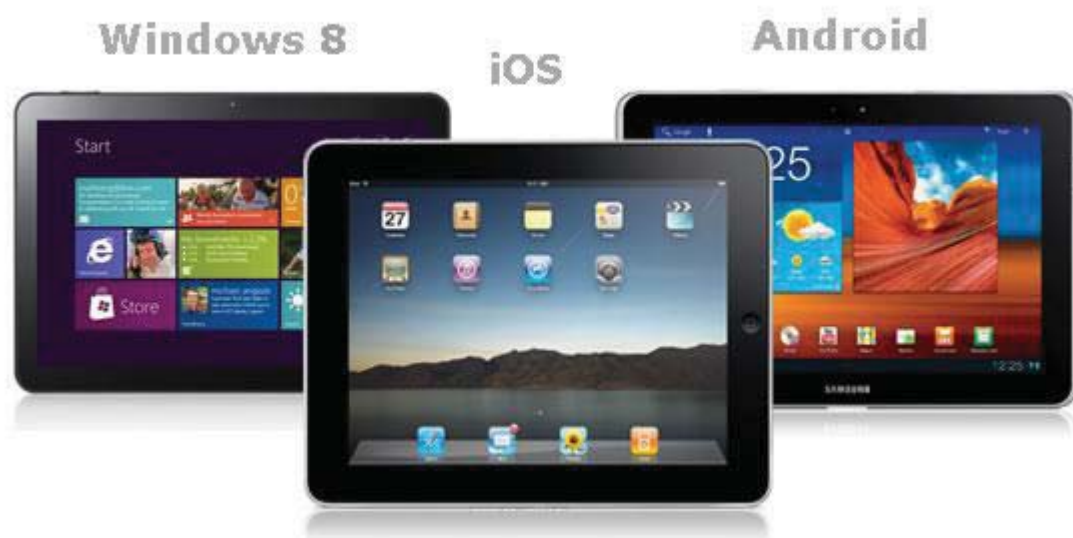
Obrázek č. 1 Tablety