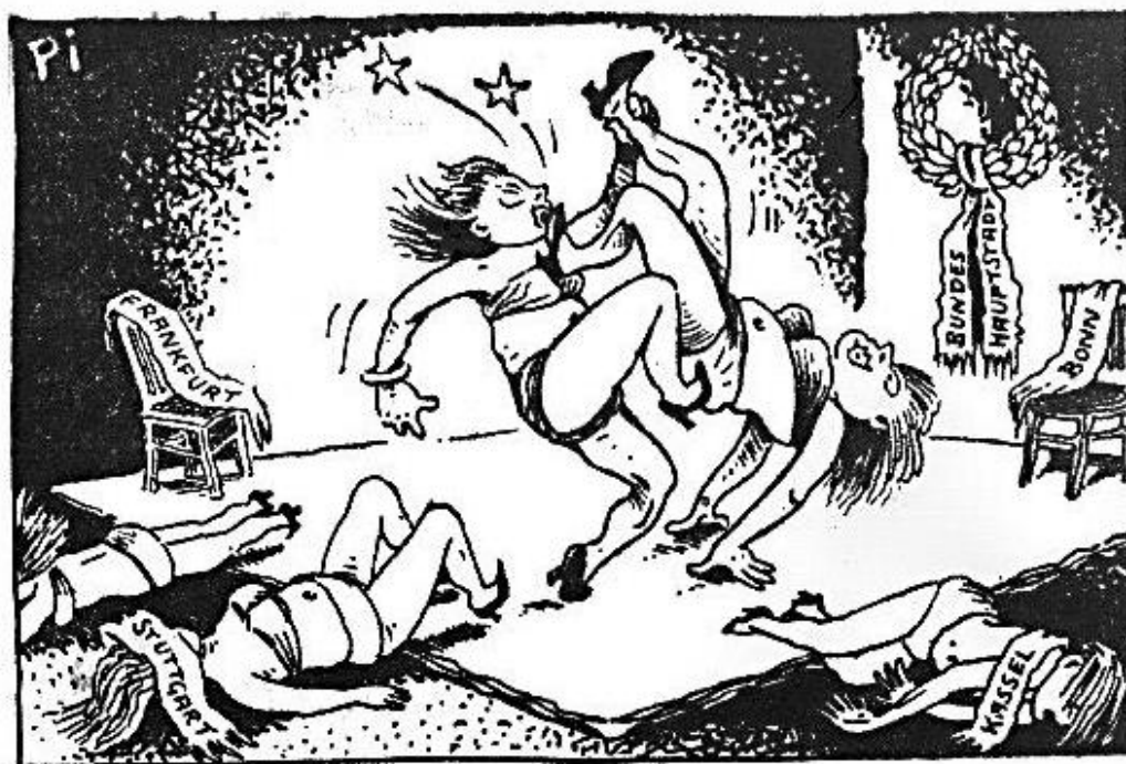
Bonn – Frankfurt: Städterringkampf im Freistil

Příloha č. 1: Karikatura „Bonn – Frankfurt: boj měst ve volném stylu“ (obrázek)