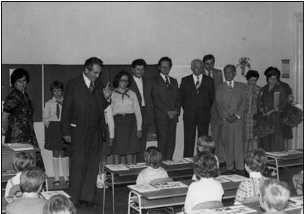
Příloha 24: Zahájení školního roku ve škole v Hostivicích v roce 1979; www.hostivickahistorie.cz .