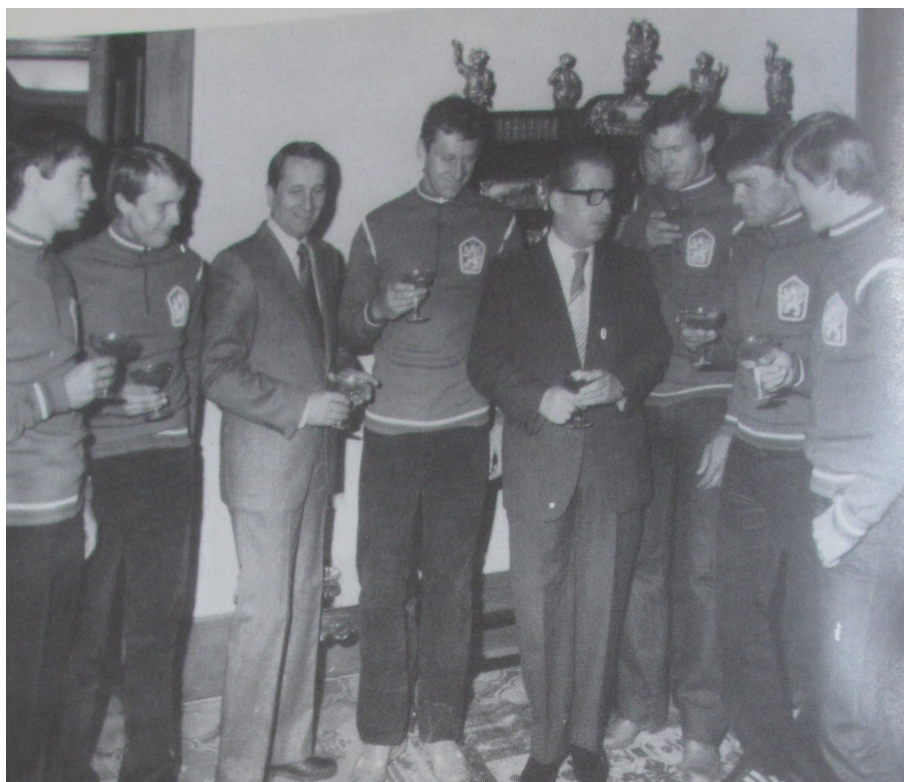
Příloha 21: Setkání cyklistů s Lubomírem Štrougalem v roce 1984; RP, 1984.