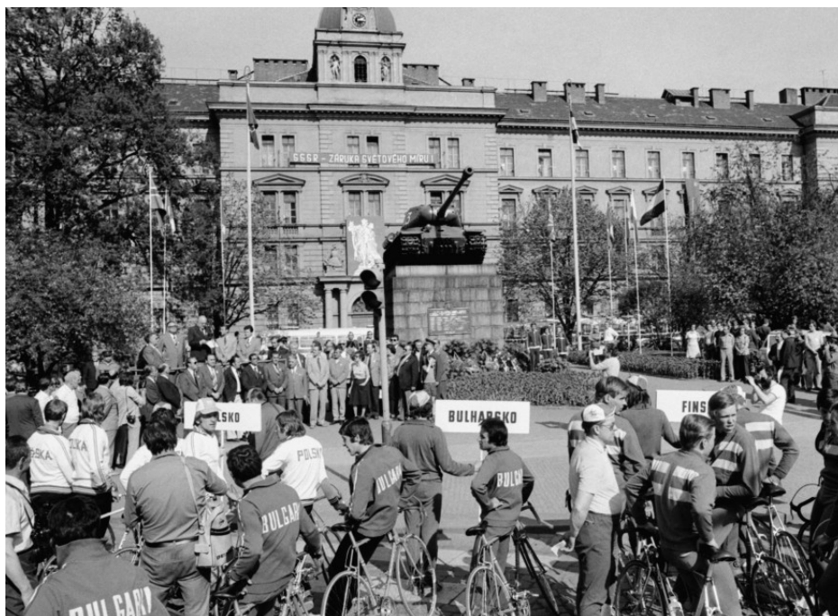
Příloha 20: Zahájení Závodu míru na Náměstí sovětských tankistů v Praze v roce 1976; ČTK.