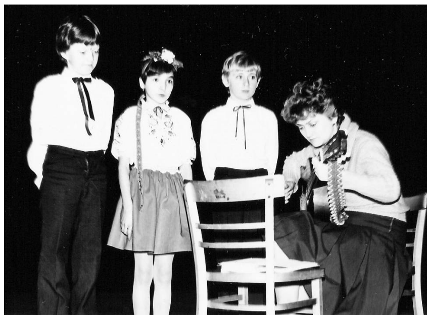
Příloha 8: Vystoupení v rámci oslav MDŽ ve Slabcích v roce 1986; www.rakovnický.denik.cz .