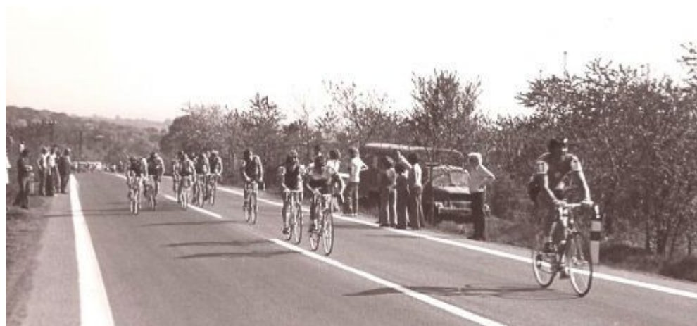
Příloha 12: Průjezd Závod míru v Pohořanech u Ronova v roce 1973; www.podhorany.cz .