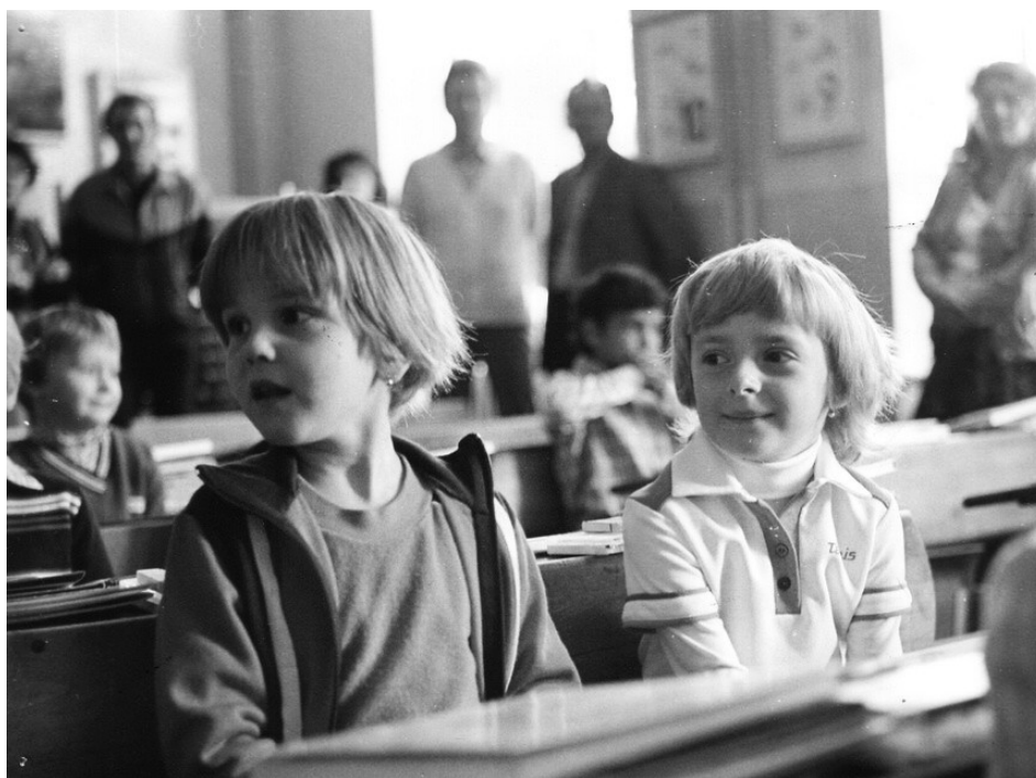
Příloha 26: Zahájení školního roku v Roudnici nad Labem v roce 1980; www.zsskolni-rce.cz.