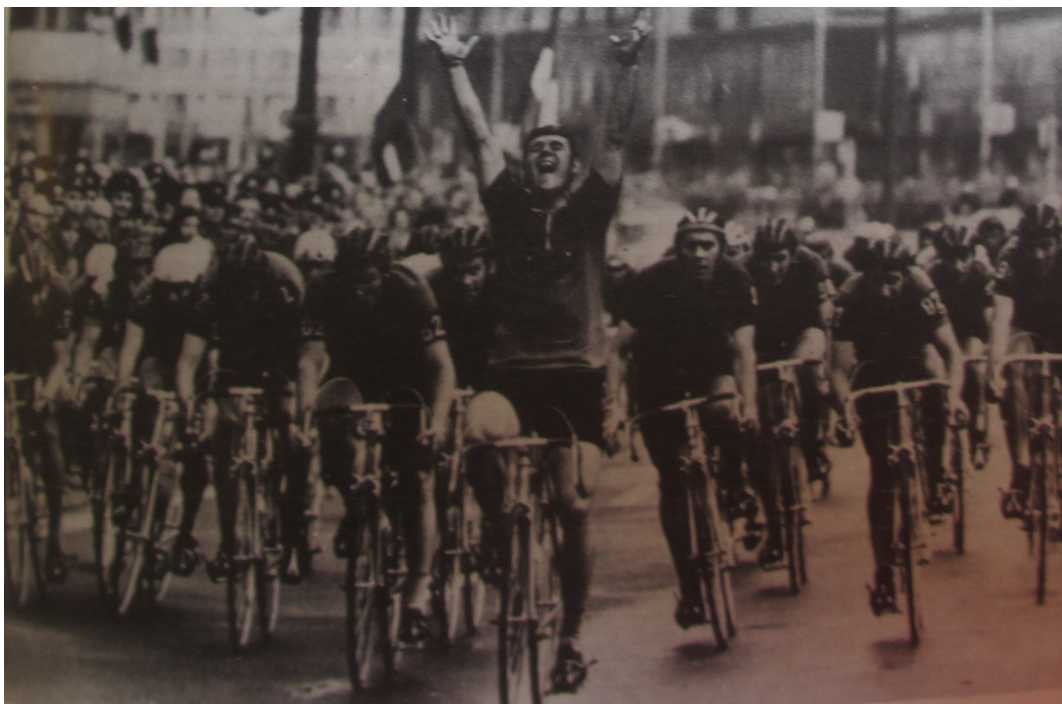
Příloha 16: Dojezd etapy Závodu míru v roce 1973; 34. ročník Závodu míru, 1984.