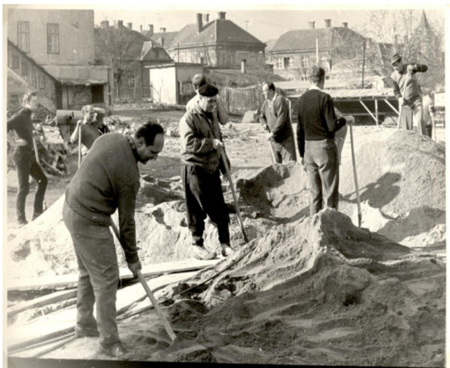
Příloha 22: Brigáda na stavbě nové školy ve Znojmě v 70. letech; www.nuov.cz .