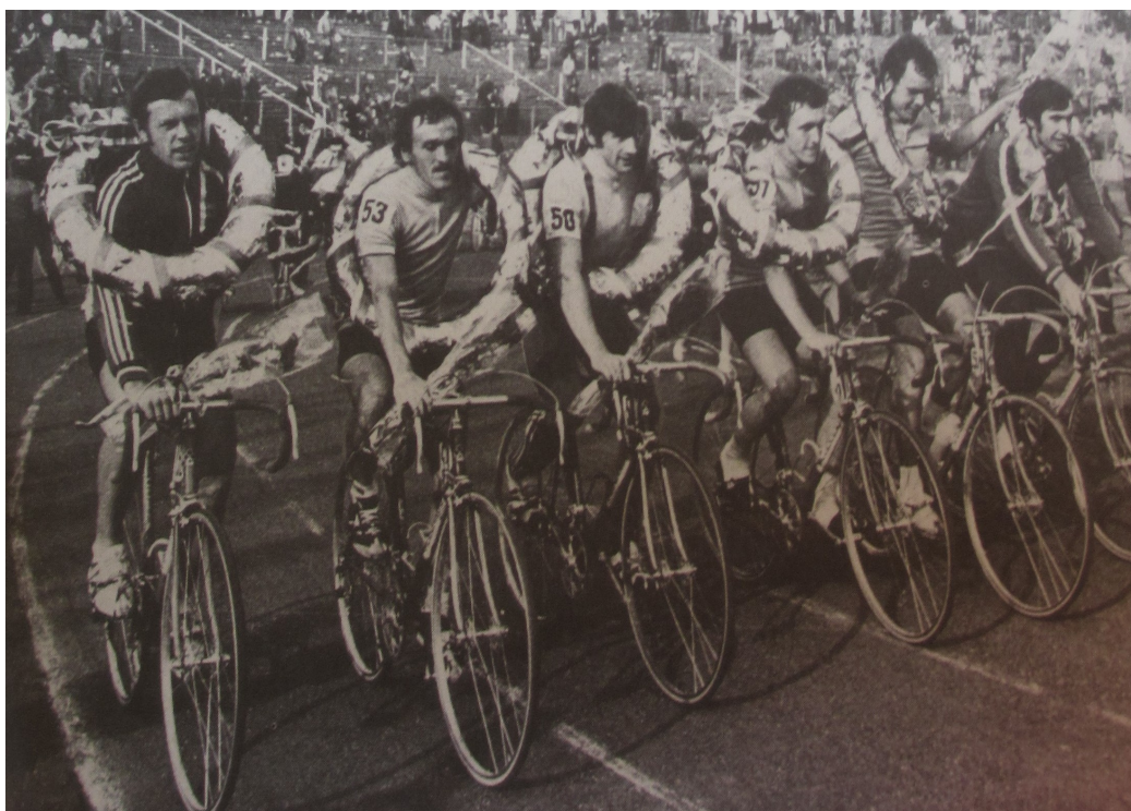
Příloha 15: Družstvo SSSR v pražském Edenu; 34. ročník Závodu míru, 1984.