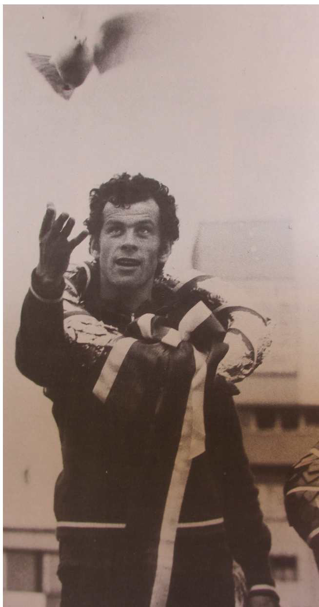
Příloha 13: Cyklista s holubicí; 34. ročník Závodu míru, 1984.