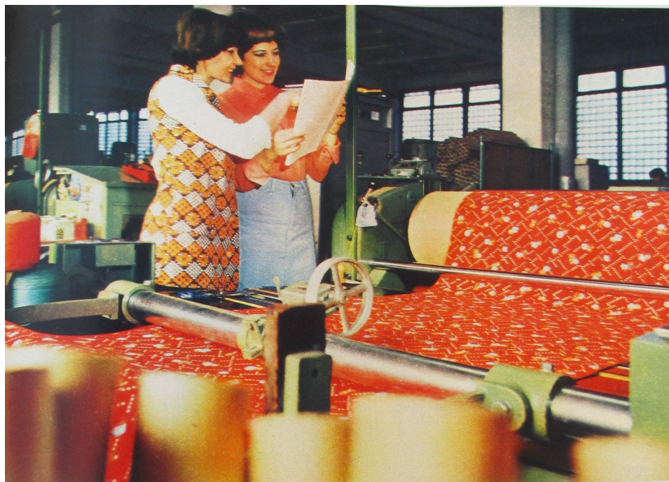
Příloha 2: Ženy - pracovnice; Svět v obrazech, 1977.