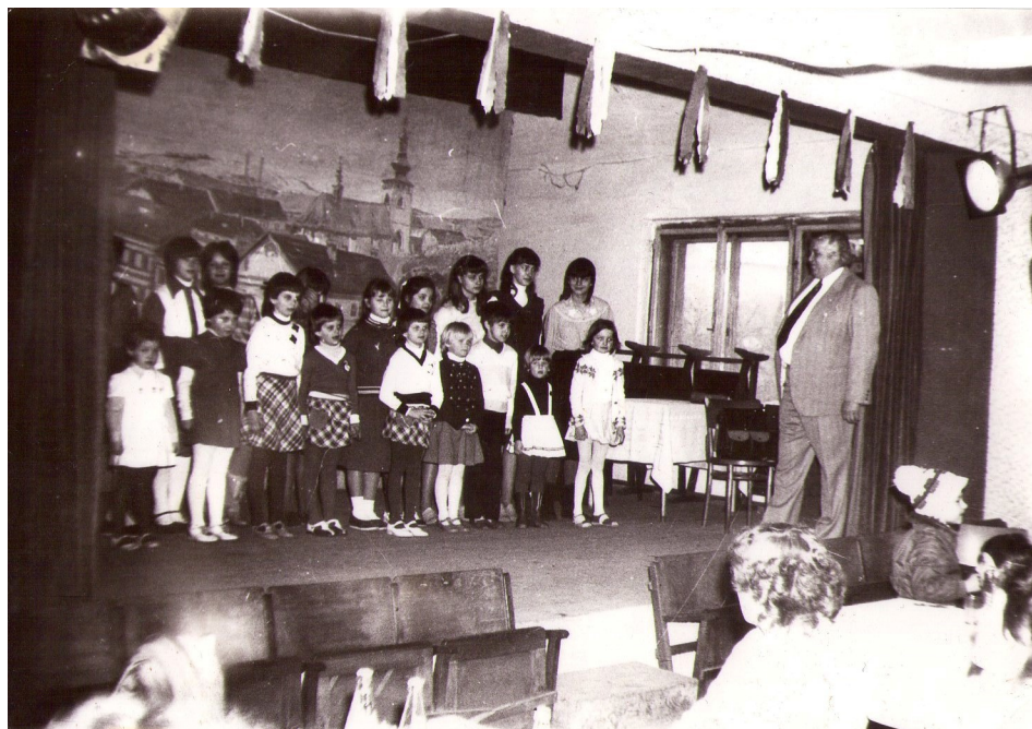
Příloha 7: Vystoupení dětí na oslavě MDŽ v hospodě v obci Tisem u Benešova; www.tisem.cz .