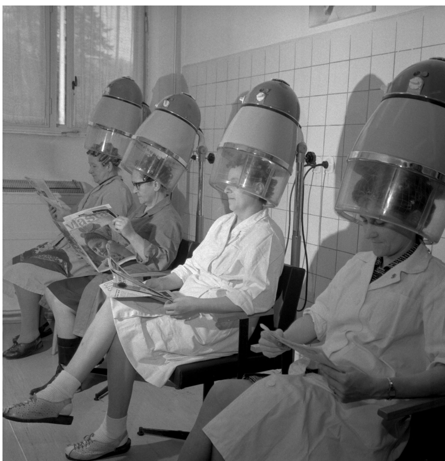
Příloha 4: MDŽ ve Vitaně Byšice v roce 1973; ČTK.