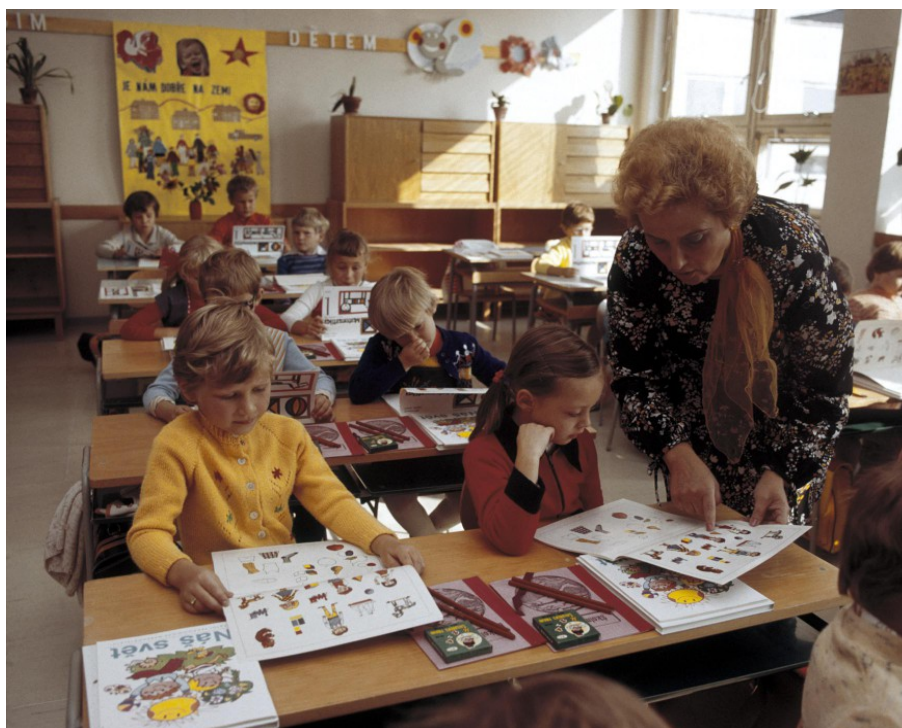
Příloha 27: Zahájení školního roku ve škole na Praze 4 v roce 1978; ČTK.