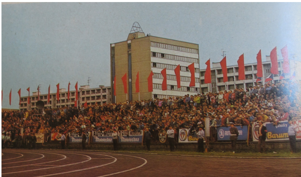
Příloha 18: Dojezdový prostor etapy v Mladé Boleslavi; Mladá Boleslav; 1977.