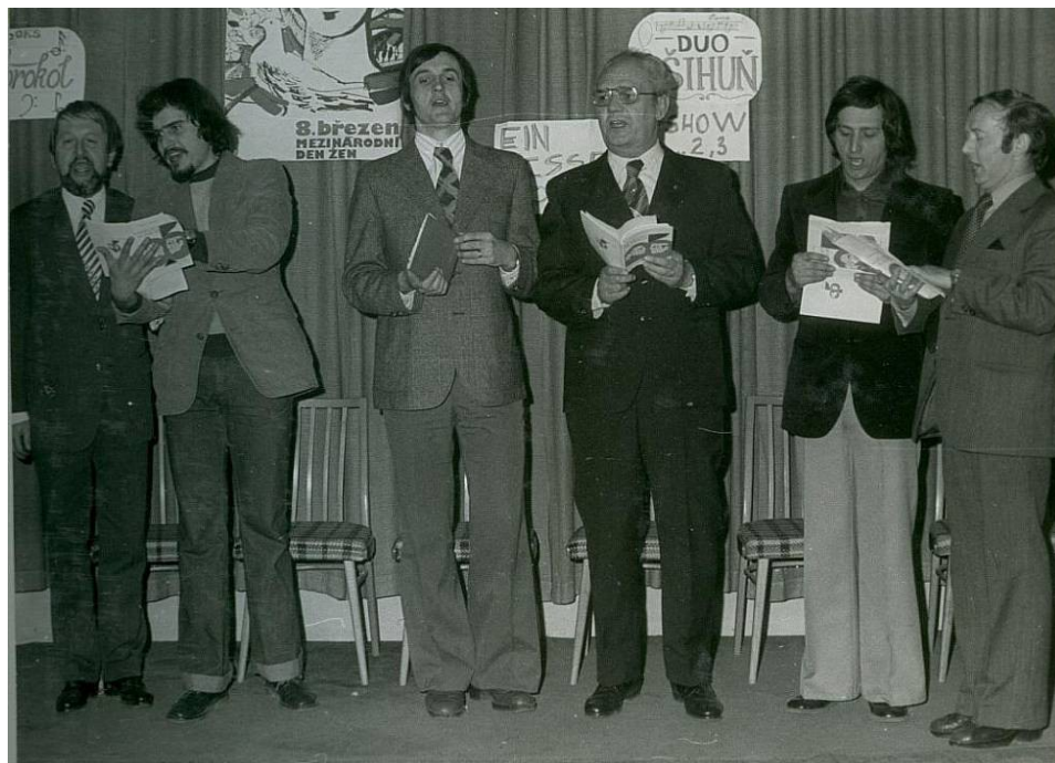
Příloha 9: Oslava MDŽ v Okresním kulturním středisku Prostějov v roce 1978; www.prostejovsky.denik.cz .