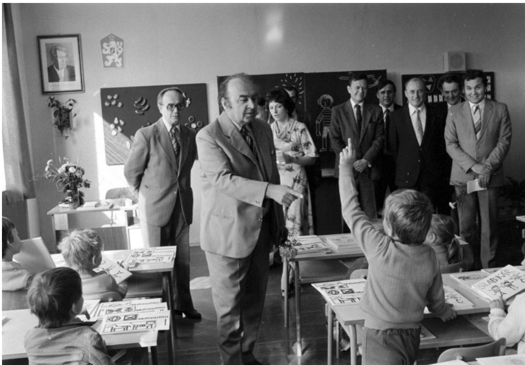
Příloha 25: Zahájení školního roku ve škole v pražských Kyjích v roce 1981, v popředí ministr školství Milan Vondruška; ČTK.