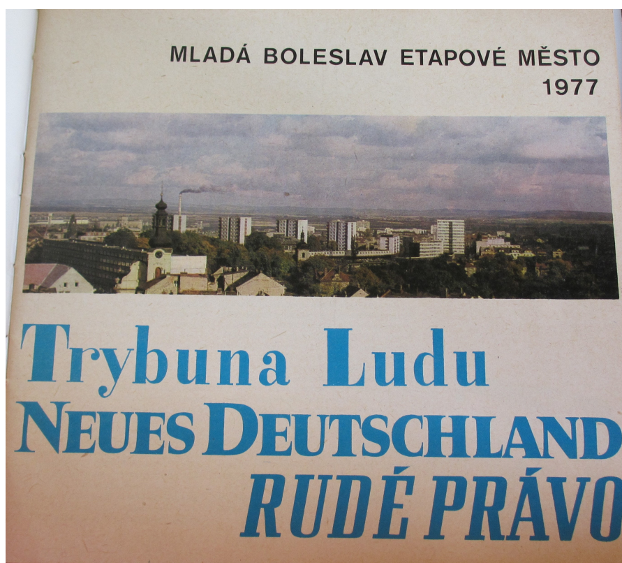
Příloha 17: Propagační publikace etapového města v roce 1977; Mladá Boleslav, 1977.