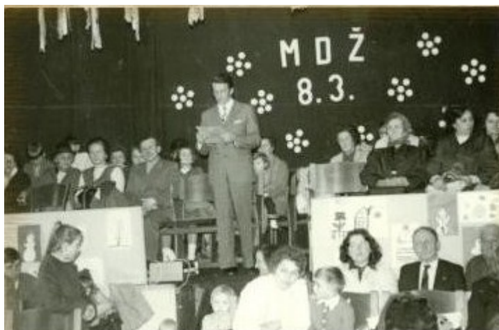
Příloha 6: Proslov k MDŽ v obci Bouzov; www.zsbouzov.cz .