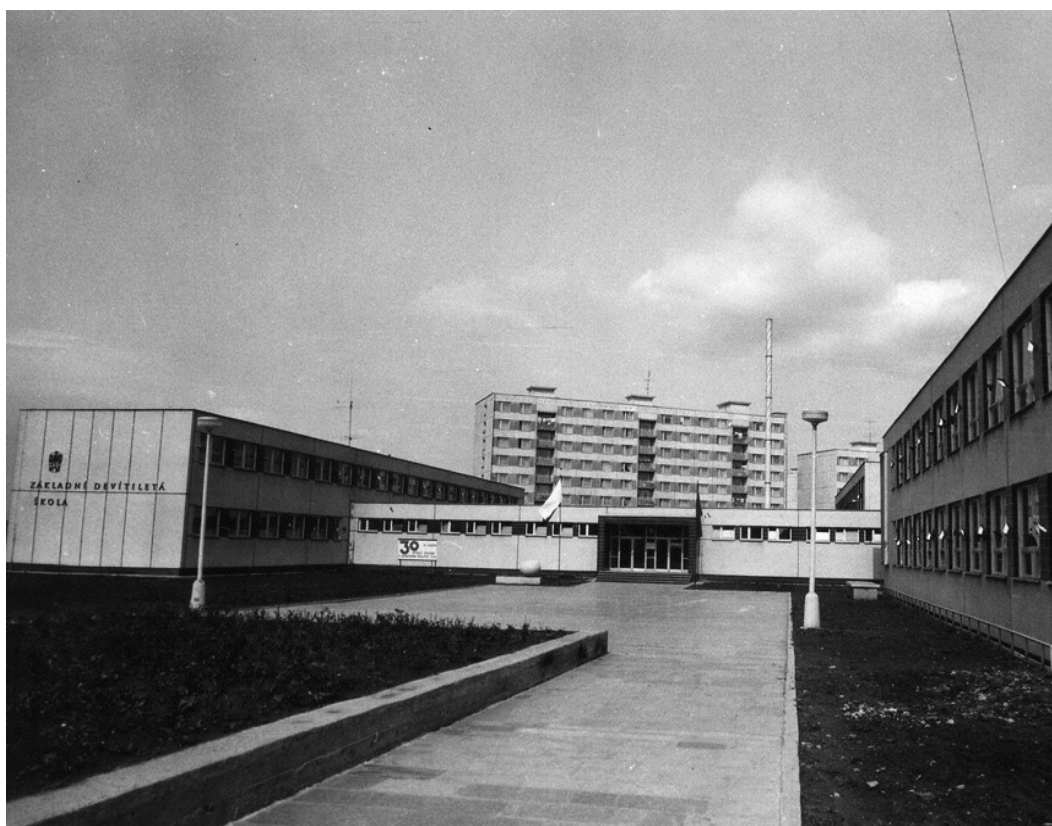
Příloha 23: Nová budova školy v Roudnici nad Labem v roce 1977; www.zsskolni-rce.cz .