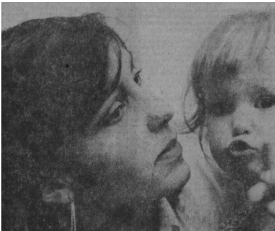
Příloha 1: Žena - matka na titulní straně Rudého práva; RP, 1982.