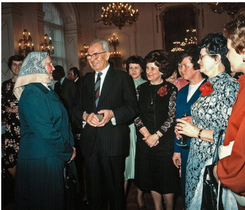
Příloha 5: Oslava MDŽ na Pražském hradě v roce 1980.