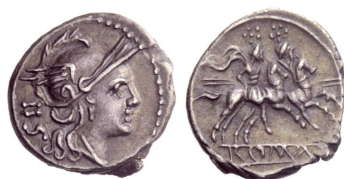
sestercius s označením “IIS”