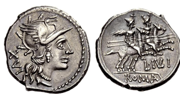
denár s označením “XVI”