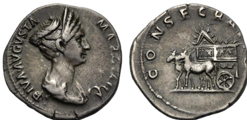
Tretí typ denáru, (RIC II, Traianus 747)