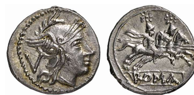
quinárius s označením “V”