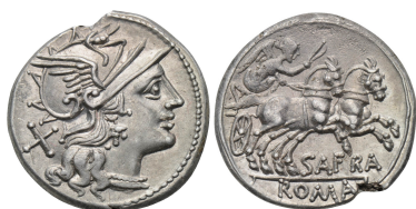
denár s označením “X”