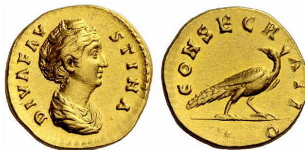
Denár s rovnakým motívom aj opisom. (RIC III, Antoninus Pius 384)

Aureus s portrétom Faustíny a opisom DIVA FAUSTINA na averse a s pávom a opisom CONSECRATIO na reverze. Páv na reverze konsekračných mincí odkazuje na nebeský pobyt zbožtenej ženy. Páv bol spájaný s bohyňou Junónou, ktorá bola ochránkyňou manželstva a rodinného života. Bez bližšieho datovania. (RIC III, Antoninus Pius 384)