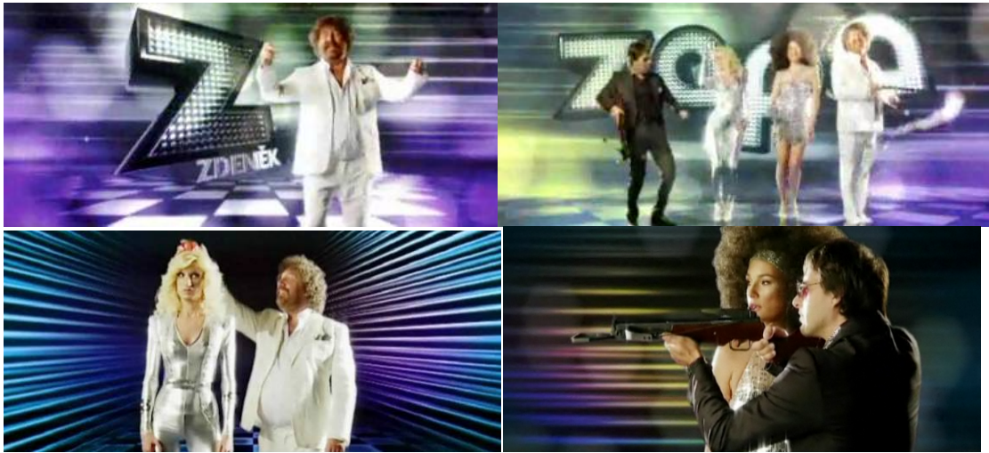
Příloha č. 11: Ukázka poutání na Talentmania maraton (obrázek)