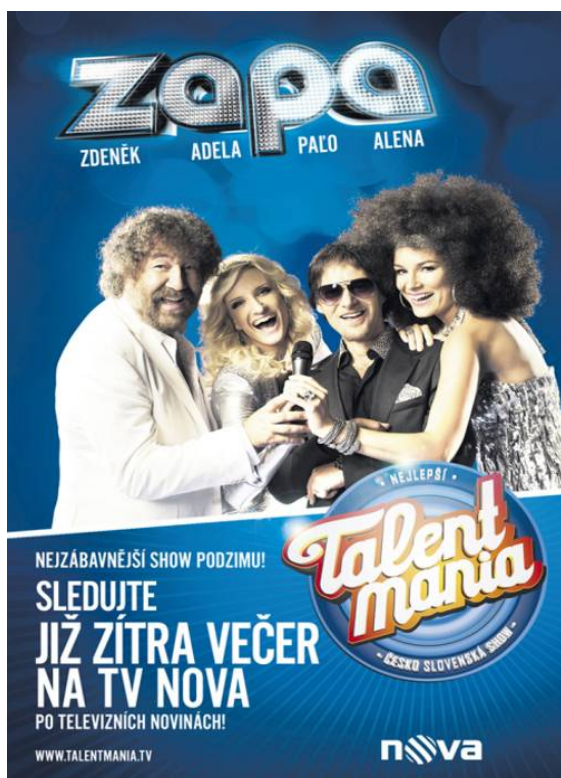
Příloha č. 20: Vizuál inzerce show Talentmania (obrázek)