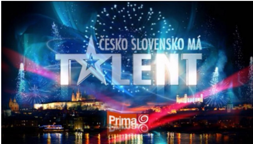
Příloha č. 28: Upravené logo televize Prima doplněné „má talent“ (obrázek)