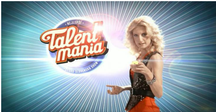
Příloha č. 8: Ukázka spotu pořadu Talentmania se soutěžícím (obrázek)