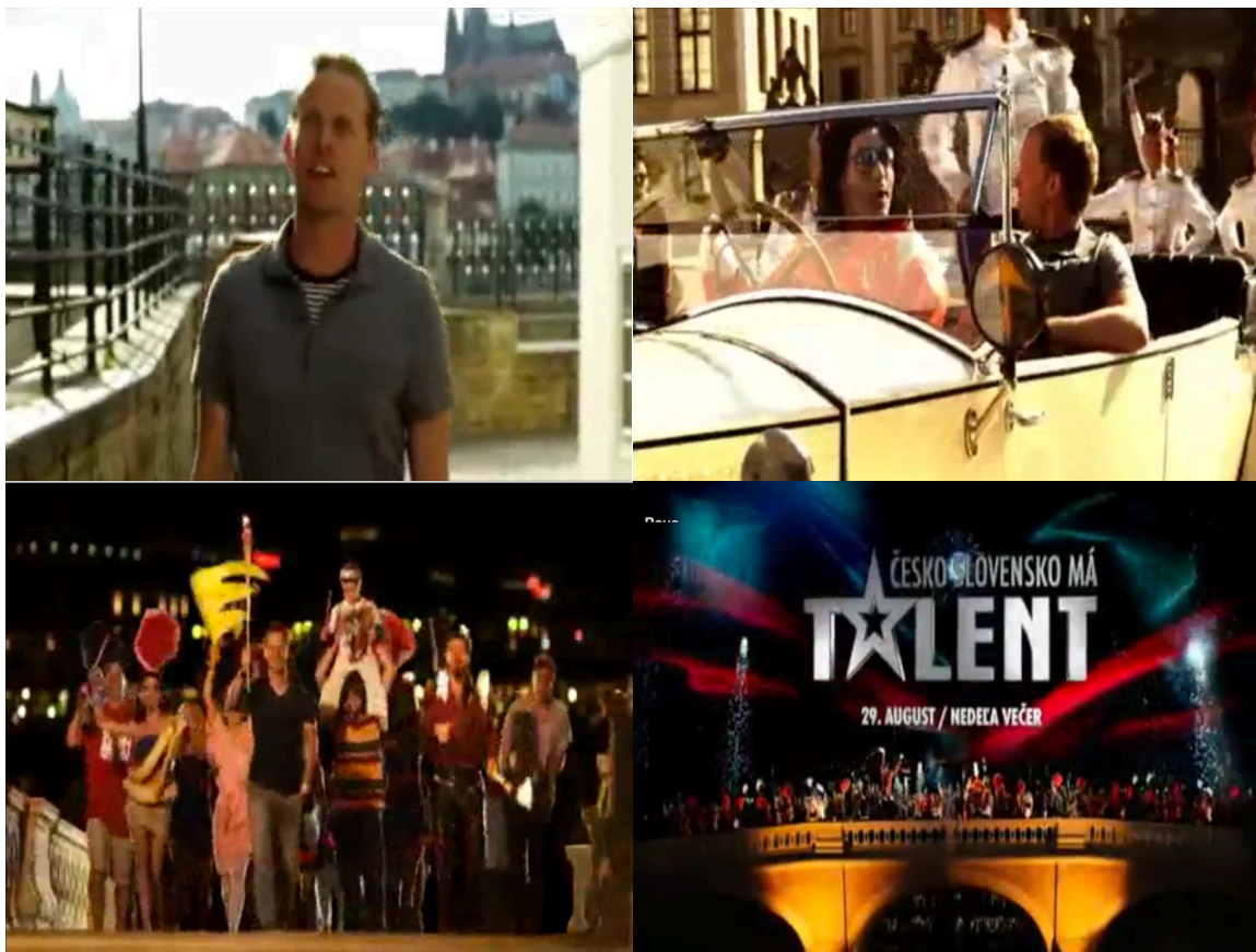
Příloha č. 26: Logo pořadu Česko Slovensko má talent (obrázek)