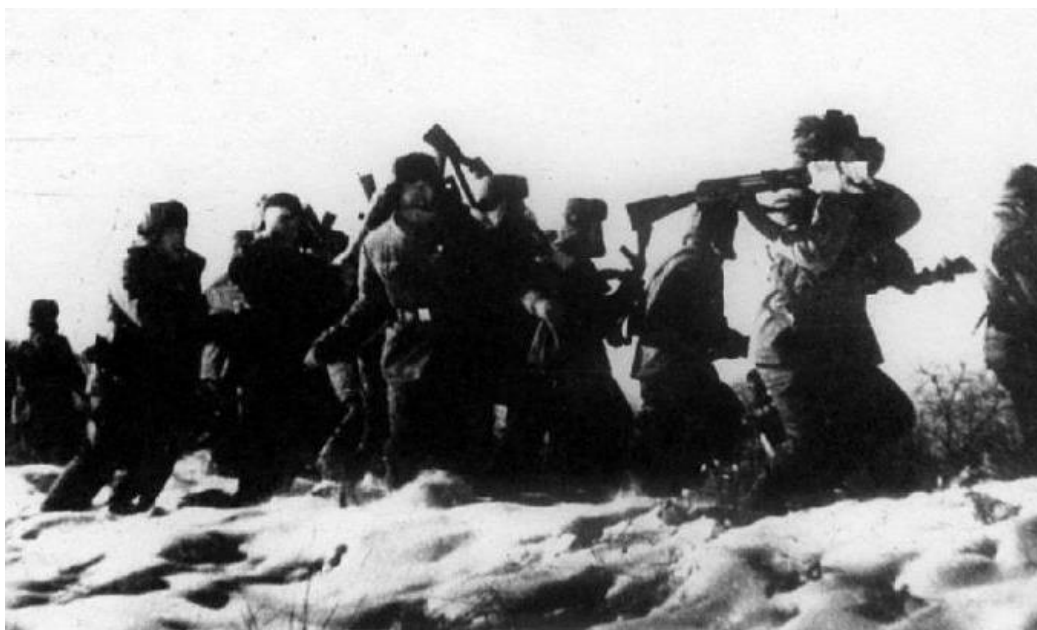
Příloha č. 8: Jedna z bitek mezi čínskými vojáky a sovětskými pohraničníky, leden 1969.