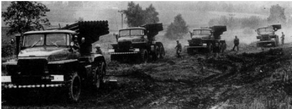
Příloha č. 7: Baterie raketometů BM – 21