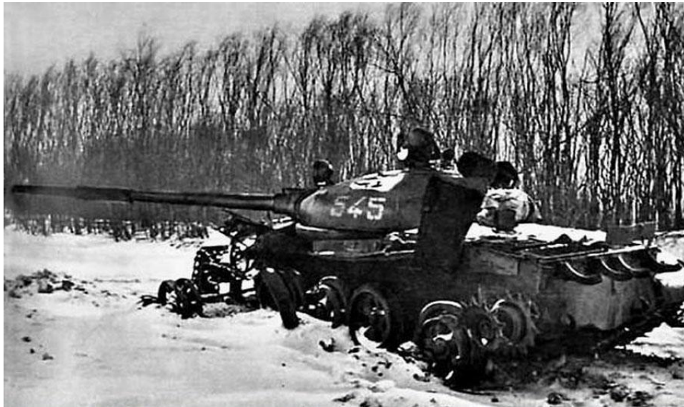
Příloha č. 6: Sovětský tank T-62 zničený na ostrově Damanskij 15. března 1969.