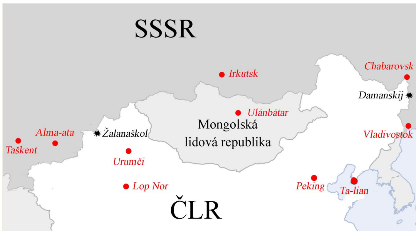
Příloha č. 1: Místa tří největších incidentů