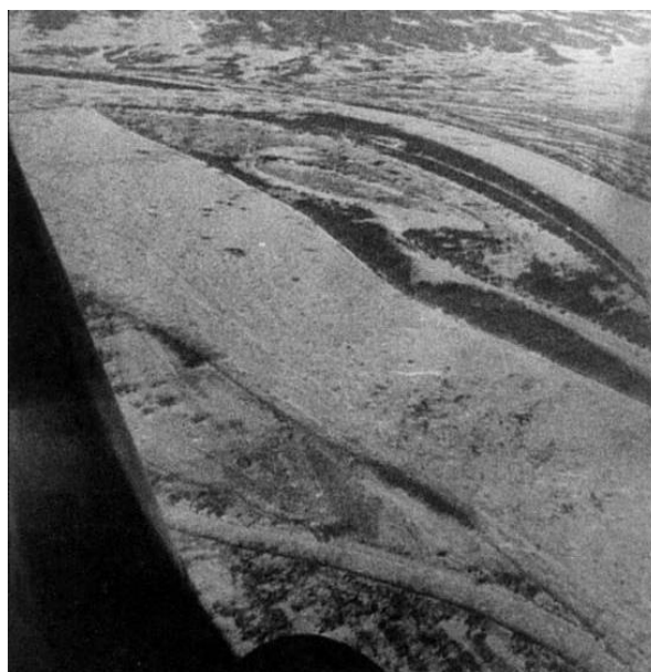
Příloha č. 4: Letecký snímek ostrova Damanskij