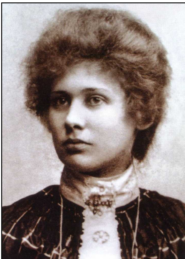
Obrázek 7: Ita Wegmanová v roce 1899.

rychleji a do školy pak vkráčela celá rozzářená (Selg 2000, s. 20). S mladší sestrou Charlien po základním vzdělání absolvovala i domácí výuku, poté na tři roky odcestovaly do nizozemského Anheimu k dalšímu studiu. V osmnácti letech potkala při zpáteční cestě na Javu svou první lásku, mladého důstojníka, který však záhy zemřel na tuberkulózní zápal plic. Po tomto zážitku se její životní styl změnil (Selg 2000, s. 21). Pohroužila se do svého duševního života, běžná společenská zábava ji nelákala. Vyhledala si učitelku klavíru a zpěvu, u níž se seznámila s teosofickou literaturou. Časem přešla na vegetariánskou stravu a u rodinného sídla v horách se pustila do budování květinové zahrady. Navzdory několika malarickým záchvatům jí samota zcela vyhovovala.