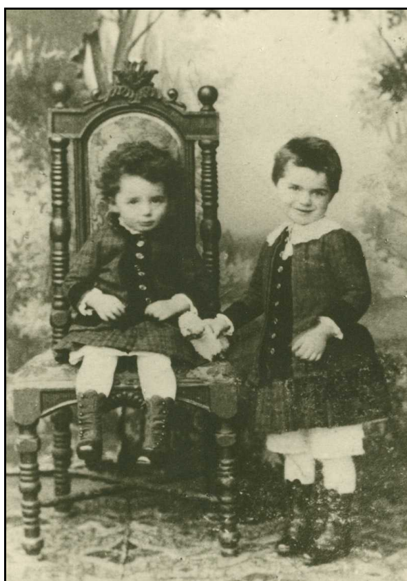
Obrázek 11: Rudolf Steiner (vpravo) se sestrou, kolem 1867.