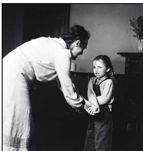
Obrázky 4, 5: Muzikoterapie a léčebná eurytmie s dětmi v camphillu, počátek 50. let.

Již v říjnu 1940 vešel prostřednictvím médií ve známost záměr Karla Königa, kromě dvaceti čtyř dětí poskytnout domov také dospělým lidem s postižením, což probudilo velký zájem o tento nevídaný způsob péče, první léčebně pedagogický domov ve Velké Británii. Karl König nezapomněl podotknout, že se jedná o křesťanskou komunitu (König in Pietzner 1990, s. 39). V roce 1941 se konala první, dobře navštívená léčebně pedagogická konference za účasti učitelů, lékařů, sociálních pracovníků a rodičů (Selg 2000, s. 274). Camphill postupně rostl, přibývalo dětí s vážným postižením i dětí, které zemřely. Karl König začal plánovat i vybudování malé kliniky (Selg 2000, s. 274).