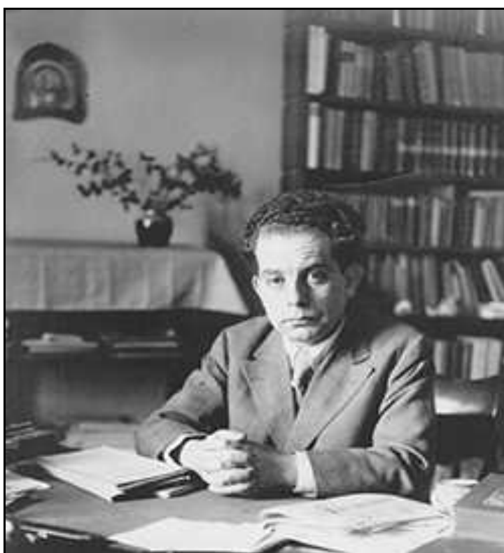
Obrázek 2: Karl König ve 30. letech