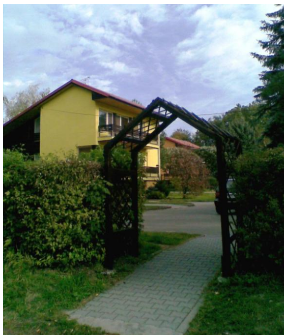
Obrázek č. 10 – SOS dětská vesnička Chvalčov – pohled do vesničky