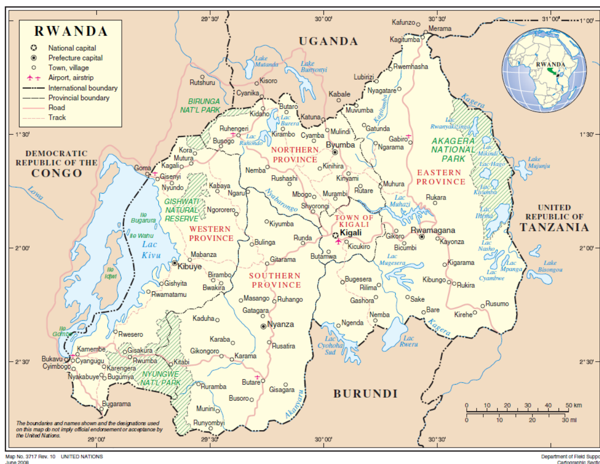
Obrázek 1 – Mapa oblasti 2

Území v konturách dnešního státu Rwanda, vklíněné mezi velká africká jezera – Viktoriino jezero na severovýchodě, jezero Tanganika na jihu a jezero Kivu na západě 1 – bylo integrální součástí rozsáhlejší oblasti centrální Afriky. V tomto rámci rozeznáváme tři výraznější geografické oblasti, které svým charakterem zakládaly způsob života lidí.