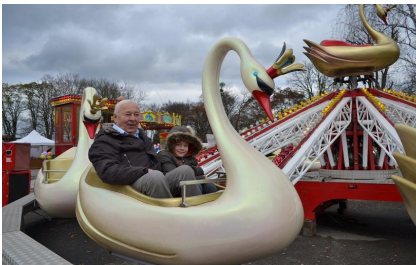
Fotografie č. 7

Jednou ze zábavných atrakcí, která se na návsi každým rokem objevuje, jsou létající labutě.