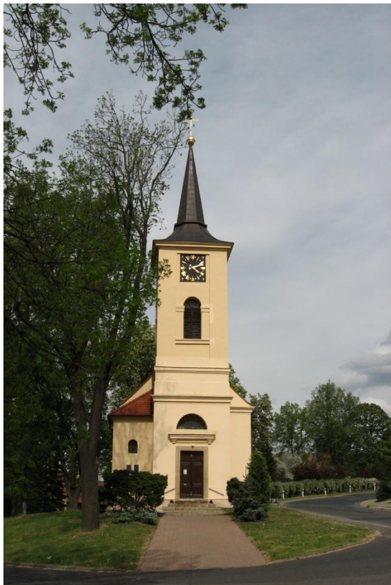
Fotografie č. 1