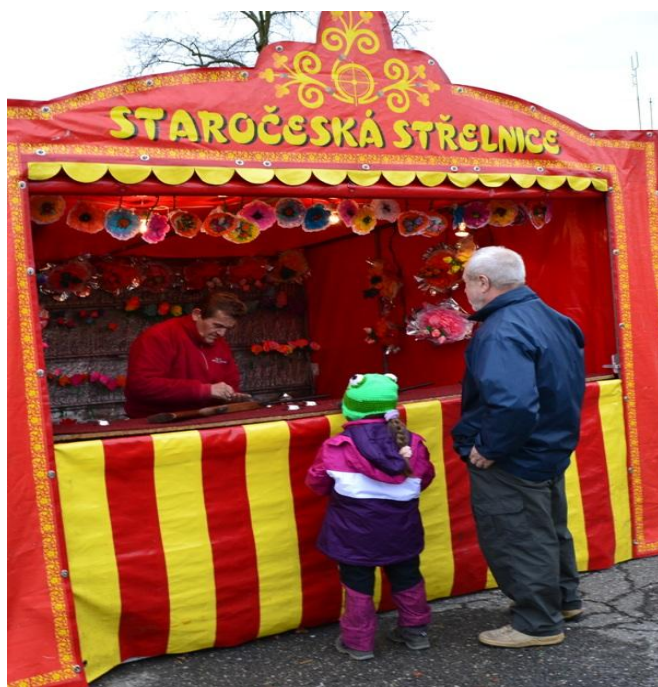
Fotografie č. 8

Jednou ze zábavných atrakcí, která se na návsi každým rokem objevuje, jsou létající labutě.