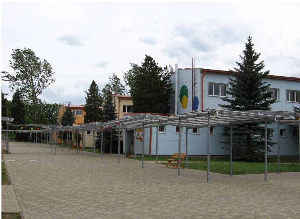
Fotografie č. 3