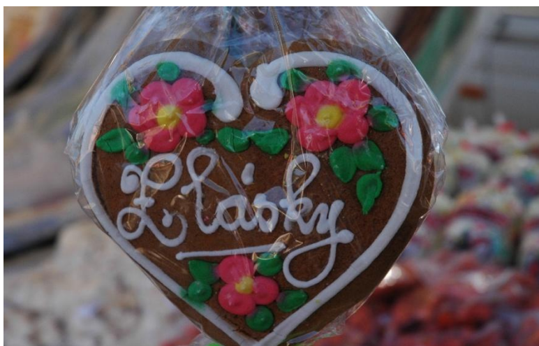
Fotografie č. 6

Děti se v rámci posvícenských oslav mohou povozit i na živých koních.