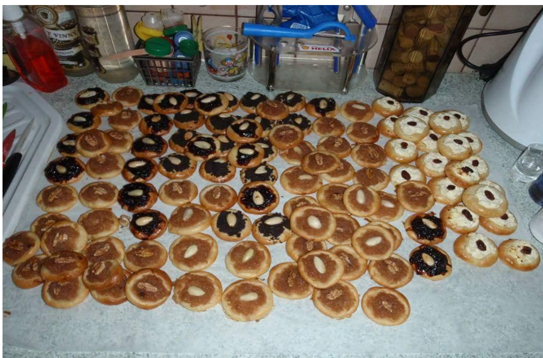
Fotografie č. 9

Neodmyslitelnou součástí rodinných oslav jsou posvicenské koláčky s různými náplněmi.