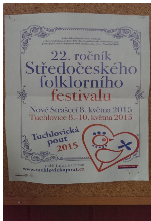
Fotografie č. 2

Plakát, lákající návštěvníky na 22. ročník Středočeského folklorního festivalu.