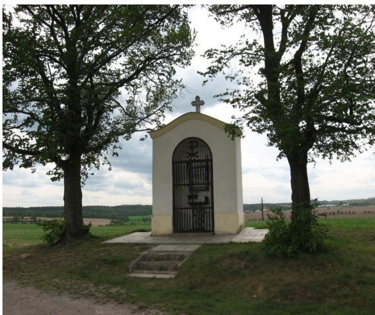
Fotografie č. 4

Kaplička sv. Floriána, k níž se v minulosti konaly pouti.