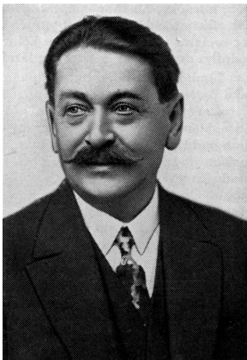
Obrázek 6: Krátce po první světové válce

(zdroj: Kol. autorů (ed. Josef Jirout), Luděk Pik: 60 let života: 35 let práce na Plzeňsku , s. 69)