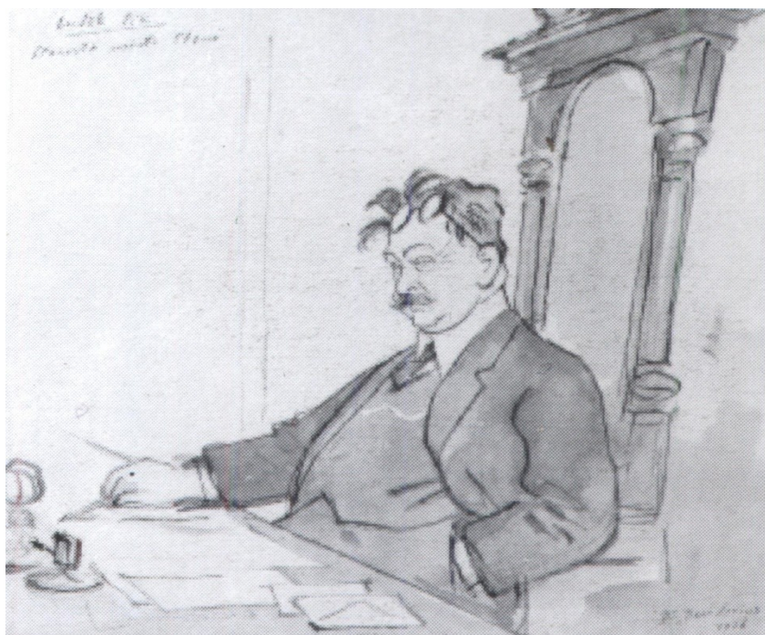
Obrázek 9: Starosta Pik na karikatuře H. Boettingera z roku 1926