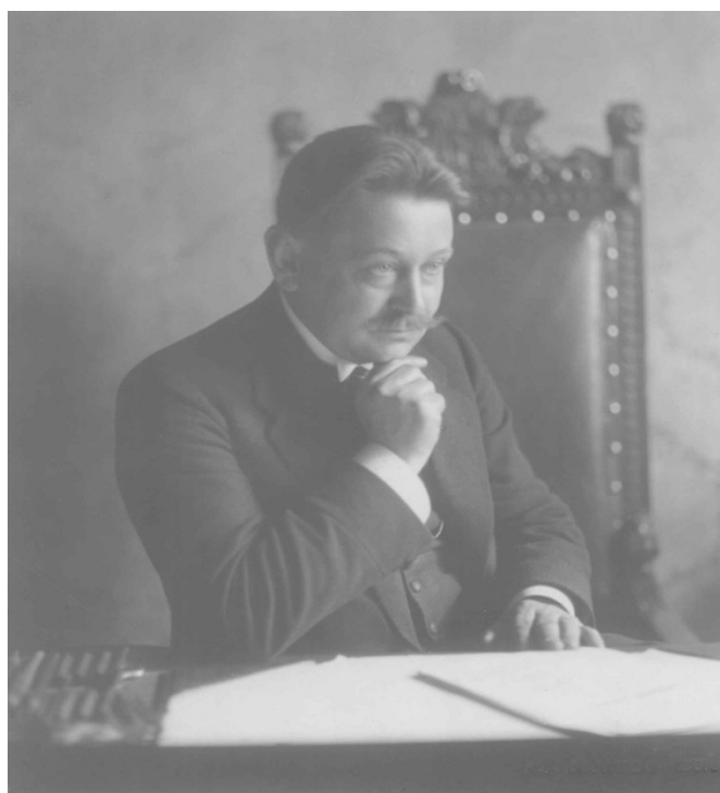
Obrázek 10: Ve své úřadovně na plzeňské radnici