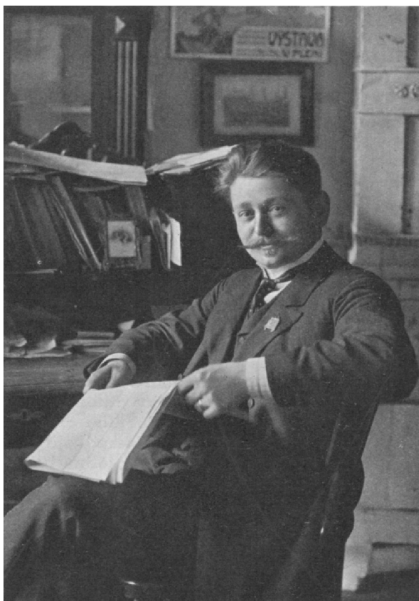
Obrázek 5: Novinář u redakčního stolku (1912)

(zdroj: Kol. autorů (ed. Josef Jirout), Luděk Pik: 60 let života: 35 let práce na Plzeňsku , s. 41)