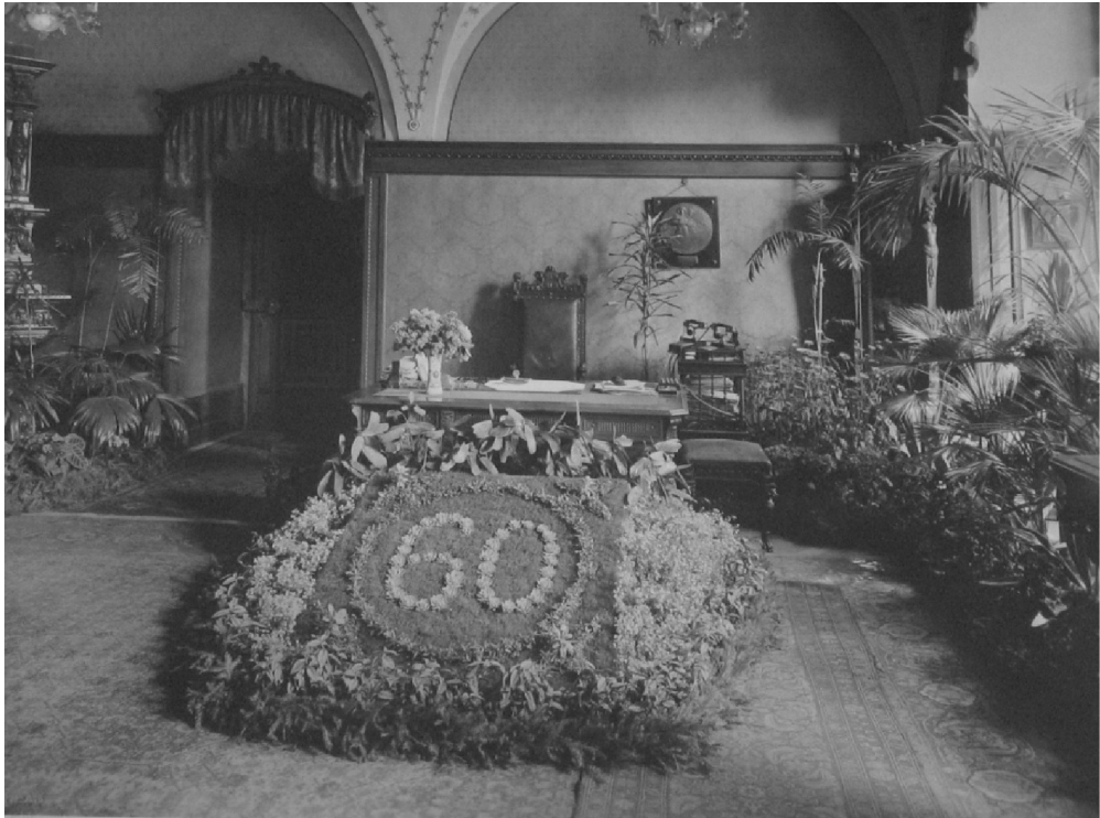
Obrázek 11: Výzdoba starostovy úřadovny v době jeho šedesátin (1936)