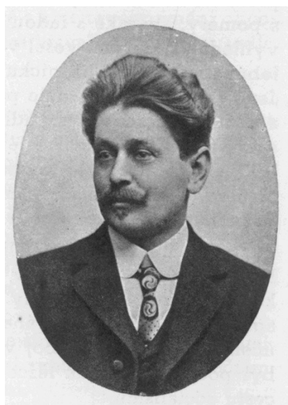
Obrázek 4: Říšský poslanec Pik v roce 1907

(zdroj: Kol. autorů (ed. Josef Jirout), Luděk Pik: 60 let života: 35 let práce na Plzeňsku , s. 41)