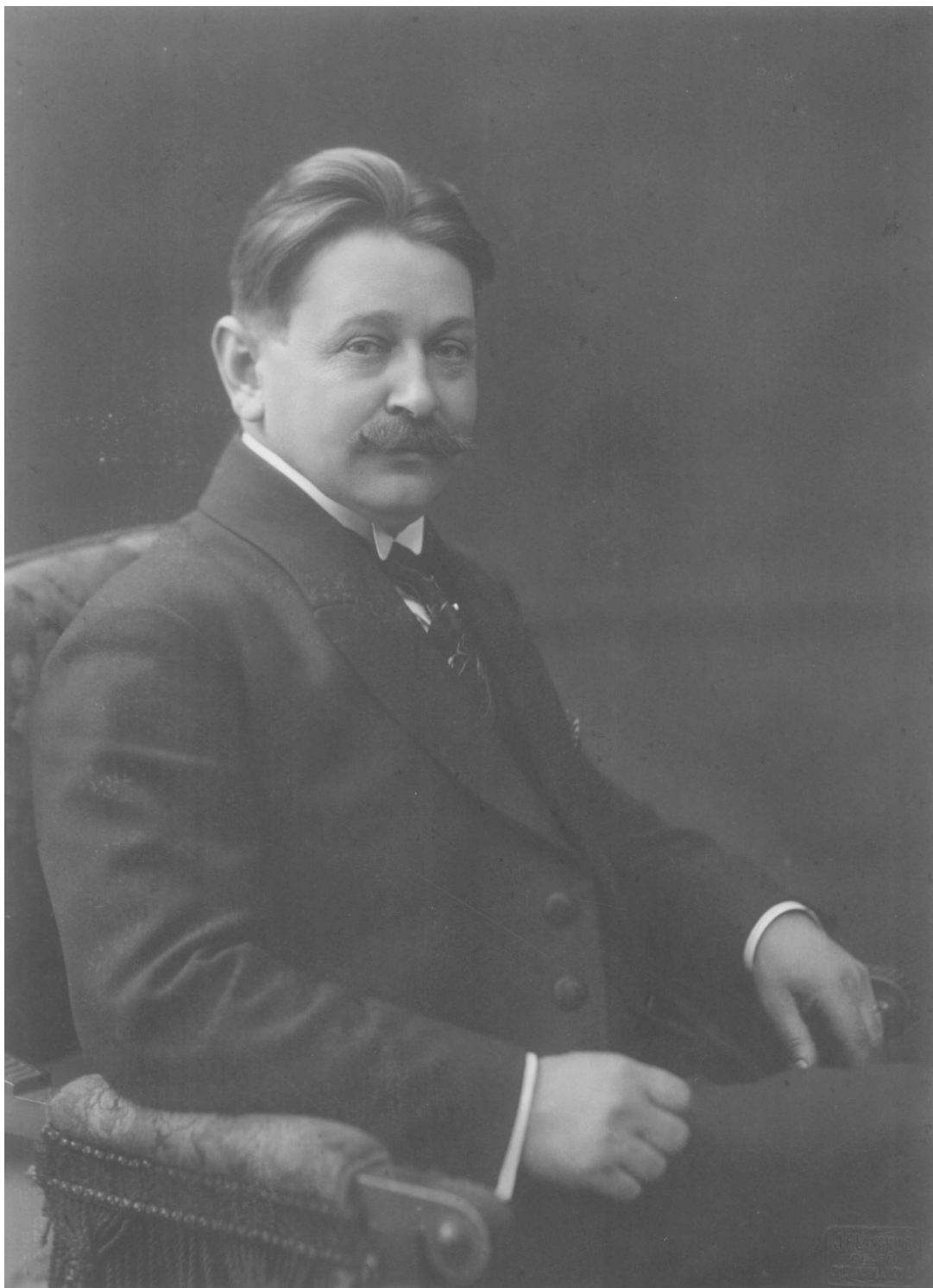
Obrázek 8: V době svého starostenství (asi 20. léta)