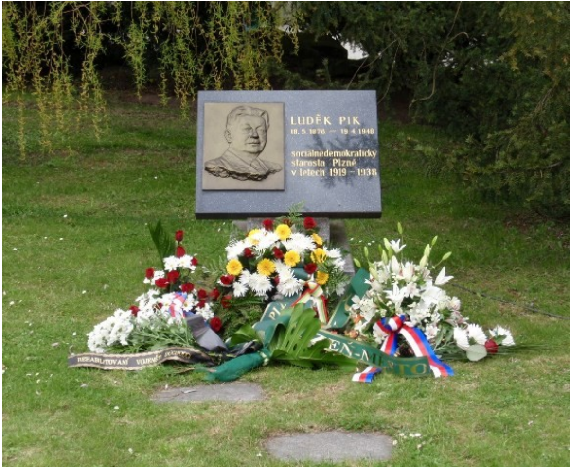
Obrázek 15: Hrob Ludřka Pika na Ústředním hřbitově v Plzni