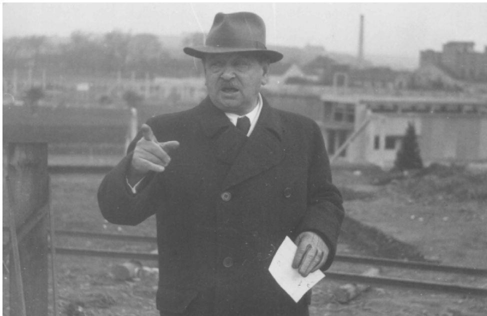
Obrázek 12: Na stavbě plzeňského výstaviště v roce 1938